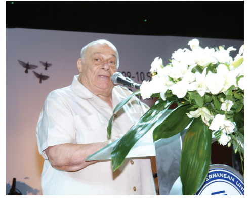
KKTC Kurucu Cumhurbaşkanı Rauf Denktaş öğrencilere seslenirken...

Öztoprak mezunlardan DAÜ'yle bağlarını koparmamalarını, hangi ülke ve hangi görevde olurlarsa olsunlar DAÜ'yü sahiplenmelerini isteyerek, “Üniversitemiz desteğinizle geliştikçe sizlerin de itibarınız artarak gelişecektir” dedi.