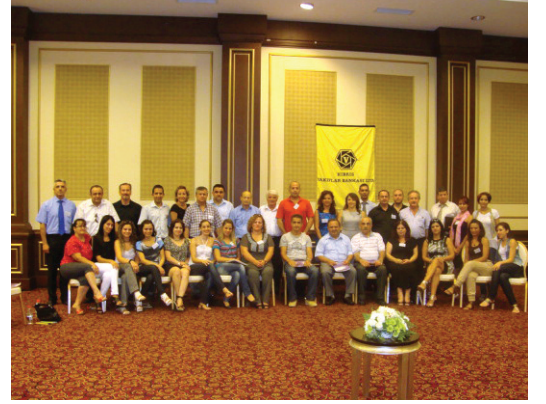
Kıbrıs Türk Vakıflar Bankası Ltd'den 39 personel çalıştay sonunda sertifikalarını aldılar

DAÜ ile Kıbrıs Vakıflar Bankası Ltd. arasında imzalanan Genel İşbirliği Protokolü kapsamında DAÜ Sürekli Eğitim Merkezi aracılığı ile Kıbrıs Vakıflar Bankası Ltd. personeline kurs, seminer ve atölye çalışmaları eğitimi verilmesi yer alıyor. Ayrıca protokol içeriğinde Kıbrıs Vakıflar Bankası Ltd.'in talepleri doğrultusunda gerekli proje ve danışmanlık hizmetlerinin sağlanması, taraflar arasında ortak etkinlikler konusunda işbirliği yapılması konuları da bulunuyor.