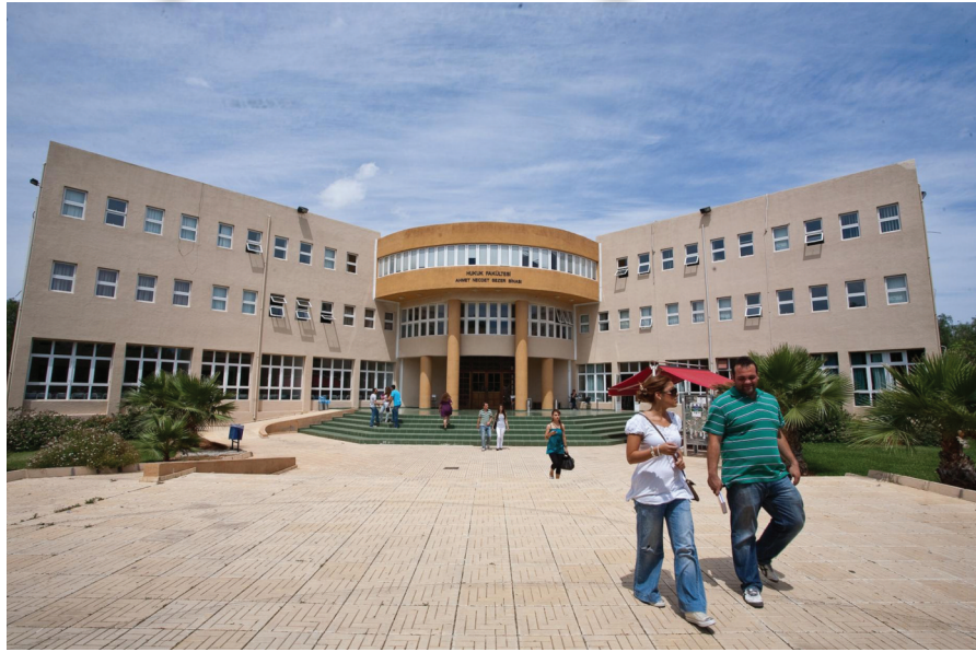
DAÜ Hukuk Fakültesi