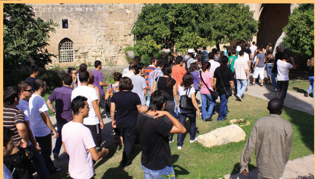
eşliğinde Büyük Han'ı ve Bellapais Manastırı'nı gezdiler.