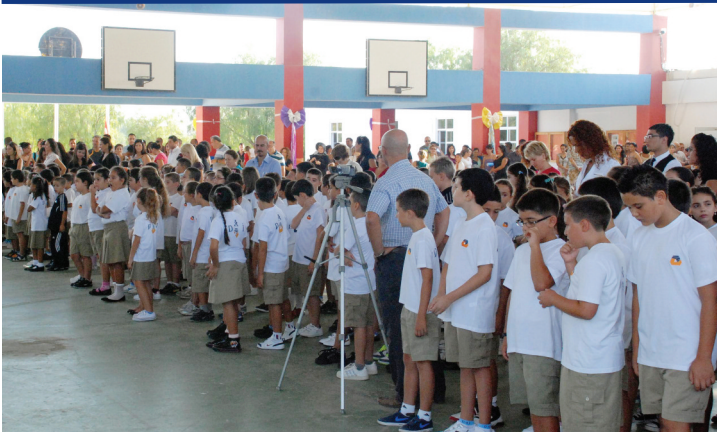
DAİ'li minikler ilk günün heyecanını yaşadılar