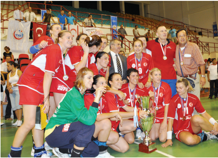
Şampiyon olan Maliye Milli Piyango takımı birarada