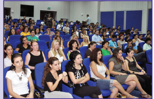
Psikoloji Bölümü Açılış Günü yoğun bir katılımı gerçekleştirdi

seminerlerde üniversitemizi temsilen Mühendislik Fakültesi Dekanları, Bölüm Başkanları, Bilgisayar-Enformatik, Bilgi Teknolojileri, Bilgisayar Teknolojisi ve Bilişim Sistemleri ve benzeri program Bölüm başkanları katıldı.