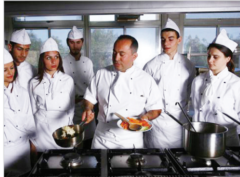
Öğrenciler Aşçılık Ön Lisans Programı'nda %100 burslu eğitim alacaklar