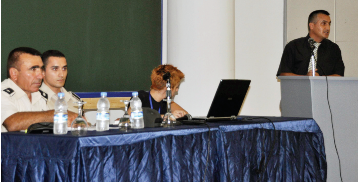
Polis Müdürlüğü tarafından yeni öğrencilere seminer verildi

Polis Müdürlüğü tarafından "KKTC'de Yapılması ve Yapılmaması Gerekenler" konulu seminerde 3 konuşmacı yer almıştır. Gazimağusa