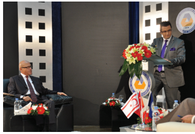
KKTC İkinci Cumhurbaşkanı Mehmet Ali Talat