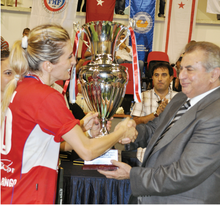
KKTC Başbakanı İrsen Küçük Şampiyonluk Kupası'nı takdim etti.