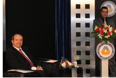
KKTC Maliye Bakanı Ersin Tatar