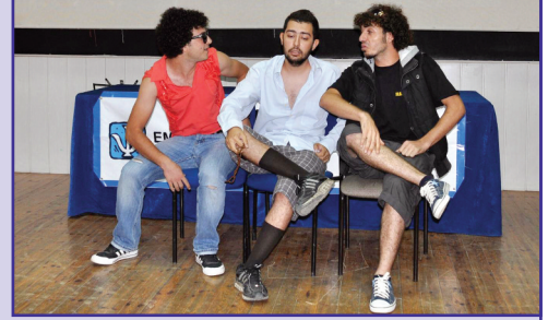
Öğrenciler psikoloji ile ilgili skeçler sundular

öğrencilere yeni akademik yılın keyifli ve başarılı geçmesini diledi. Açılış konuşmasının ardından Psikoloji hakkında ve DAÜ Psikoloji Bölümü ile ilgili bilgiler içeren slayt gösterisi gerçekleştirildi. Slayt gösterisinin ardından DAÜ Psikoloji bölümü tarafından hazırlanıp sunulan skeç gösterisi sunuldu. Gösteride psikolojik açıdan değerlendirilebilen insan karakterleri ve davranışları irdelendi. Öğrenciler tarafından hazırlanıp sunulan müzik gösterisi ile birlikte DAÜ Psikoloji Bölümü açılış günü sona erdi.