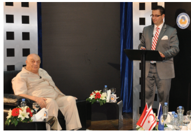
KKTC Kurucu Cumhurbaşkanı Rauf R. Denктаş

Programın ikinci bölüm konluğu ise KKTC İkinci Cumhurbaşkanı