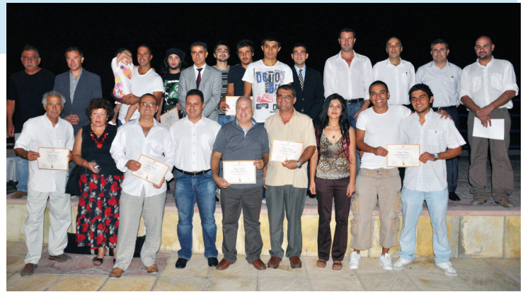
Kursa katılıp sertifika almaya hak kazanan kursiyerler birarada