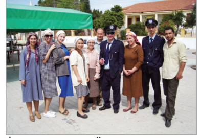
İletişim Fakültesi Öğrencileri