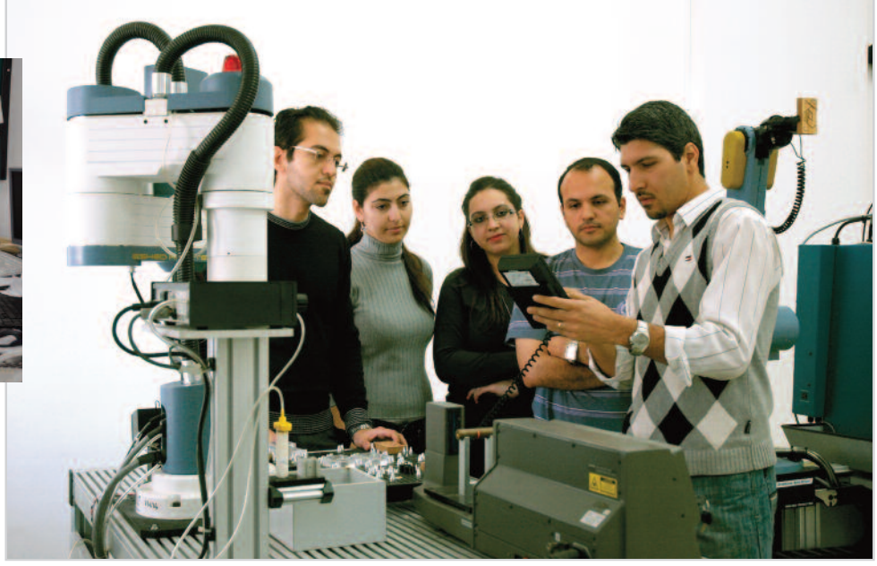
Mühendislik Fakültesi öğrencileri çift anadal yapma hakkına sahip oldular.