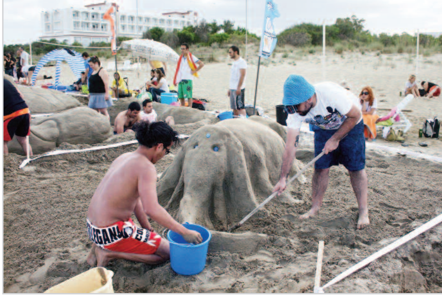
Kumdan Heykel Festivali ve Yarışması.