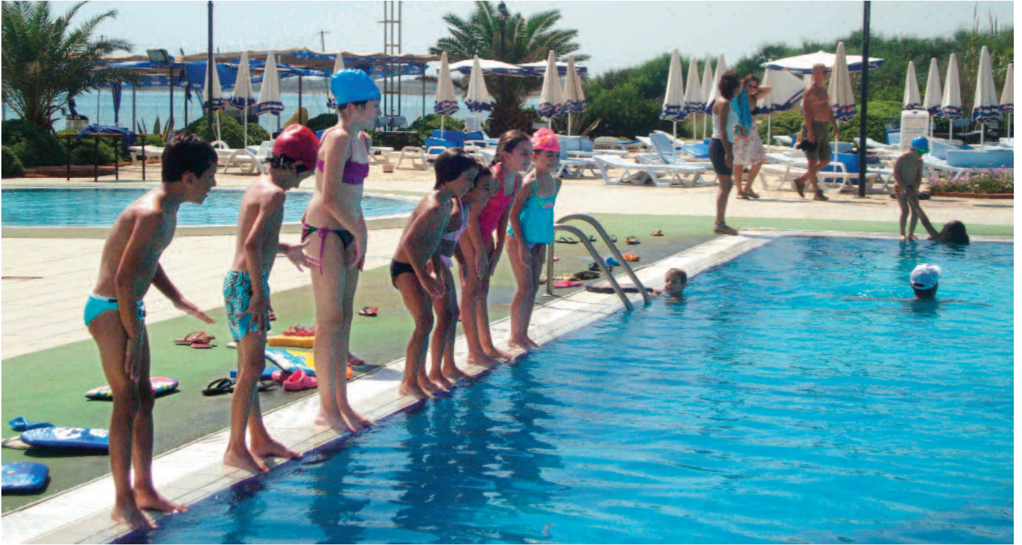
Minikler DAÜ-SEM Yüzme Kursu ile hem yüzmeyi öğrendiler hem de eğlendiler.