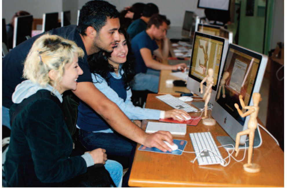
Öğrenciler Görsel Sanatlar ve Görsel Tasarım Bölümü'nde nitelikli bir eğitim alıyorlar.

Uluslararası sergi için DAÜ Görsel Sanatlar ve Görsel Tasarım Bölümü öğrencilerinin 20-30 arası