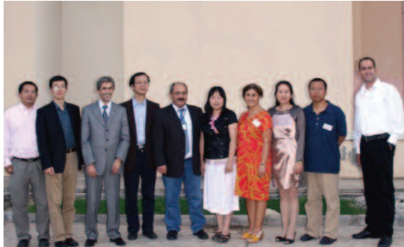
Çinli İletişimciler DAÜ İletişimcileri