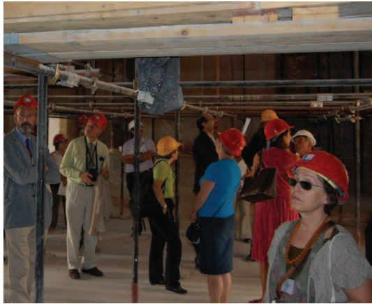
Yabancı katılımcılar koruma ve iyileştirme konusunda inceleme yaptılar.

Europa Nostra Bilim Komitesi'nin Kıbrıs'ta ilk kez, "Conservation and Enhancement in Former Conflict Zones – Eski Çatışma Bölgelerinde Koruma ve İyileştirme" teması çerçevesinde gerçekleştirdiği 47. konferansı, Gazimağusa Suriçi'nde bulunan Doğu Akdeniz Üniversitesi (DAÜ) Kültür Merkezi'nde gerçekleştirilen oturumlarla başarı ile tamamlandı. DAÜ'nün büyük bir destek verdiği konferansın Gazimağusa'da gerçekleştirilen bölümünde, İtalya, İrlanda, İngiltere, Çek Cumhuriyeti, Fransa, KKTC ve Güney Kıbrıs'tan Europa