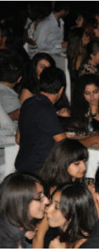
Sağlık Bilimleri Fakültesi

çekiciydi. Sürpriz müzik ve eğlence terileri ve sahilde faaliyetler damgası Sağlık Bilimleri Fakültesi öğrencileri öğlelikte keyifli bir ş yeni akade