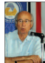
Mimarlık Fakültesi Dünya Mimarlık Günü'nü Kutladı