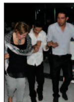
Sağlık Bilimleri Fakültesi Yeni Akademik Yıla Hoşgelden Partisi Vererek Başladı