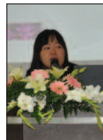
Çin-Kıbrıs Türk Medyası İrdelendi