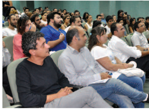
Söyleşiye yoğun ilgi oldu