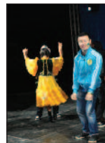
Rengarenk Uluslararası Etkinlik