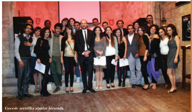
Gecede sertifika alanlar birarada.

Etkinlik, Mimarlık Bölümü öğrencileri arasında üstün başarı göstermiş olanlara yüksek onur ve onur sertifikalarının öğretim üyeleri tarafından verilmesi ile son bulmuştur.