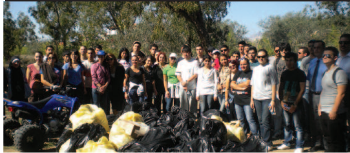
İskele piknik alanı öğrencilerimiz sayesinde temizlendi.

Doğu Akdeniz Üniversitesi (DAÜ) Yabancı Diller ve İngilizce Hazırlık Okulu'nun orta düzey (intermediate) kurunda öğretim gören öğrencileri, geçen yıl olduğu gibi bu yıl da dönem boyunca öğretmenleriyle