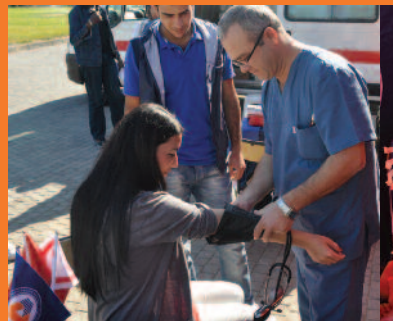
Kan bağışında bulunanlar önce muayene edildi.