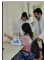
Sağlıklı Yaşam Merkezi Halka Açılıyor