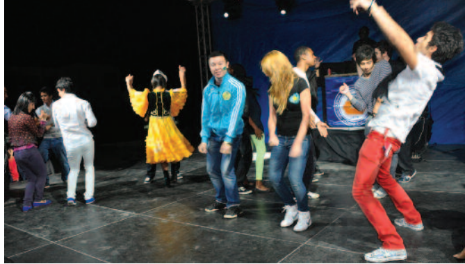
Değişik ülkelerden öğrencilerimiz, düzenlenen gecede doyasıya eğlendiler.