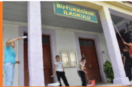
Öğrencilerimiz Büyükkonuk İlkokulu'nu boyarken

DAÜ İletişim Fakültesi Halkla İlişkiler ve Reklamcılık Bölümü son sınıf öğrencilerinden