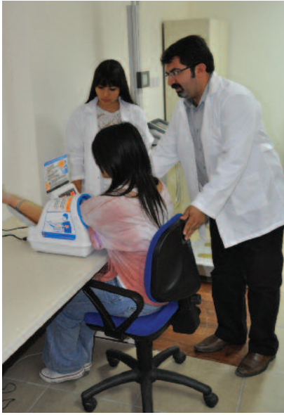
Merkeze başvuran kişilerle yakından ilgileniliyor.