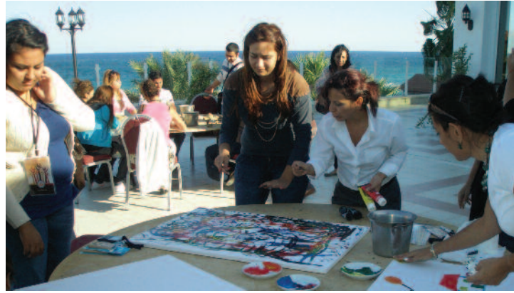
Kongrede özel eğitimle ilgili atölye çalışmalarını da yaptı