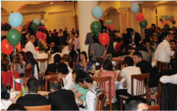
Geceye Azeriler büyük ilgi gösterdi

"Bağımsızlık Günü Kutlamaları" çerçevesinde öğrenciler geleneksel danslarından gösteriler sunup, ülkelerine özgü yemek ve kültürlerini birbirlerine tanıttılar. Bağımsızlık günü kutlamalarında 2010-2011 Akademik Yılı'nda öğrenci topluluklarında Başkanlık yapmış olan öğrencilere sertifikalar verildi.