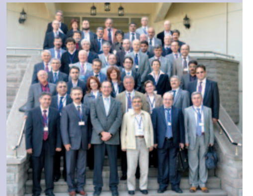
MDK Toplantısı katılımcıları birarada.

Konsey, ayrıca, Türkiye ve KKTC'de akademik alanda atılan en önemli adımlardan biri olup, yükseköğretim kalite standartları oluşumunda bir mil taşı oluşturmaktadır.