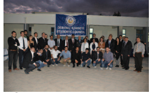
Yeni Öğrenci Konseyi birarada.