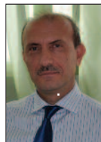
DAÜ, Uluslararası Sempozyuma Ev Sahipliği Yapmaya Hazırlanıyor