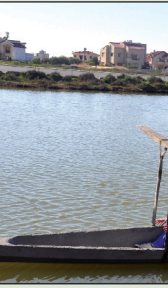
Betondan kano suya bırakıldı