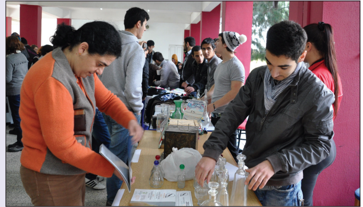
Öğrenciler kermes sırasında hem eğlendi hem de projelerinin hayata geçmesinin gururunu yaşadılar

yardımcı olunabileceği konusunda farkındalığı artırma amaçlı sunum gerçekleştirdiler.