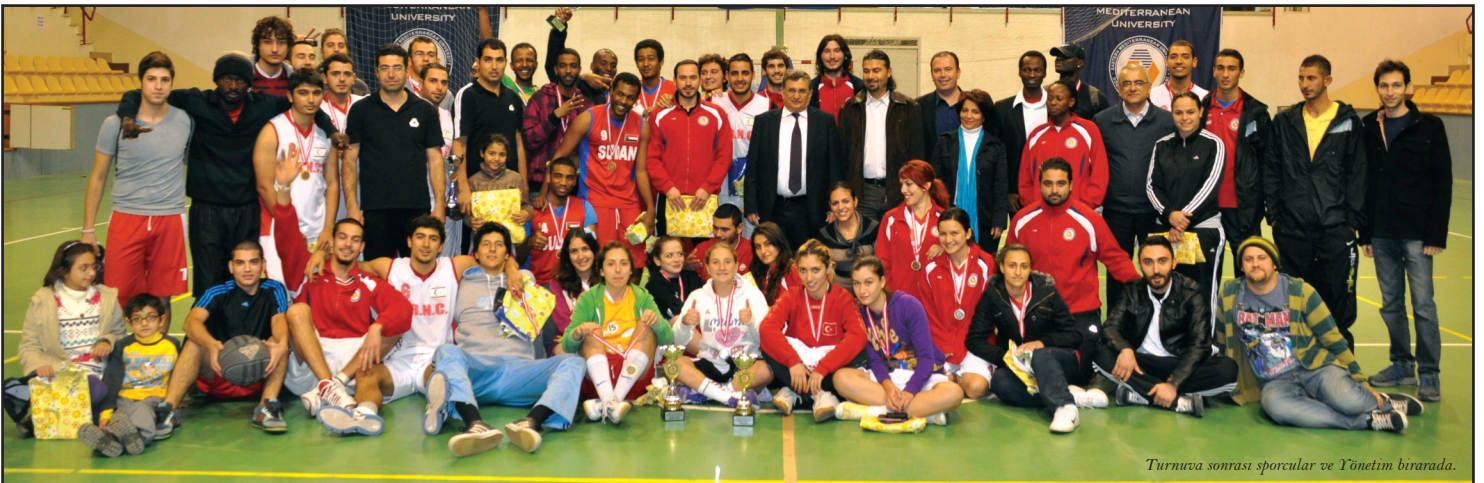
Turnuva sonrası sporcular ve Yönetim birarada.