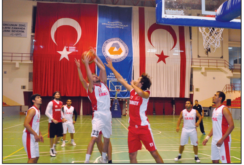
Maçlarda heyecan hakimdi

Baştan sona çekişmeli geçen Türkiye, KKTC, Sudan ve Kazakistan'ın oynadığı dördüncü final grubu maçlarının ardından, Kazakistan'ı mağlup eden Sudan turnuva 3'üncüsü olurken,