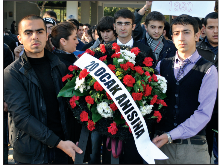
Azeri öğrenciler Atatürk Anıtı önüne çelenk bıraktı.