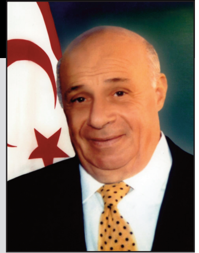
Kurucu Cumhurbaşkanı Rauf Raif Denktaş