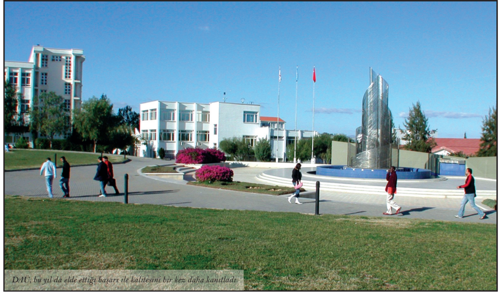
DAÜ, bu yıl da elde ettiği başarı ile kalitesini bir kez daha kanıtladı.

DAÜ'nün Eduroute tarafından yapılan sıralamada almış olduğu dereceler, yüksek öğretim kurumu