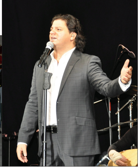
Kubat şarkılarını DAÜ'liler için seslendirdi