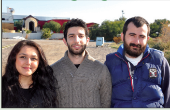
Projesi gerçekleştiren öğrenciler