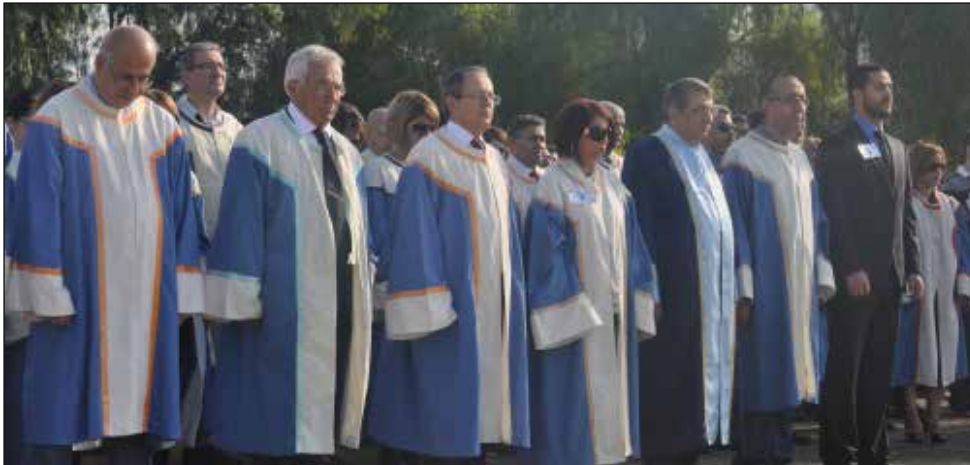
Anma Programi'na kalabalık bir akademisyen ve öğrenci topluluğu katıldı

Türk Ulusu'nun ayrılmaz bir parçası olan Kuzey Kıbrıs Türk Cumhuriyeti'nde de Atatürk ilke ve devrimlerine sonsuz bir inanç ve bağlılık vardır. İşte bu inanç ve bağlılık, Atatürk'ün "Özgürlük ve bağımsızlık benim karakterimdir" sözünü rehber almış olan Kuzey Kıbrıs Türk halkına, 38 yıldır kendi topraklarında, özgür bir devlet halinde yaşama ortamı sağlamıştır. Bu halk, Kuzey Kıbrıs Türk Cumhuriyeti devleti ile birlikte Atatürk ilke ve devrimlerini de sonsuza dek yaşatma azim ve kararlılığında olduğunu göstermiştir.