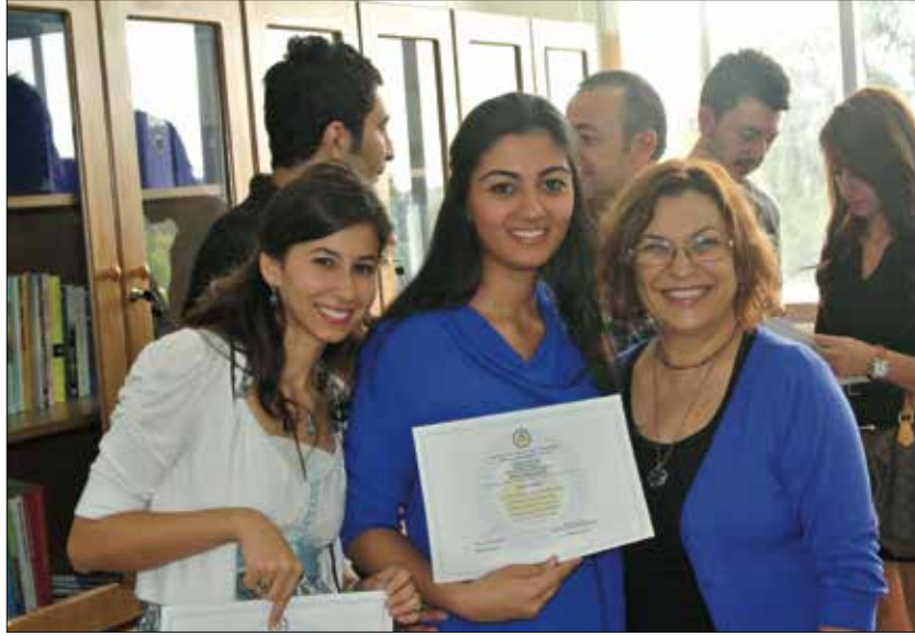
Başarılı öğrenciler şeref ve yüksek şeref sertifikalarını almanın sevincini yaşadılar