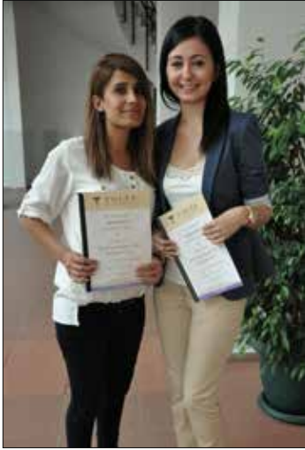
Toles sertifikası alan öğrenciler

Doğu Akdeniz Üniversitesi Yabancı Diller ve İngilizce Hazırlık Okulu ve Hukuk Fakültesi işbirliği ile başlatılan ve DAÜ Sürekli Eğitim Merkezi işbirliği ile düzenlenen Kıbrıs çapında resmi TOLES (Hukuk İngilizcesi Becerileri Sınavları) kurslarını başarı ile tamamlayıp girdikleri uluslararası TOLES sınavında başarılı olan kursiyerlere ve öğrencilere sertifikaları düzenlenen tören ile takdim edildi.