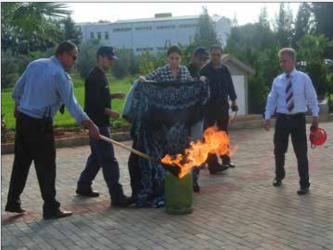
Tatbikatta LPG tüpü yangını söndürme teknikleri gösterildi