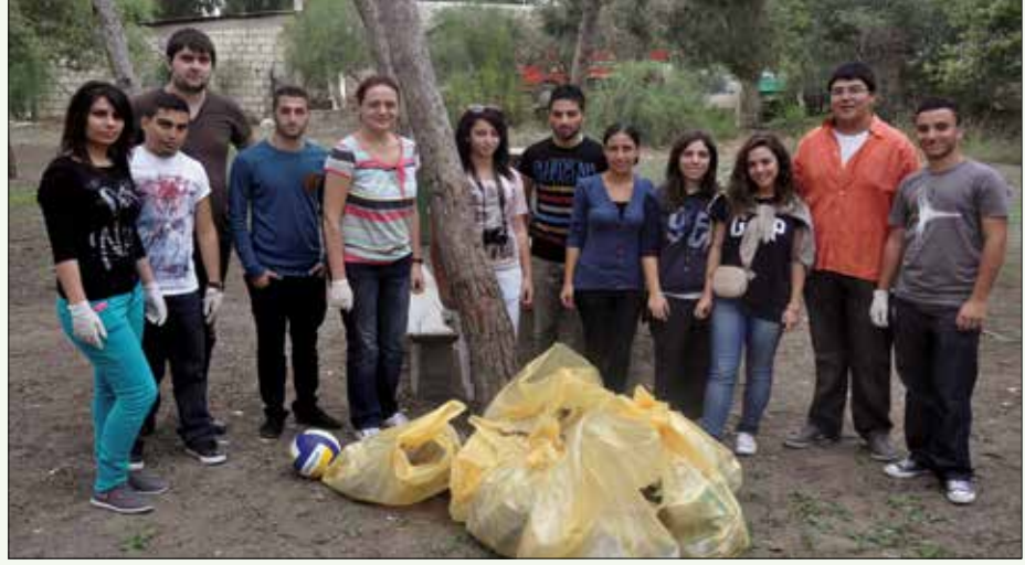
Hazırlık Okulu öğrencileri sosyal sorumluluk projeleri kapsamında Bedis Piknik Alanı'nı da temizlediler

Aynı gün içerisinde, Filistin, İran, Azerbaycan, Kırgızistan, Kazakistan, Fas ve Türkiye'den gelen öğrencilerin oluşturduğu Kıbrıs Kültürünü Tanıma Proje Grubu, Lefkoşa Surları Bölgesini ziyaret ederek oranın kültürü ile ilgili bilgi sahibi oldular. Arabahmet Bölgesi, Arabahmet Cami, Derviş Paşa Konağı ve Büyükhan öğrencilerin ziyaret et-