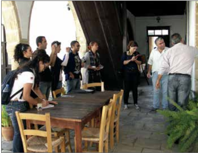
İç Mimarlık Yüksek Lisans öğrencileri Büyük Han'da incelemelerde bulundu

Doğu Akdeniz Üniversitesi (DAÜ) İç Mimarlık Bölümü'nde, 1997 yılından beri İngilizce dilinde eğitim veren lisans eğitimine ek olarak, hem tezli hem de projeli olmak üzere iki Yüksek Lisans programı ve yoğun talep üzerine bir de Türkçe dilinde eğitim veren İç Mimarlık Bölümü, 2010-2011 Güz Dönemi'nden itibaren çağdaş bir eğitim sürdürüyor. Tezli Yüksek Lisans programı çerçevesinde 2012-2013 Güz Dönemi'nde yürütülmekte olan INAR 524 kodlu yüksek lisans dersi kapsamında ülkemizin kanayan yaralarından olan tarihi eserlerin korunması ve yenilenmesine yönelik kavramlar tartışılmakta. Bu nedenle "tarihi binaların koruma ve yenileme konseptleri" (conservation and renovation concepts for historical buildings) isimli bu derste, teorik çalışmaları desteklemek üzere teknik gözlem gezileri yapılıyor.