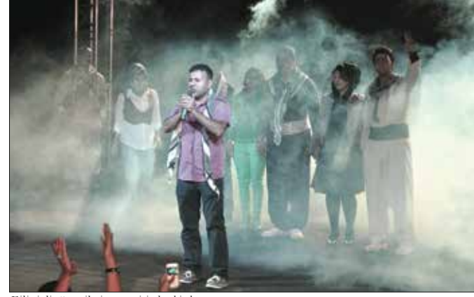
Filistinli öğrencilerin gösterisinden bir kare