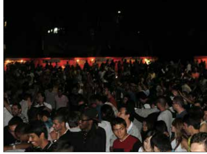
Öğrenciler gösterileri izlerken keyifli saatler geçirdi