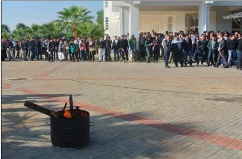
Yangın tatbikatına öğrenciler ve personel yoğun ilgi gösterdi