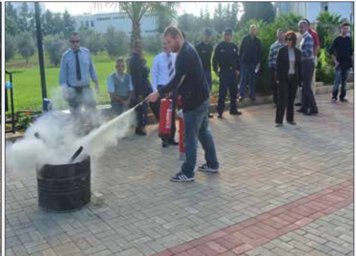
Öğrenciler yangın söndürme cihazını kullanmayı öğrendiler