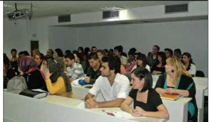
Sunuma İngiliz Dili Eğitimi Bölümü yoğun ilgi gösterdi

DAÜ İngiliz Dili Eğitimi Bölümü öğretim üyeleri, lisans, yüksek lisans ve doktora öğrencilerinin katıldığı sunumda dalında uzman Hartman, e-Library'de tüm okuyucu ve araştırmacı kitlelerinin erişebileceği akıl almaz derecede çok büyük kaynaklar bulunduğunu belirterek, İngiliz Dili Eğitimi ile doğrudan ilgili olan zengin kaynakları katılımcı öğrenciler ve öğretim üyeleri ile paylaştı. Academic OneFile, BookFlix, English Language Learner gibi bilgi-bankaları ve e-Library