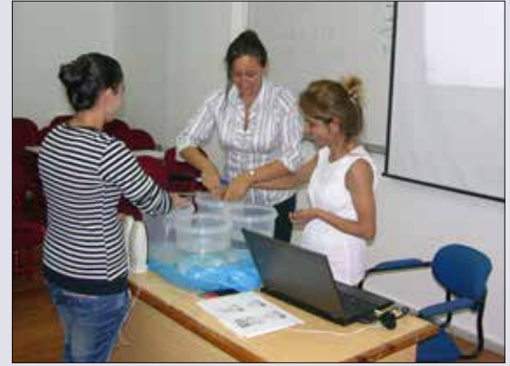
Seminerde ilginç canlandırmalar da yapıldı

gısı nedir, belirtileri nelerdir, sınav kaygısına neden olabilecek faktörler anlatıldıktan sonra sınav kaygısı ile başa çıkma yöntemleri konularında öğrencilere bilgiler veril-