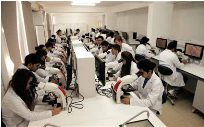
Dr. Fazıl Küçük Tıp Fakültesi

2010 - 2011 Akademik Yılı'nda Sağlık Bilimleri Fakültesi, 2011 - 2012 Akademik Yılı'nda Eczacılık Fakültesi'ni hayata geçiren DAÜ, Uluslararası Ortak Tıp Programı'nın açılmasıyla sağlık alanında önemli bir adım daha atmış oldu.