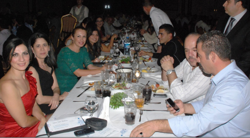
yaklaşık 750 personel katıldı

Yeni yıl düzenlenen Geleneksel DAÜ KOOP Yeni Yıl Balosu 22 Aralık tarihinde Kaya Artemis Otel'de gerçekleştirildi. Bu yıl DAÜ Personel Birliği DAÜ-PERSEN ile ortaklaşa organize edilen geceye Doğu Akdeniz Üniversitesi'nin (DAÜ) akademik, idari ve işçi kadrosundan yaklaşık 750 kişi katıldı.