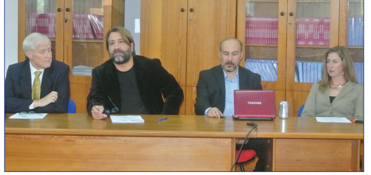
Panelde ABD Başkanlık seçimi ve sonuçları değerlendirildi