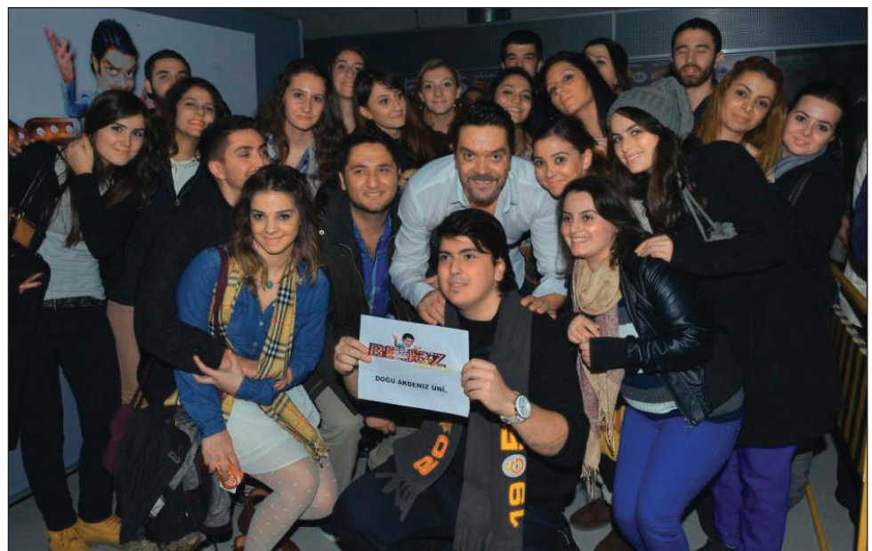
Öğrencilerimiz Beyazıt Öztürk'le hatıra fotoğrafı çektiler

Sunuculuğunu Beyazıt Öztürk'ün yaptığı Beyaz Show'un konukları, üniversiteli öğrenciler tarafından çok sevilen, pop müziğin güçlü isimlerinden Bengü; "Ağır Roman" dizisi oyuncularını Tamer Tıraşoğlu, Özge Özpınar ve Nesrin Cavazade; yaşam koçu Tuğçe İşinsu ve müzik dünyasının son dönem yükselen isimlerinden Ece Seçkin'di.