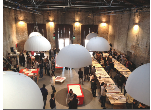
Bienal'den bir görüntü

Kuzey İtalya'nın Trento, Padova, Venedik, Lecco ve Udine kentlerindeki işlevini kaybetmiş havalimanı ve tren hangarlarının, endüstriyel yapıların ve sosyal konutların yeniden işlevlendirilerek yeni tasarlanan çok işlevli komplekslere entegre edilmesini sağlayan projeler, var olan yapısal kaynakların yeni kullanımlara adapte edilmesinden, kullanılan