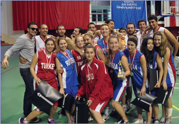
Türkiye ve Rusya basketbol takımları birarada

Karşılaşmaların ardından final gecesine yakışır bir ödül töreni ile dereceye giren takımlara ödül ve hediyeleri verildi.