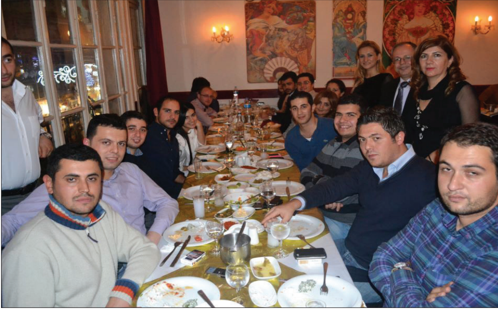
Geceye İstanbul'da yaşanan mezunlarımızdan yoğun katılım oldu