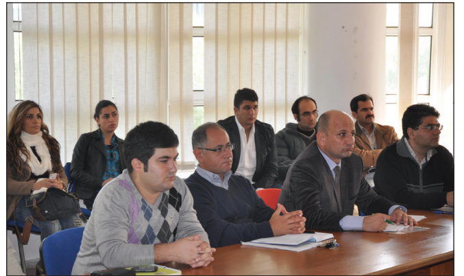
Seminere öğretim üyeleri ve öğrenciler yoğun ilgi gösterdi

Öğrencilere IMF’nin profesyonel kadrolarını oluştururken özellikle hangi eğitim ve deneyime sahip elemanlar aradığını aktaran Huddleston, IMF’de muhtemel bir kariyer için nasıl hazırlanılması gerektiği ve nelere öncelik verilmesi konusunda tavsiyelerde bulundu. Huddleston ayrıca 1949 ile 2000’li yıllar arasında dünyanın çeşitli bölgelerinde meydana gelen kriz ve sorunlardan bahsederek, 2000’li yıllarda çeşitli ülkelerin IMF ve Dünya Bankası’na olan borçlarını ödememesinin sonucu oluşan kriz, daha sonra ülkelerin IMF yerine dünya piyasalarından IMF koşulları olmadan borçlanmaya başlaması ve Euro bölgesi krizi üzere dokuz ana kriz ile ilgili izlenimlerini aktardı.