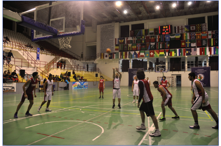
Final maçı heyecanlı dakikalara sahne oldu