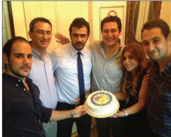
Geceye DAÜ logolu pasta da kesildi