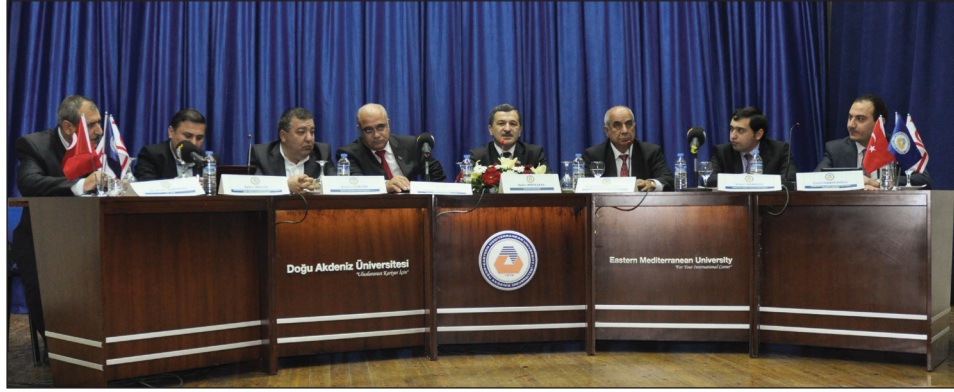
Panelistler Azerbaycan'ı tartıştı