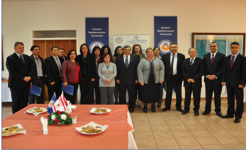
Sertifika Töreni'ne katılanlar birarada