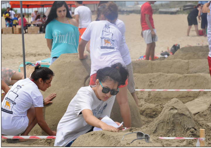
Kumdan Heykel Festivali ve Yarışması'na her geçen yıl ilgi büyüyor

festival geçtiğimiz yıllarda olduğu gibi Gazimağusa kentinin eşsiz güzellikteki kumsallarına, farklı bir heyecan, farklı bir coşku getirmiştir. DJ performansları ve barbekü partisi devam ederken, farklı ülkelerden katılan yarışmacılar, kumdan heykel yapmanın yanında, festivalde gün boyu sahilde doyasıya eğlenmiş, kendilerine has danslarıyla da renkli ve eğlenceli unutulmaz bir gün yaşamışlar ve yaşatmışlardır.