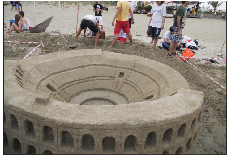
Kumdan Heykel Festivali ve Yarışması'na ödül kazanan çalışmaların bir tanesi