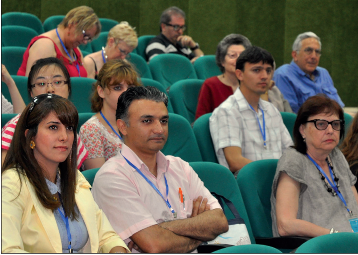
Konferansta 29 farklı ülkeden katılımcı yer aldı