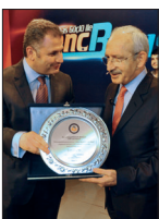
Öğrenciler Kemal Kılıçdaroğlu'nu Terletti

DAÜ çatısı altında açılacak olan yeni programlarla ilgili detaylı bilgiye ilgili akademik birimlerden, DAÜ Öğrenci İşleri Müdürlüğü'nden, DAÜ Tanıtım Ofisi'nden ve www.emu.edu.tr resmi internet sayfasından ulaşılabilir.