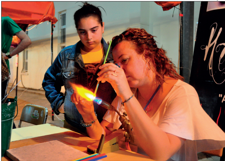
Standlarda cam aksesuar yapımı ilgi çektii