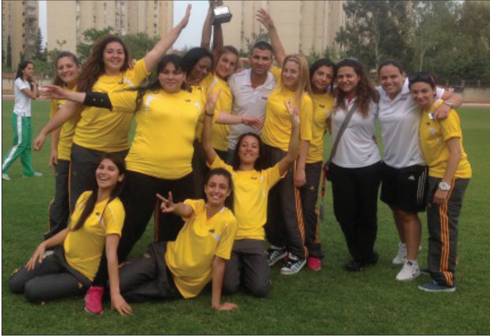
Atletizm takımımız kupaları ile