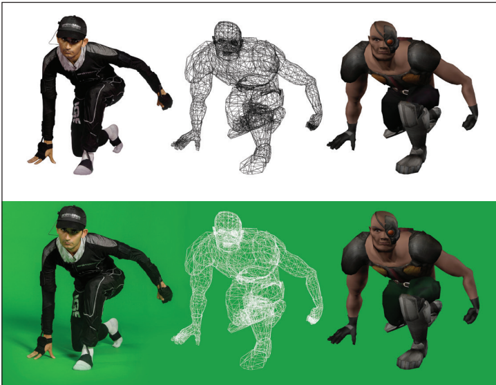
Motion Capture (Hareket yakalama) sistemi ile ilgili bir örnek

Sinemamın kalbi Hollywood'da artık Doğu Akdeniz Üniversitesi'nde kullanılan son teknoloji ürünü motion capture (hareket yakalama) sistemi (DAÜ), Görsel Sanatlar ve Görsel İletişim Tasarımı Bölümü bünye-