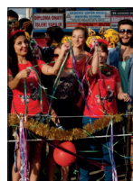
Bahar DAÜ'de Yaşanır