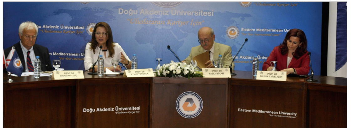
Sempozyumda Türkiye'nin Anayasası uzman hukukçular tarafından tartışıldı