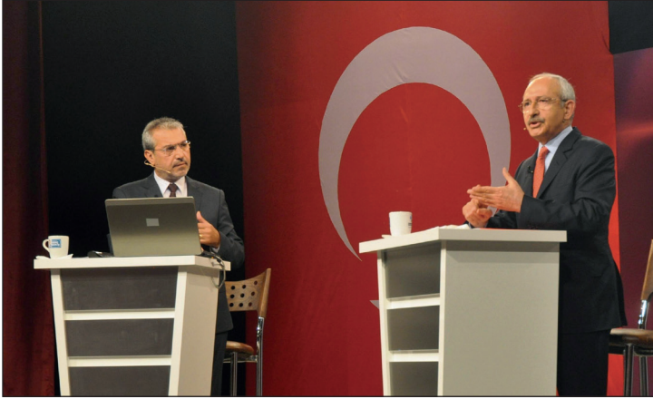
Abbas Güçlü ve Kemal Kılıçdaroğlu

Doğu Akdeniz Üniversitesi (DAÜ) her hafta Çarşamba gecelerini Perşembe gününe bağlayan geceyarısı saatlerinde, Kanal D ekranlarından canlı olarak yayımlanan "Abbas Güçlü İle Genç Bakış" programına ev sahipliği yaptı. 1 Mayıs 2013 tarihinde, saat 24:00'te, Rauf Raif Denktaş Kültür ve Kongre Sarayı'nda gerçekleştirilen programın konuğu Türkiye Cumhuriyeti Ana Muhalefet Partisi olan Cumhuriyet Halk Partisi (CHP) Genel Başkanı Kemal Kılıçdaroğlu idi. Yaklaşık 1500 öğrencinin tüm salonu doldurarak katıldığı söz konusu program Kanal D ekranlarından