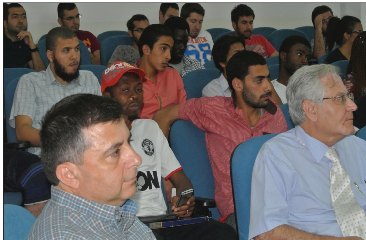
İnşaat Mühendisliği Haftası'na yoğun bir katılım oldu