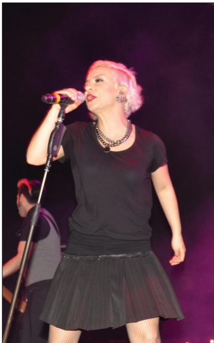
Model gençleri coşturdu