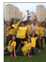
Atletizm Bayan Takımımız Türkiye 2. si