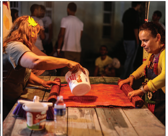
4. Sanat buluşmasında, pike yapımı çalışması