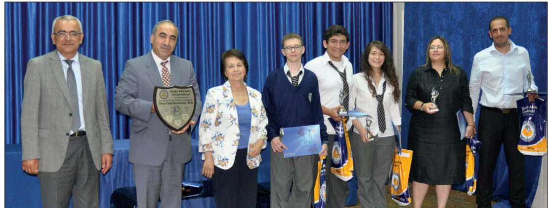
Yarışma sonrası öğrencilere ödülleri ve sertifikaları verildi