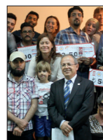
Fone Film Festivali'nde Ödül Heyecanı