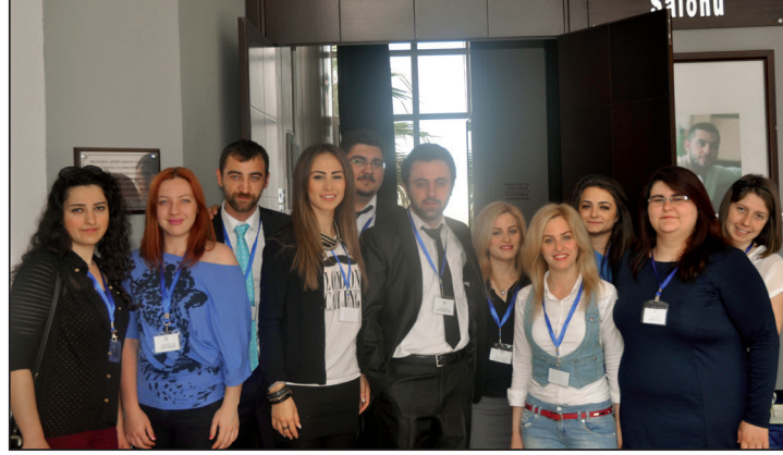
Psikoloji günleri sonrası Psikoloji Kulübü öğrencileri birarada