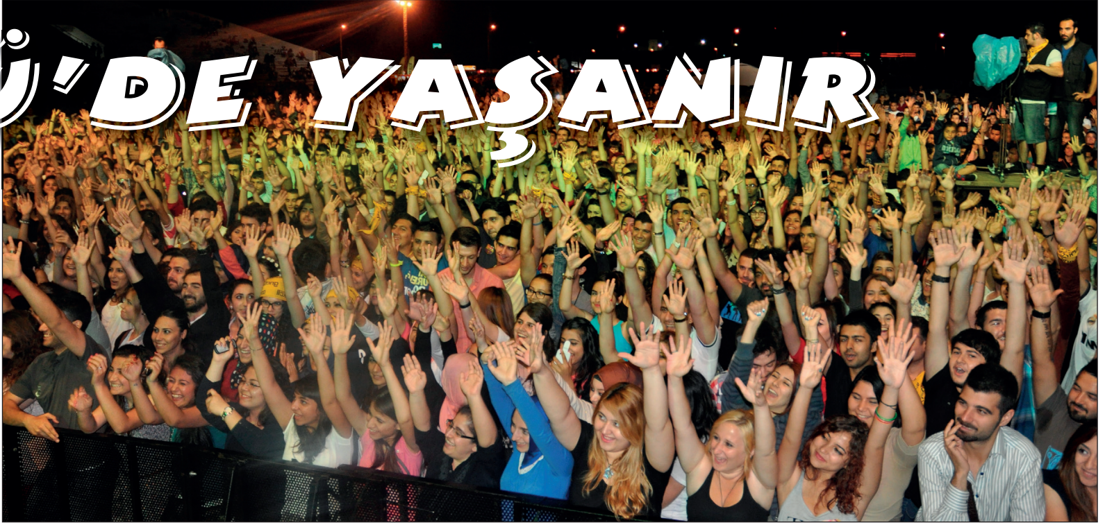
Öğrenciler konserlerle coştı