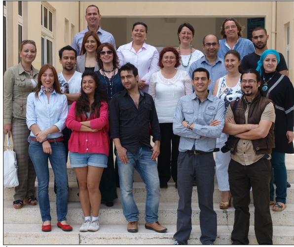
İletişim Fakültesi ailesi

Eğitim dili İngilizce olan DMF tezsiz yüksek lisans programında derece alabilmek için, 4 zorunlu, 6 seçimli, bir (kredisiz) bitirme projesi olmak üzere toplam 30 saatlik 11 ders alma zorunluluğu vardır. 2013-2014 Güz Dönemi'nde eğitime başlayacak olan DMF tezsiz yüksek lisans programı için başvurular: http://emu.edu.tr/announce/Onlineapp.htm adresinden online olarak yapılabilecektir.