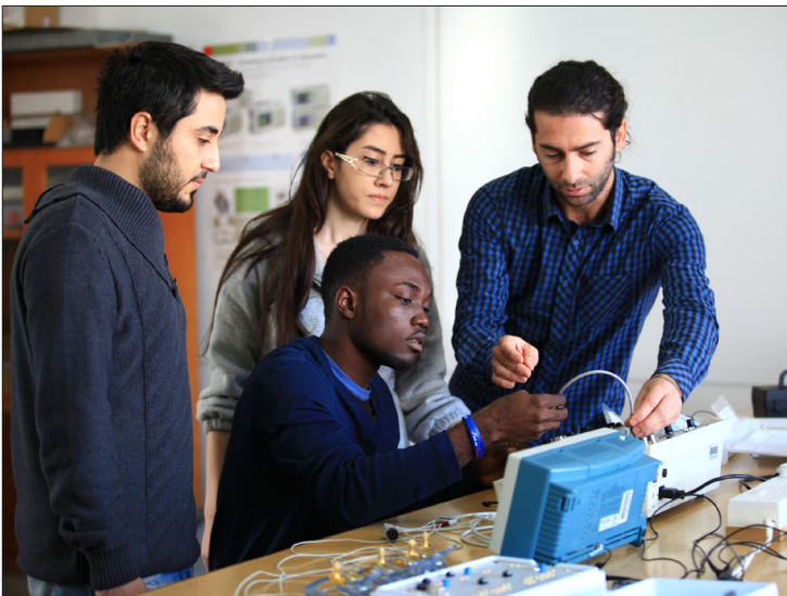
BTYO FIBAA Akreditasyonu ile bölgede ilk olacak