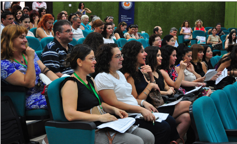
Festivale yoğun katılım oldu

Doğu Akdeniz Üniversitesi (DAÜ) Yabancı Diller ve İngilizce Hazırlık Okulu (YDİHO) tarafından 2011 yılından beri geleneksel olarak düzenlenen Atölye Çalışmaları Festivali'nin üçüncüsü, Rauf Raif Denктаş Kültür ve Kongre Sarayı'nda gerçekleştirildi.