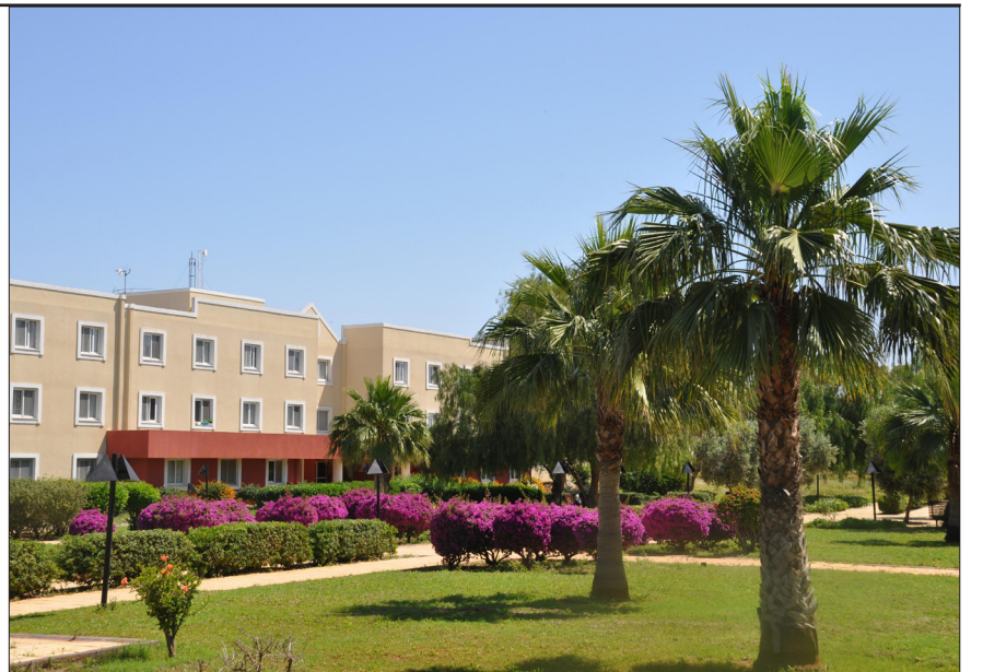
Yurtlar yeni döneme hazır

DAÜ'nün tamamen kendine ait DAÜ Kız Yurdu, Sabancı Kız Yurdu, DAÜ-2, DAÜ-