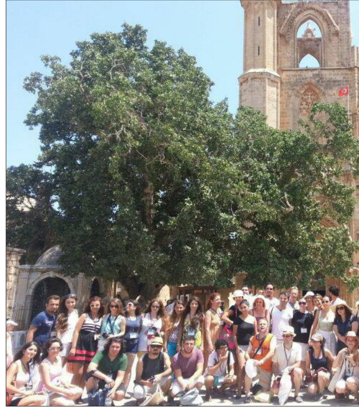
100 Ses Koro'su Gazimağusa gezisi gerçekleştirdi