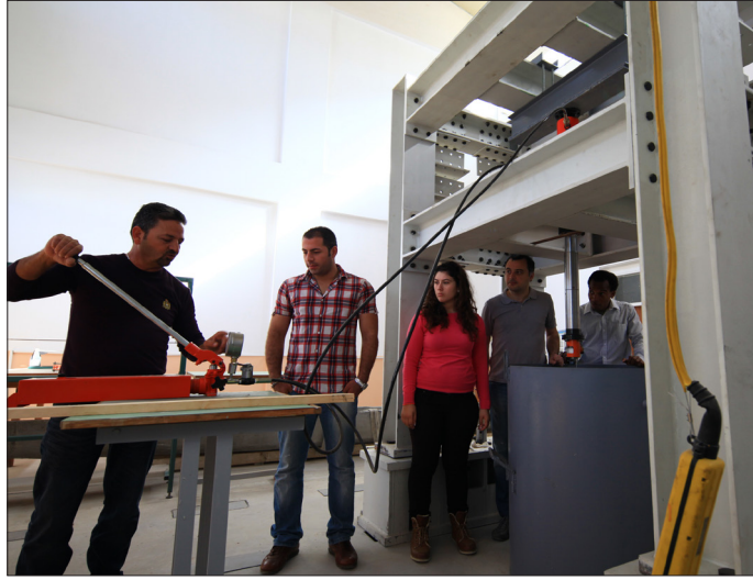
Mühendislik Fakültesi laboratuvarları uluslararası standartlarda eğitim sunuyor

Mimarlık Bölümü, MİAK gibi ulusal ve RIBA (Royal Institute of British Architects) ile NAAB (The National Architectural Accrediting Board) gibi uluslararası akreditasyon süreçlerine büyük bir şeffaflıkla katılımını desteklemektedir.