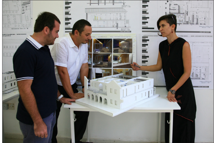
Mimarlık Fakültesi MİAK Akreditasyonu ile fark yaratıyor