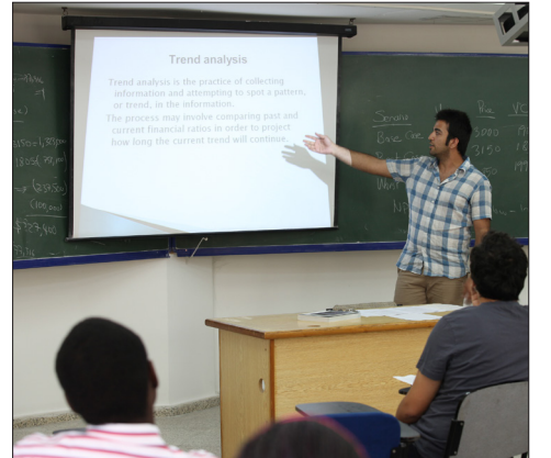
Napoli Üniversitesi işbirliği ile öğrenciler uluslararası eğitim alıyor

DAÜ Uygulamalı Bilimler Yüksek Okulu ile Napoli Üniversitesi işbirliği çerçevesinde başarılı 3. sınıf ve Yüksek Lisans programındaki öğrencilere Napoli Üniversitesi'nde 10 günlük eğitim imkanı sunuluyor. Katılan öğrenciler 10 günlük eğitim sürecinde 4 farklı hocadan "Innovation Management" dersi alıyorlar. DAÜ Uygulamalı Bilimler Yüksek Okulu teorik bilgi ile pratik bilgi doğrultusunda öğrencilerini hayata hazırlamakta olup Lisans ve Yüksek Lisans öğrencilerini mezuniyet sonrası iş hayatında rekabet edebilecek bireyler olarak yetiştirmek amacı içerisindedir. DAÜ Uygulamalı Bilimler Yüksek Okulu Napoli Üniversitesi ile gerçekleştirilen işbirliği anlaşması doğrultusunda Avrupa Birliği düzeyinde eğitim verdiğini de kanıtlamıştır.