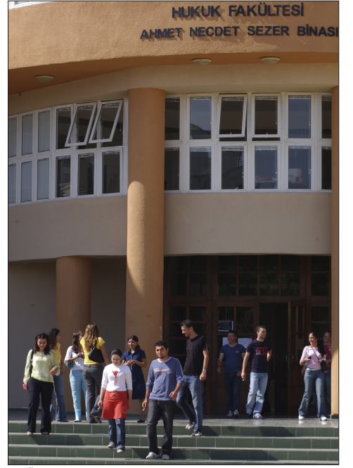
DAÜ Hukuk Fakültesi

DAÜ Hukuk Fakültesi temsilcileri 14-16 Mart 2013 tarihleri arasında Almanya'nın Münster kentinde, Münster Üniversitesi'nin ev sahipliğinde gerçekleştirilen ELFA'nın yıllık