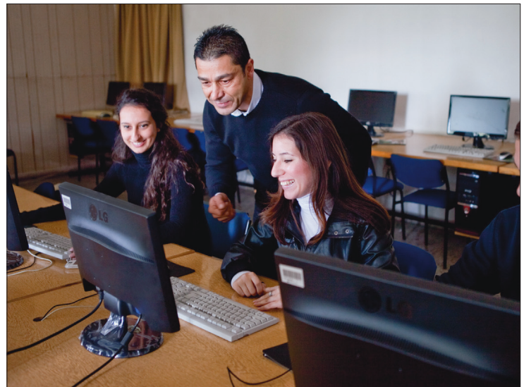
BTYO BTBS Programı ASIIN Akreditasyonu ile fark yaratıyor