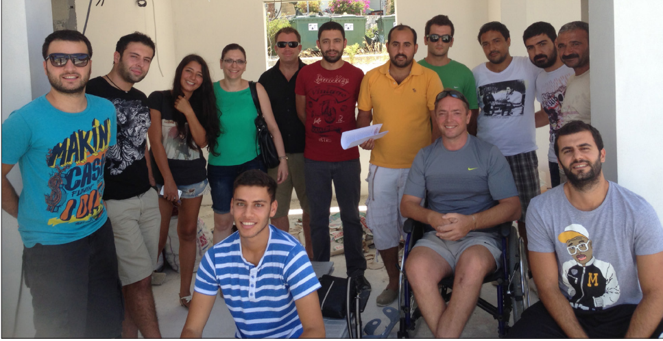
İnşaat Mühendisliği Bölümü öğrencileri yararlı bir teknik geziye katıldı

Doğu Akdeniz Üniversitesi (DAÜ), Mühendislik Fakültesi İnşaat Mühendisliği Bölümü, yaz okulu dersleri bünyesinde yürütülen Mühendislikte Sürdürülebilirlik dersi kapsamında sürdürülebilir kalkınma dalında 2011 yılı Platinium ödül sahibi "The Property Centre"’i ziyaret etti. Öğrencilere teorik bilginin yanında uygulamalı olarak inceleme fırsatı da sunan DAÜ sayesinde öğrenciler şirketin Girne Çatalköy bölgesinde bulunan inşaatlarını gezerek inceledi.