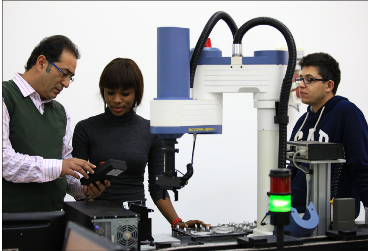
Endüstri Mühendisliği Bölümü de ABET Akreditasyonu'na sahip