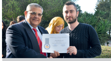
DAÜ İngiliz Dili Eğitimi Bölümü Başarılı Öğrencilerini Ödüllendirdi