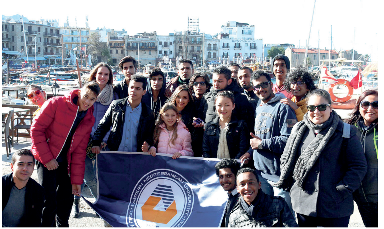
Yabancı Diller ve İngilizce Hazırlık Okulu öğrencileri Girne'de

öğrenciler Girne'nin turistik yerlerini de gezerek mutlu bir şekilde Gazimağusa'ya döndüler.