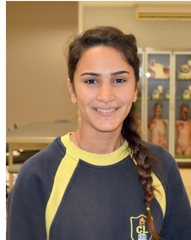
Buse Fidan Cumhuriyet Lisesi Son Sınıf Öğrencisi

Ben Eczacılık alanında eğitim almak istiyorum. DAÜ tercihlerim arasında olan bir üniversite. Uluslararası olması ve İngilizce dilinde eğitim vermesi çok güzel. DAÜ'de birbirinden farklı kültürler bir arada eğitim alıyorlar. Eğitim kalitesi açısından da KKTC'de en iyi üniversite olduğunu biliyorum. Atölye çalışması sayesinde de ileride eğitim almayı düşündüğüm bölüm hakkında detaylı bilgi sahibi oldum.