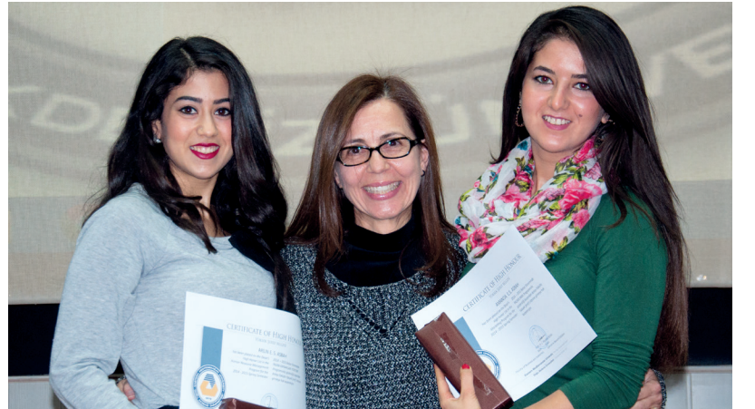
Öğrenciler sertifikalarını fakülte öğretim görevlilerinden aldı