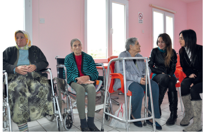
Öğrenciler site sakinleri ile bol bol sohbet etti

Ben 2 yıldır burada yaşıyorum ve günlerimiz çok güzel geçiyor. Çok güzel arkadaşlıklar kurduk. Bir aile gibi olduk burada ve ziyaretçilerin gelmesi ile çok daha mutlu oluyoruz.