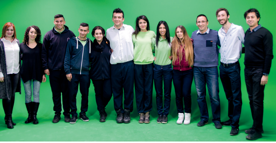
Sanatlar ve Görsel İletişim Tasarımı Bölümü atölye çalışması