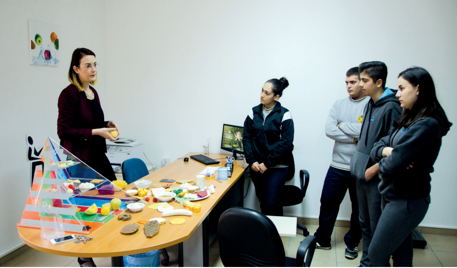
Diyet ve Beslenme ve Diyetetik Bölümü atölye çalışması