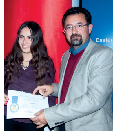
2. Moleküler Biyoloji ve Genetik Kariyer Günü'nde öğrencilere şeref ve yüksek şeref belgeleri de takdim edildi