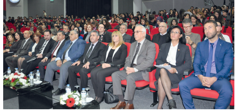
Panelde yoğun bir katılım oldu