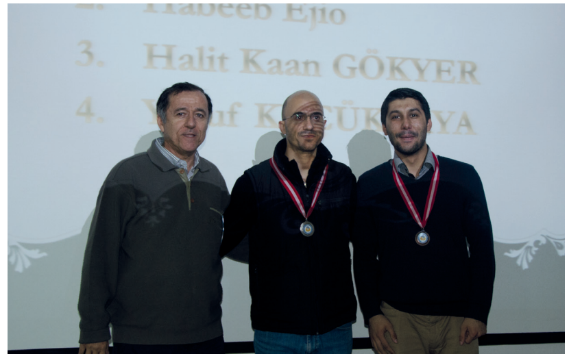
Törende yüksek şeref ve şeref sertifikaları ile yarışmalarda derece alan öğrenci ve akademisyenlere madalyaları takdim edildi