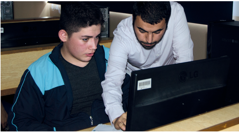
Kursta öğrenciler Java ile ilgili bilgiler edindiler