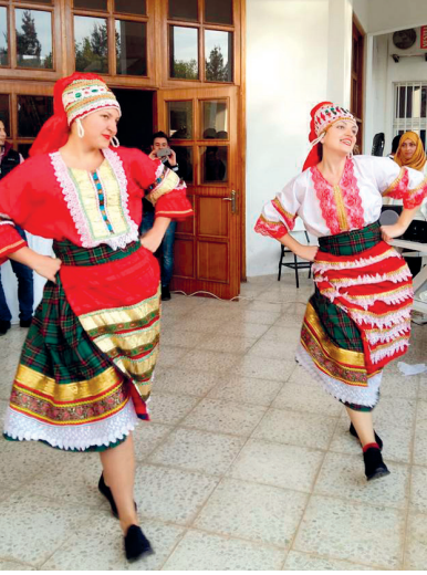
Etkinlik danslarla renklendi

farklı lezzetleri tadan bölüm öğrencileri ve öğretim üyeleri, farklı kültürlerden derlenen şarkılarla keyifli saatler geçirdiler. 20'den fazla farklı ülkeden gelen İngiliz Dili Eğitimi Bölümü öğrencileri, hem Kıbrıs müzik ve danslarıyla, hem de kendi kültürlerine ait müzik ve danslarla yeni yıla ilk merhabalarını demiş oldular.