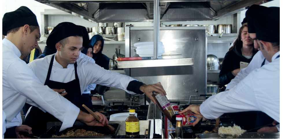
Gastronomi ve Mutfak Sanatları Bölümü atölye çalışması

Atölye çalışmaları öğrenciler için çok faydalı bir organizasyon. Bizler okulda bir takım uygulamalı dersler yapıyoruz ancak DAÜ'de alanında uzman kişiler tarafından bire bir yerinde görme ve uygulamalara katılma şansı bulmaları öğrenciler için büyük bir şans. Bölüm olarak tanıtımlar yapıldığında öğrencilerin üzerinde daha iyi etki bırakıyor ve karar verme süreçlerini kolaylaştırıyor.