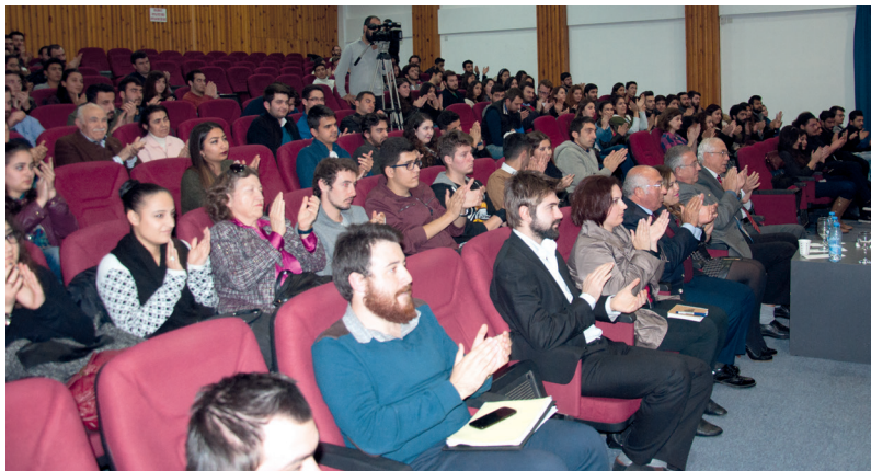
Konferansa yoğun bir katılım oldu