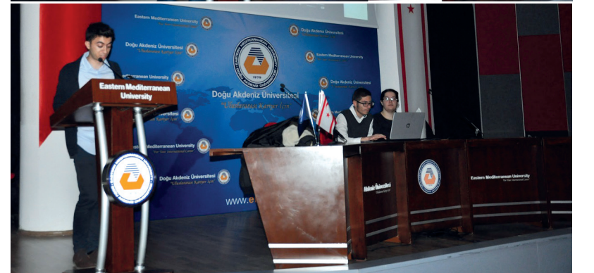
Film gösterimlerinden önce öğrenciler çevirileri hakkında sunum yaptılar