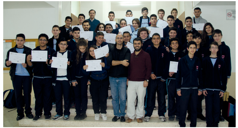
Kursa katılan öğrenciler ve kurs veren öğretim görevlileri birarada