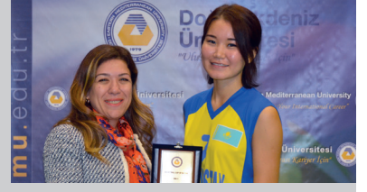
"Cup Of Nation Basketball" Turnuvası Tamamlandı