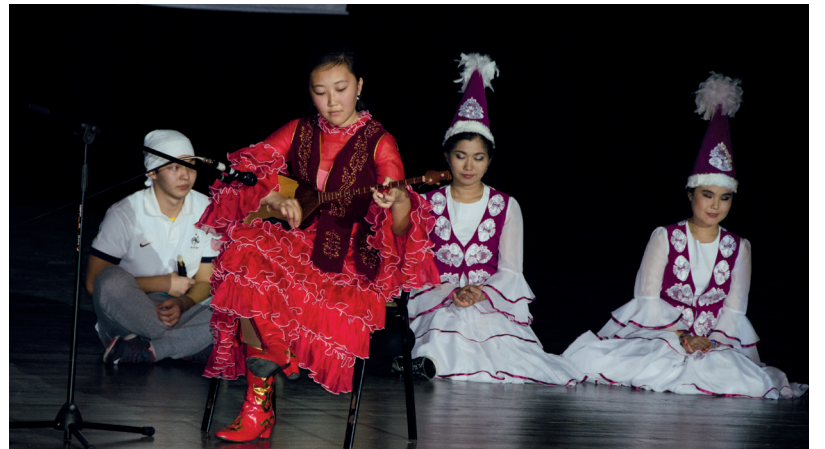
Gecede Kazakistan'la ilgili birçok gösteri gerçekleştirildi