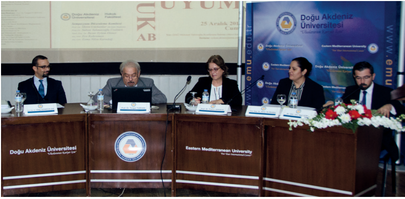
İkinci oturumdan bir kare