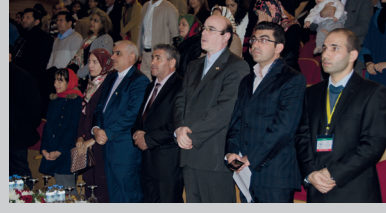
DAÜ'de İran Yalda Gecesi Gerçekleştirildi