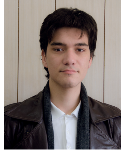
İsmet Taluk Anafartalar Lisesi Son Sınıf Öğrencisi

Bizler için çok faydalı bir gün. Özellikle karar vermede zorlanan öğrenciler için atölye çalışmaları çok yararlı oluyor. Bugün hocalar bizlerle çok ilgilendi ve DAÜ en iyi üniversiteler arasında yer alıyor, bu yüzden ilk tercihim kesinlikle DAÜ'dür.