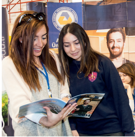
Lise öğrencileri akademik birimler tarafından bilgilendirildiler