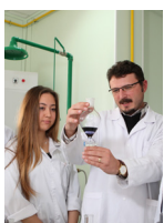
DAÜ Giriş ve Burs Sınavı 2 Haziran'da Yapılıyor