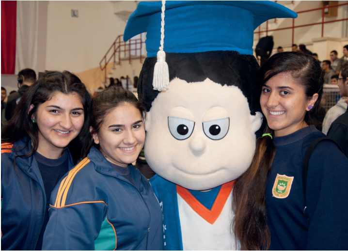
Lise öğrencileri DAÜ maskotu ile hatıra fotoğrafı çektiler

Üç gün boyunca "DAÜ 5. Tanıtım Günleri"ne katılan liseli gençler, akademik bilgi almalarının yanında aktiviteler, gösteriler, müzik ve oyunlar eşliğinde keyifli saatler de geçirdiler.