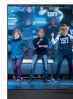
Tanıtım Günleri'nde Öğrenciler Eğlenceli Saatler Geçirdi