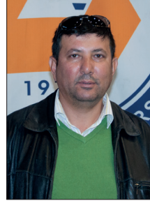
Nizamettin Önal Değirmenlik Lisesi Son Sınıf Öğrencisi

Tanıtım günlerinde öğrencilerimiz bilgi alma fırsatı buluyorlar ve bu öğrencileri daha fazla motive ediyor. Etkinliklerle birlikte tanıtım günleri ilgi çekici oluyor ve öğrenciler bilgi alırken eğleniyorlar. DAÜ çok önemli atılımlar yaptı ve KKTC'nin en iyi üniversitesidir. DAÜ daha emin ve sağlam adımlarla ilerliyor ve bu öğrenci kalitesinin yükselmesini sağlıyor.