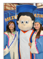
Etkinlik Hakkında Ne Dediler?