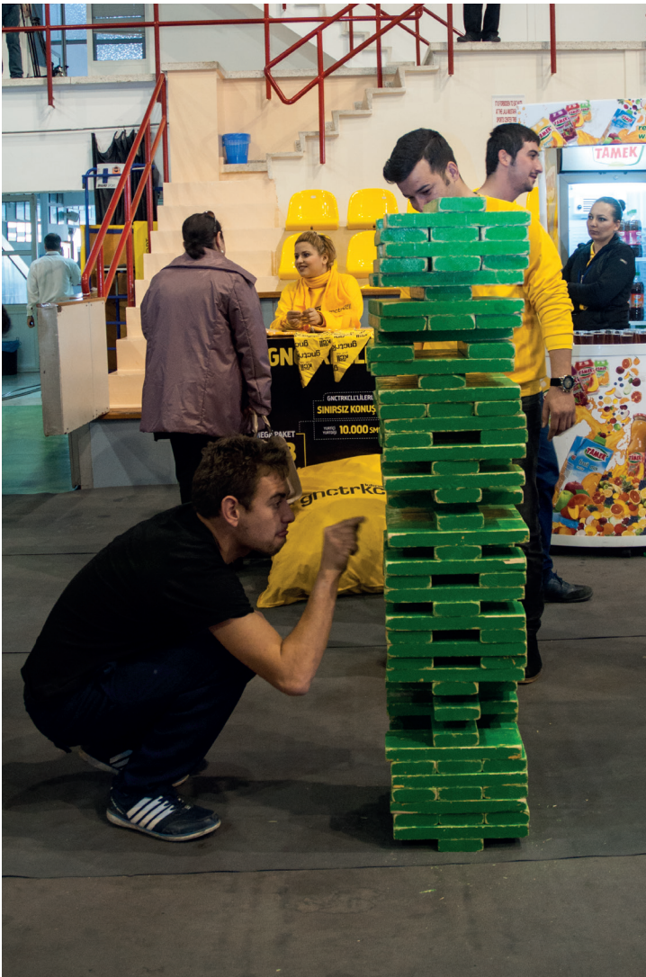
Tanıtım Günleri'nde öğrencilerin keyif alacağı etkinlikler düzenlendi