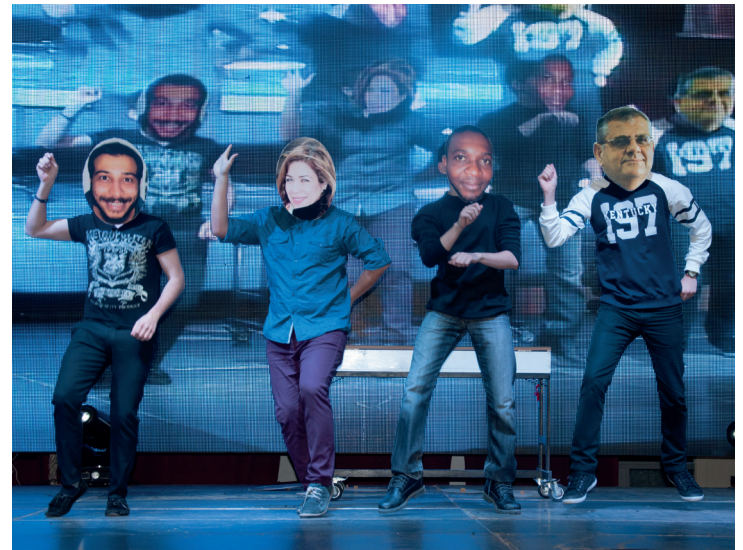
Etkinlikte renkli ve eğlenceli sahne şovları da gerçekleştirildi