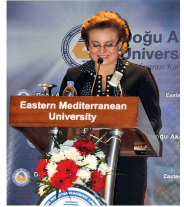
Kongre kapsamında "Sağlık ve Medya" paneli de gerçekleştirildi

hastalığı, hipertansiyon, dislipidemi, fiziksel inaktivite, insülin direnci, diyabet biyopsikosozyal açıdan inter-disipliner bakışla irdelendi ve çözüm önerileri tartışıldı.