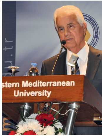
Dr. Derviş Eroğlu

Cumhurbaşkanı Dr. Eroğlu Cumhurbaşkanı Dr. Derviş Eroğlu açılış töreninde yaptığı konuşmada, kongre konusunun önemine dikkat çekerek, düzenleyenleri