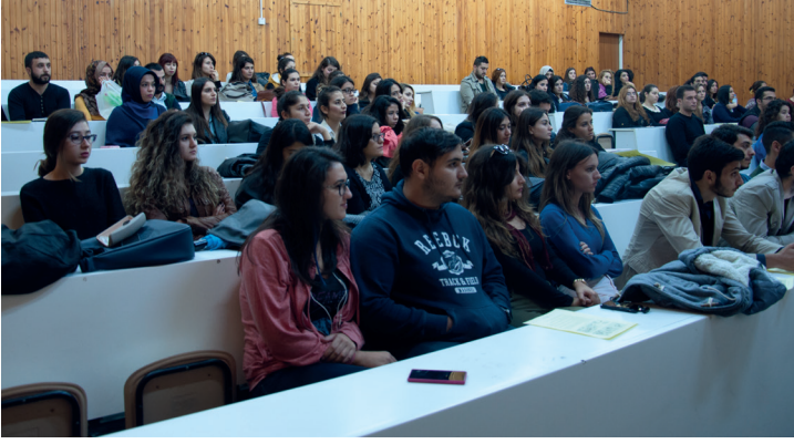
Etkinliklerde öğrenciler çocuk ve kadın hakları konusunda bilgilendirildiler

Doğu Akdeniz Üniversitesi Psikolojik Danışmanlık, Rehberlik ve Araştırma Merkezi (DAÜ – PDRAM), hem 20 Kasım Dünya Çocuk Hakları Günü hem de 25 Kasım Kadına Yönelik Şiddete Karşı Uluslararası Mücadele ve Dayanışma Günü'ne yönelik farkındalık artırma amacıyla çeşitli etkinlikler düzenledi.