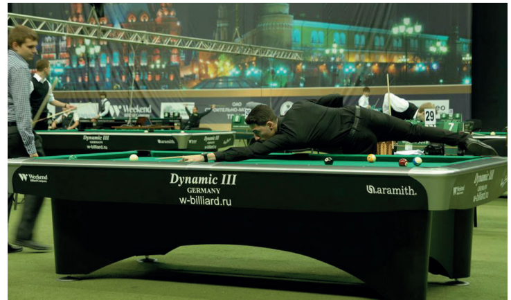
Bilardocularımız turnuvada tecrübe edindiler.