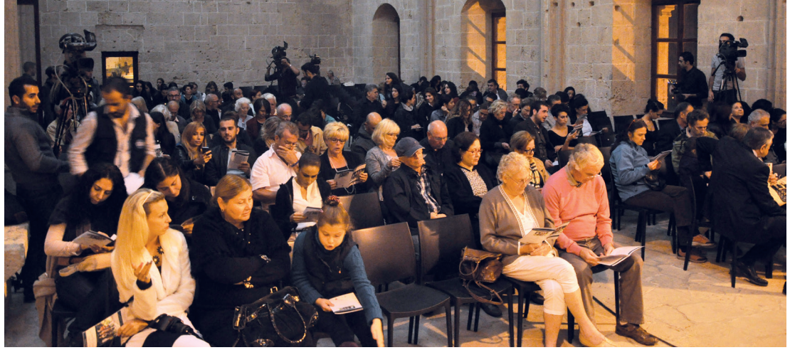
Konsere Kuzey ve Güney Kıbrıs'tan müzik severler ilgi gösterdi