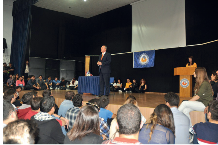
Muharrem İnce'nin konferansını kalabalık bir öğrenci topluluğu izledi

Söyleşi sonunda Muharrem İnce'ye teşekkür plaketi takdim edildi ve hatıra fotoğrafı çekildi.