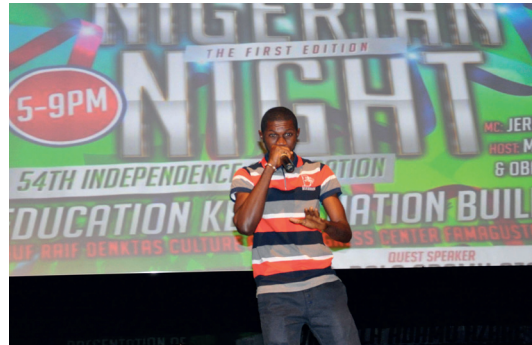
Gecede müzik performansları ve kültürel danslar ilgiyle izlendi