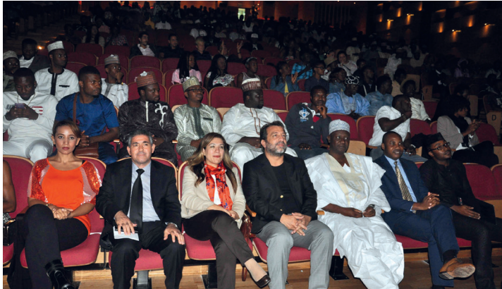
Nijerya Bağımsızlık Günü etkinliğine katılım yoğun oldu

sındaki yakın ilişkiyi vurguladı. Etkinlik sırasında Topluluğu'na teşekkür ve aynı zamanda gösteren öğrencilerle bir araya geldi. Kültürel performansları, dansları, içerdiği bir kollektiflik öğrencilerin ilgi ile karşıladı.