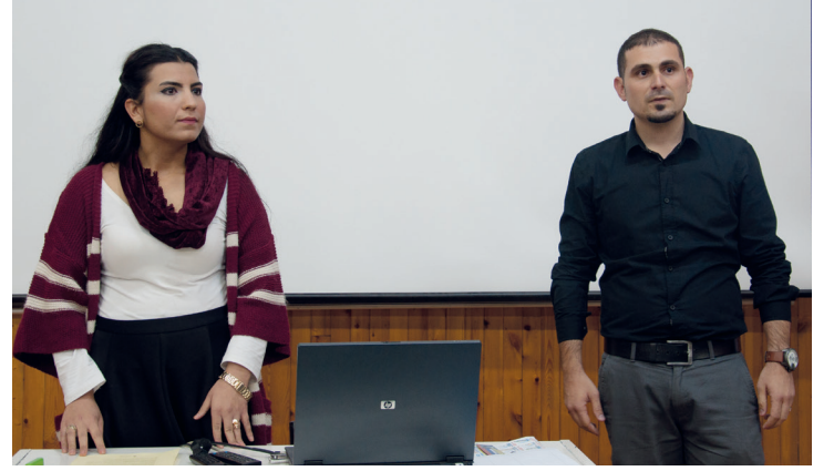
DAÜ – PDRAM uzman psikologları çocuk ve kadın hakları konusunda konuşmalar yaptılar