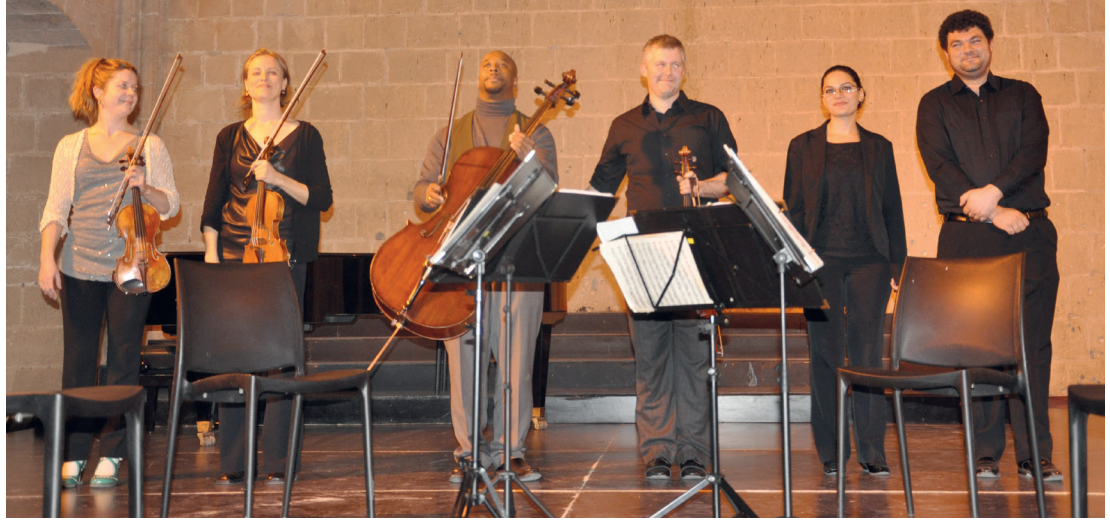
Grup üyeleri konser sonrası halkı selamlarken