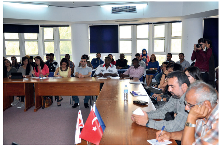
Konferansa özellikle Siyaset Bilimi ve Uluslararası İlişkiler öğrencileri ilgi gösterdi