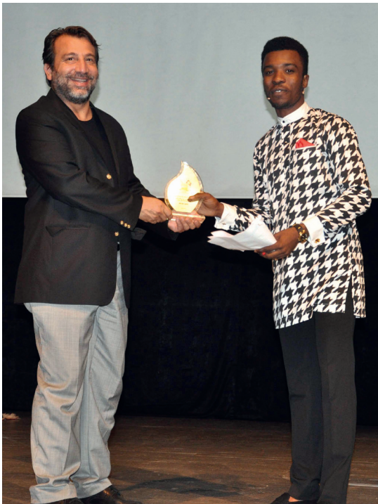
Etkinlikte Nijerya Öğrenci Topluluğu'na katkıda bulunanlara plaket takdim edildi

ki yakın ilişkilere de değindi. lik sırasında Nijerya Öğrenci ılığu'na katkıda bulunanlara mada zamanda akademik başarı ren öğrencilere plaket sunul- ültürel danslar, müzik perfor- ları, drama ve moda şovları bir kokteyl ile sona eren et- öğrenciler tarafından büyük e karşılandı.