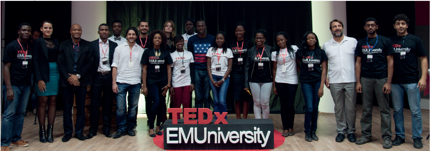
Konferans konuşmacıları ve organizasyon ekibi bir arada