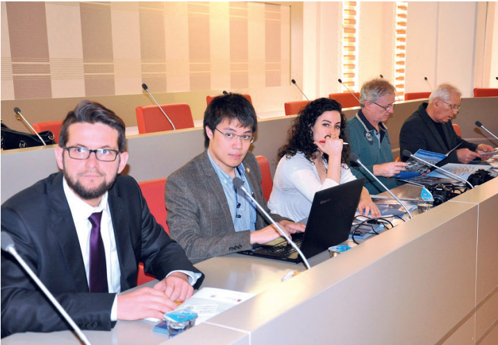
KKTC'nin kuruluş yıldönümü için ülkeye gelen gazeteciler DAÜ'de