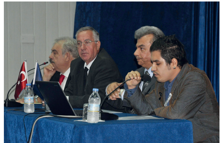
Anma programı kapsamında bir de panel gerçekleştirildi