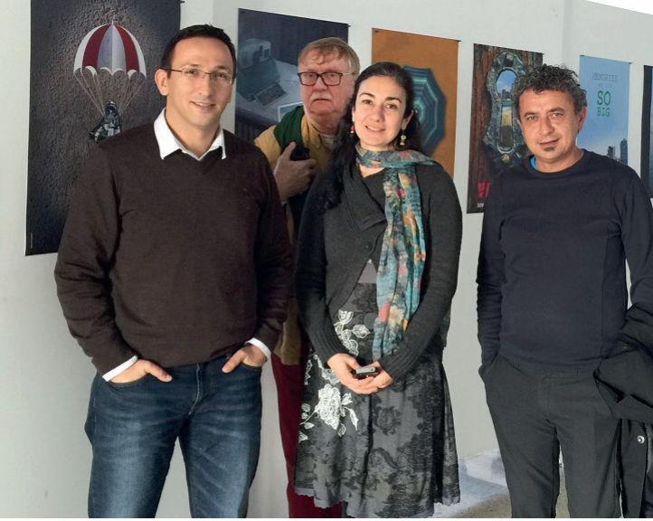
RMU'dan gelen misafirler bölümü inceleme fırsatı buldular