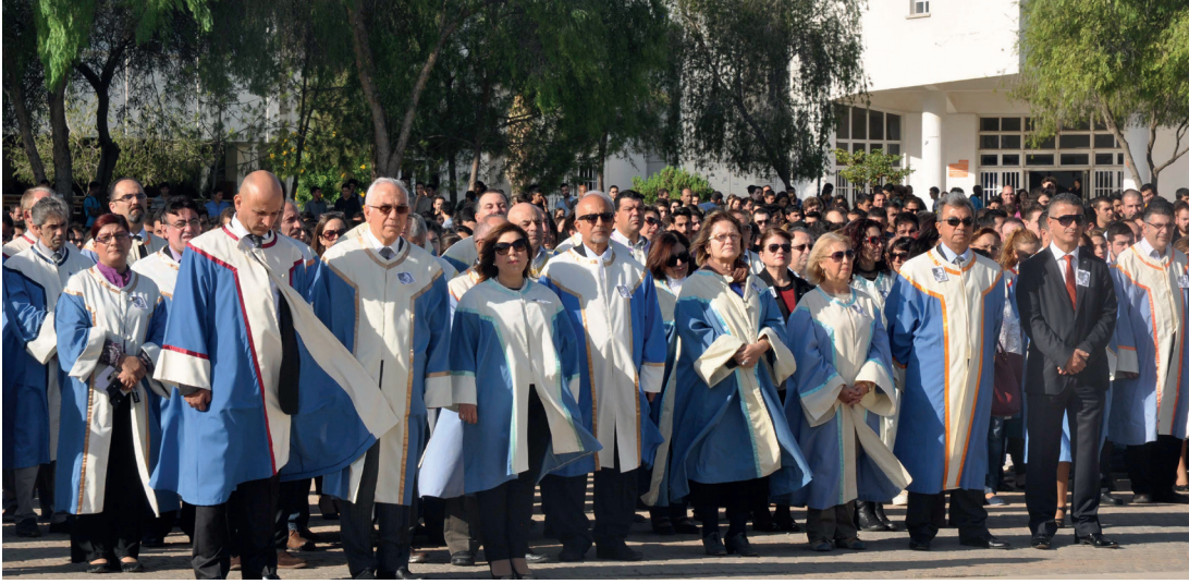
Akademik ve yönetsel personel ile öğrenciler Anma Töreni'nde biraraya geldi

Ulu Önder Mustafa Kemal Atatürk, Doğu Akdeniz Üniversitesi Atatürk Araştırma ve Uygulama Merkezi (DAÜ – ATAUM) tarafından organize edilen törenlerle ölümünün 76. yılında DAÜ'de saygı ile anıldı.