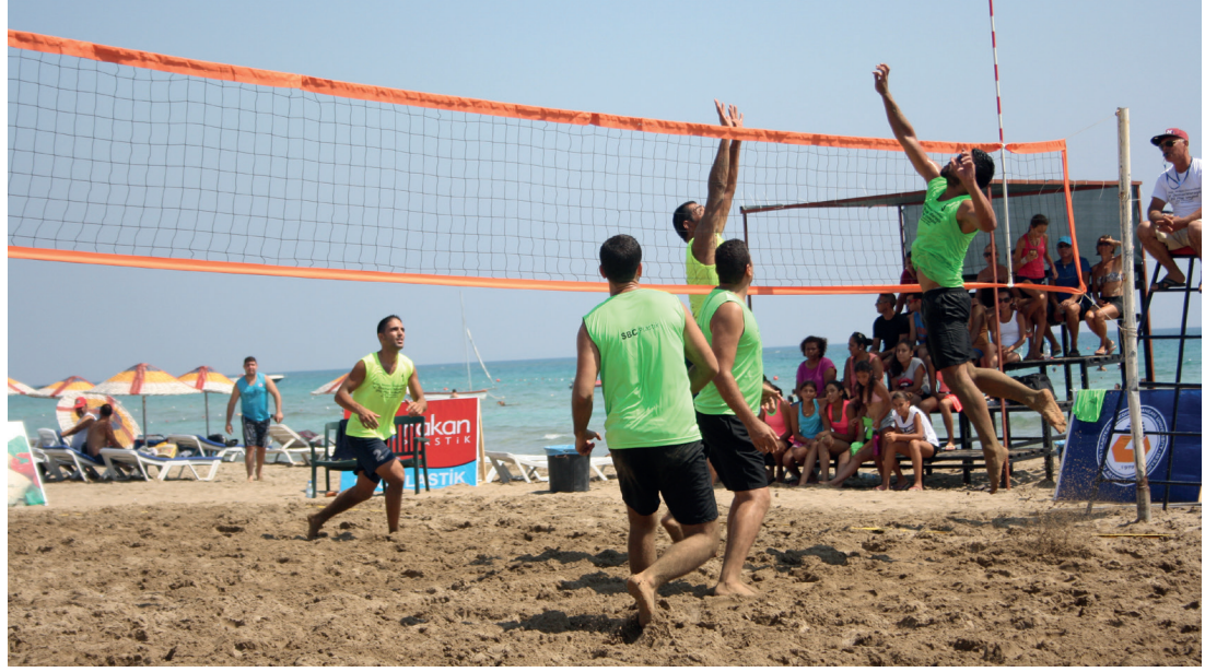
Turnuva heyecanlı maçlara sahne oldu