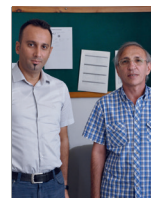
Matematik Bölümü Öğretim Üyeleri Türkiye'de İlk 15'e Giren Matematikçiler Arasında Yer Aldı