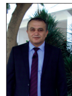
Eğitim Fakültesi Eğitimde Öncü Rol Oynuyor