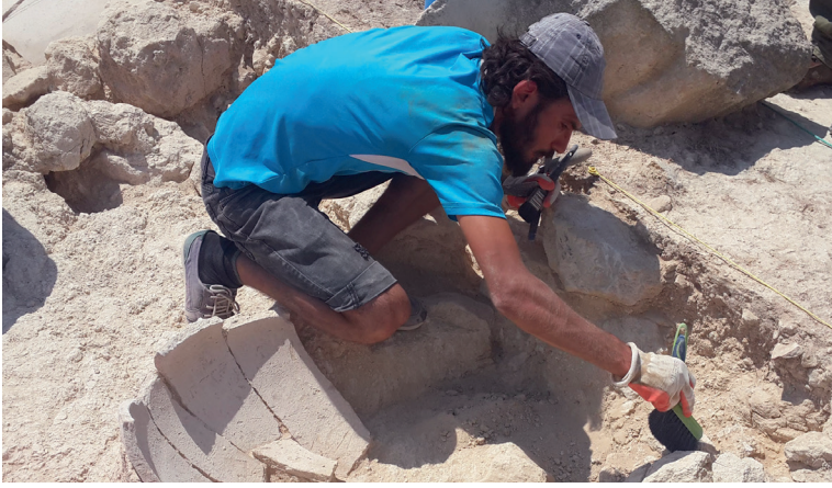
Kazı alanında çalışmalar büyük bir titizlikle sürdürülüyor