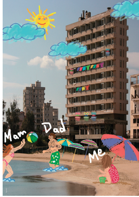
Bienale katılacak olan öğrenci çalışmalarımız

Bienalin ana sergi mekânı ise Galata Özel Rum İlköğretim Okulu olacak. Akademi Programı bünyesindeki sergilerin de Tophane – Karaköy hattında izleyiciyle buluşması planlanıyor.