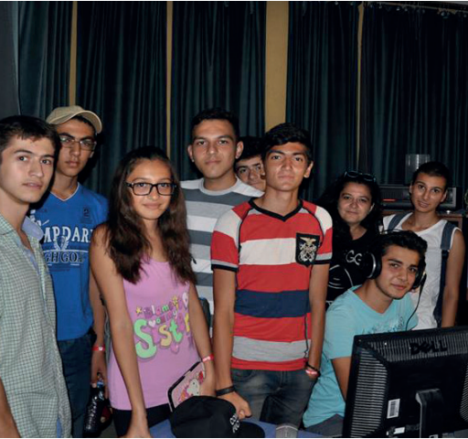
Azerbaycan'lı öğrenciler Radyo DAÜ'ye de ziyaret etti