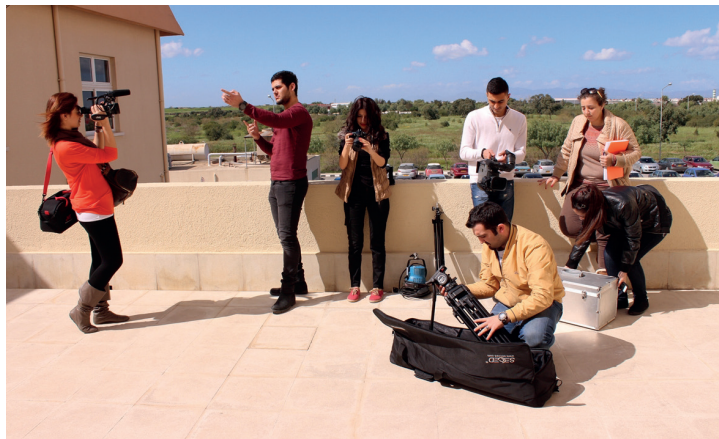
Bölüm öğrencileri pratik çalışmalar yapıyorlar