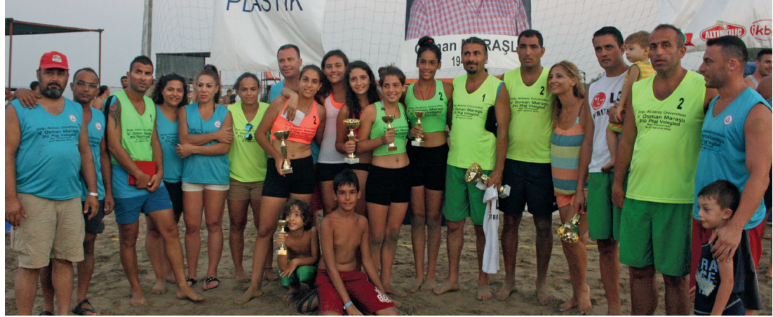
Turnuvada ödül alanlar birarada