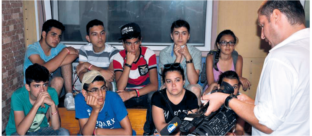
Öğrenciler kameralarla ilgili anlatılanları ilgiyle dinledi