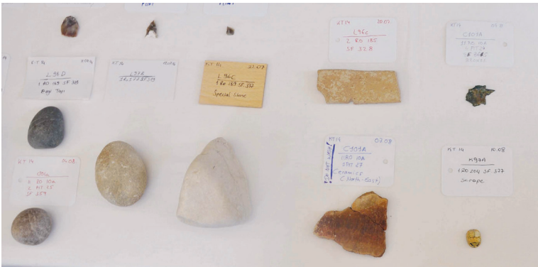
Kaleburnu'ndan tarih fıskırmaya devam ediyor