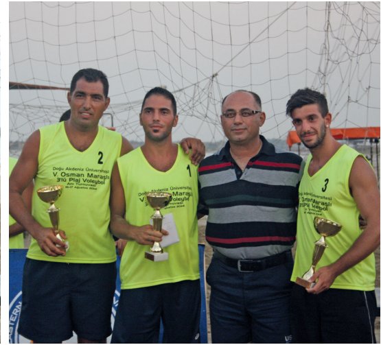
Üçlü erkek kategorisinde 2. olan takım