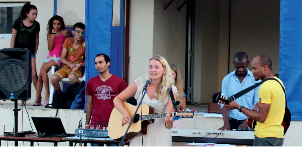
Yabancı öğrenciler çocuklara eğlenceli bir gün yaşattı

Doğu Akdeniz Üniversitesi (DAÜ) Uluslararası İşlerden Sorumlu Rektör Yardımcılığı'na bağlı Uluslararası Ofis'in katkılarıyla, DAÜ'de okuyan yabancı uyruklu bir grup öğrenci tarafından, Gazimağusa, Aşağı Maraş bölgesinde çocuklarla ilgili bir proje çalışması gerçekleştirildi.