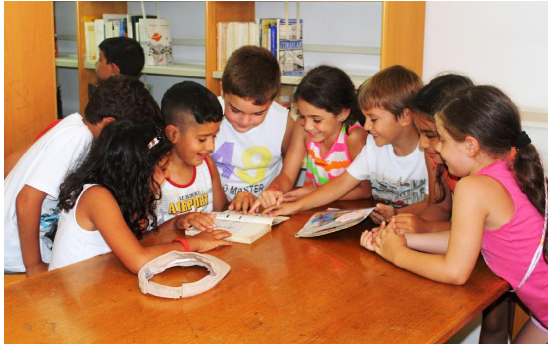
Çocuklar yapılan etkinliklerde hem eğlendiler hem de öğrendiler