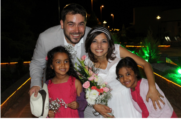
Genç çift DAÜ Deniz Tesisleri'ndeki düğünde oldukça mutluydular

gerçekleştirilen düğünde DAÜ, farklı kültürleri aynı sevinçli paylaşma çatısı altında toplayarak Kuzey Kıbrıs'ın doğal güzellikleriyle bezenmiş sahlinde ne denli güzel bir atmosfer yaratılabileceğini bir kere daha kanıtladı.