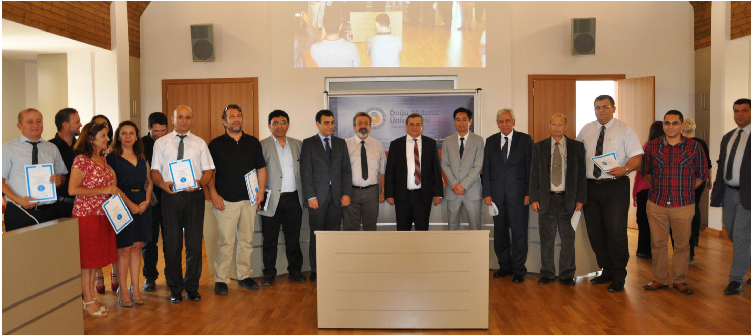
FIBAA sertifikası almaya hak kazanan akademik birim temsilcileri birarada