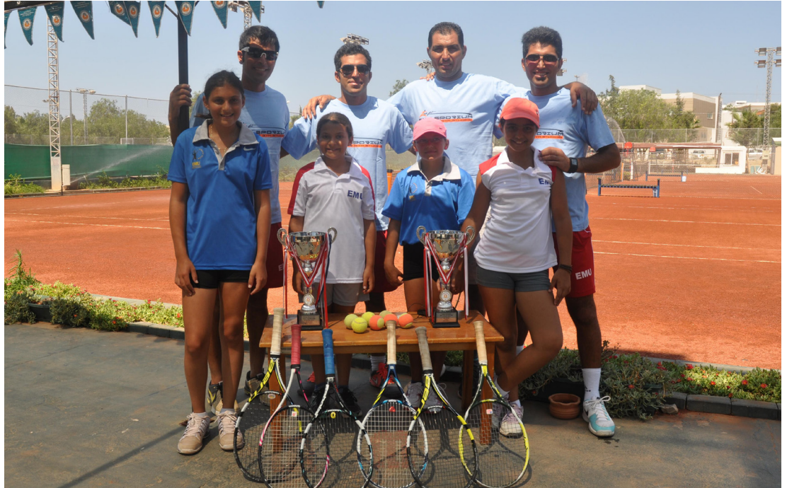
Tenis antrenörlerimiz ve tenisçilerimiz birarada