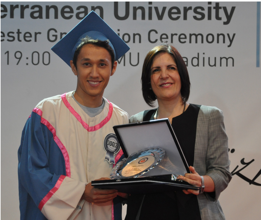
KKTC Meclis Başkanı Dr. Sibel Siber fakülte birincisi mezunumuza ödülünü takdim ederken