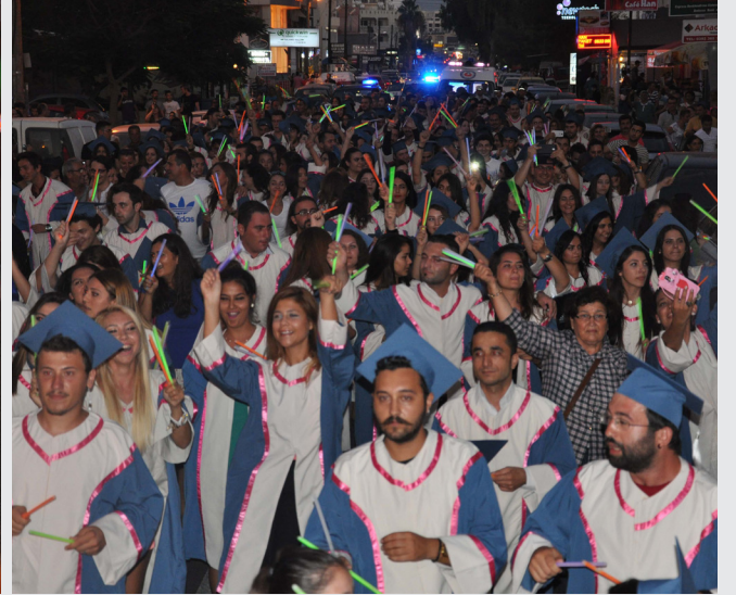
Mezunlar Mezuniyet Yürüyüşü’nde coşku dolu anlar yaşadılar