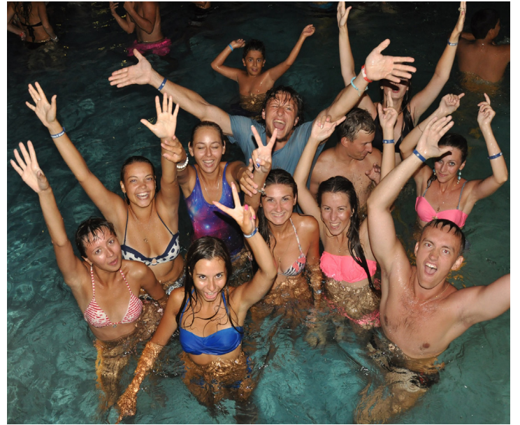
Yaz Okulu katılımcıları kurslar dışında denizin ve eğlencenin tadını da çıkarttılar