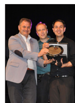
DAÜ, Uluslararası Korolar Festivali'ne Ev Sahipliği Yaptı