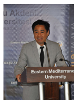
FIBAA Akreditasyon Belgeleri Düzenlenen Tören ile Takdim Edildi