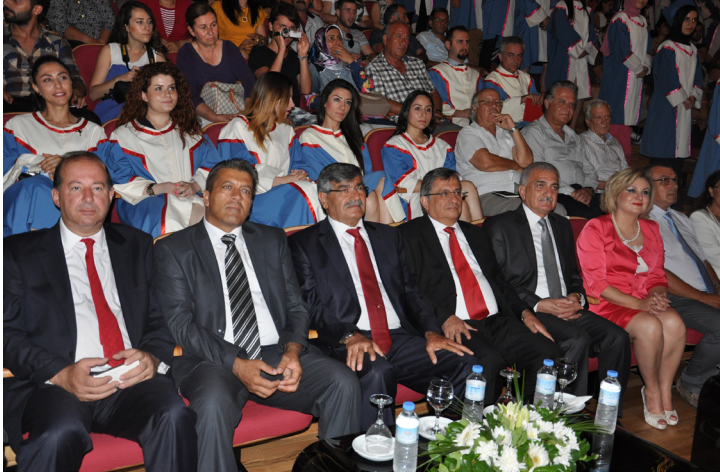
Törene protokolden yoğun bir katılım oldu

Törende konuşmaların ardından Fizyoterapi ve Rehabilitasyon Bölümü, Beslenme ve Diyetetik Bölümü, Hemşirelik Bölümü, Sağlık Yönetimi Bölümü, İlk ve Acil Yardım Bölümü ile Anestezi Bölümlerinden mezun olacak öğrenciler bölüm başkanları eşliğinde kendi bölümlerine özgü olan yeminlerini okudular. Törende ayrıca Eğitim Fakültesi, Güzel Sanatlar Eğitimi Bölümü Müzik Öğretmenliği Programı öğrencileri müzik dinletisi de gerçekleştirdi.