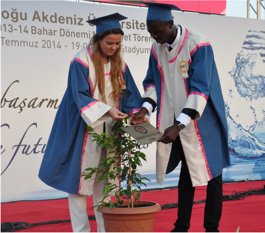
Mezunlarımız sembolik ağaç dikme töreninde