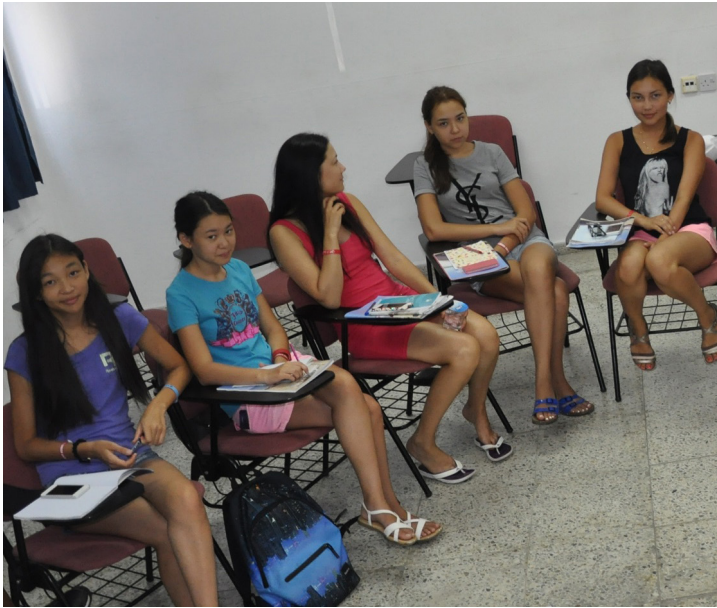
DAÜ Yaz Okulu'na katılanlar yararlı kurslar aldılar

Yaz Okulu kapsamında DAÜ'ye gelen öğrenciler gerek DAÜ'nün akademik kalitesine gerekse kampüs olanaklarına hayran kaldıklarını belirttiler. Tüm yaz okulu kursları Pearson Edexcel tarafından uluslararası denkliğe sahip olup, kursu başarı ile tamamlayan öğrencilere kurs sonunda Edexcel belgesi de takdim edildi.