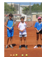
DAÜ Spor Alanındaki Başarıları İle Fark Yaratıyor