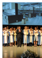
Yeni Sağlıkçılar Yemin Etti