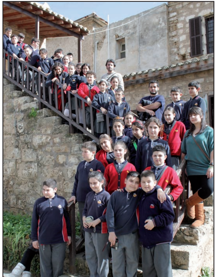
DAİ'li minikler DAÜ Mimarlık Fakültesi programı çerçevesinde Namık Kemal Zindanı'nı da incelediler.

Ortaya çıkan ürünler ise 25 Şubat 2010 Perşembe günü 14:00-15:30 saatleri arasında Doğu Akdeniz İlkokulu (DAİ) sergi salonunda sergilenmiştir.