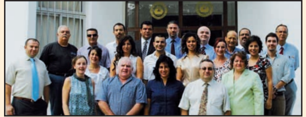
DAÜ Turizm ve Otelcilik Yüksek Okulu Öğretim Elemanları

Doğu Akdeniz Üniversitesi’nde (DAÜ) 2002-2003 Akademik yılında eğitime başlayan Turizm İşletmeciliği Yüksek Lisans Programı’ndan sonra e-Konaklama İşletmeciliği Yüksek Lisans Programı da başlıyor.