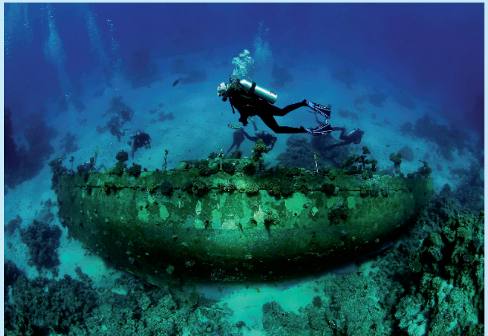
Festivalde sualtı ile ilgili birçok resim ve film gösterimi gerçekleştirildi.

Festivalin yarışma bölümlerinde 2005 ve 2006 yıllarında çekilmiş sualtı film ve belgeselleri ile fotoğraflar yer aldı. Sualtı film ve belgesel-