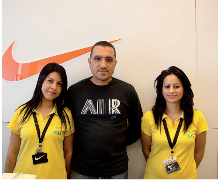
İranlı turistlerin 15 gün boyunca alışveriş yaptıkları Gazimağusa'daki çeşitli iş yeri ve çarşı grubu esnaftan yoğun ilgiden memnun kaldı.

İranlı turistlerin 15 gün boyunca alışveriş yaptıkları Gazimağusa'daki çeşitli iş yeri sahipleri DAÜ'nün bu girişiminin mutluluk verici olduğunu söyleyerek bu tarz turların devamını dilediler.