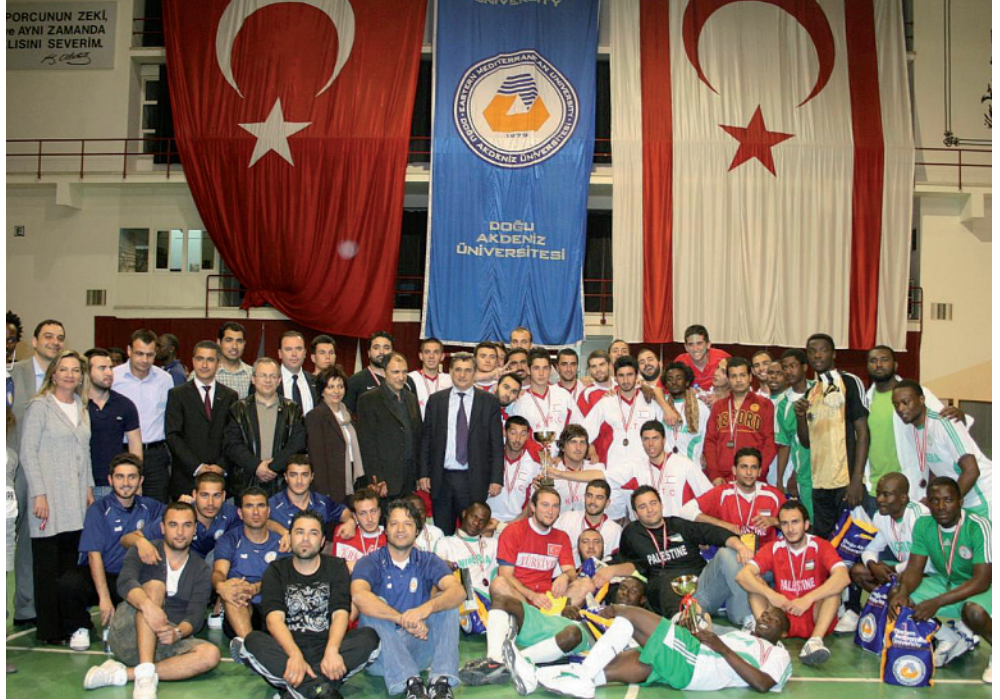
Organizasyon sonunda KKTC, Nijerya ve TC takımları DAÜ yönetimi ile hatıra fotoğrafı çektiler.