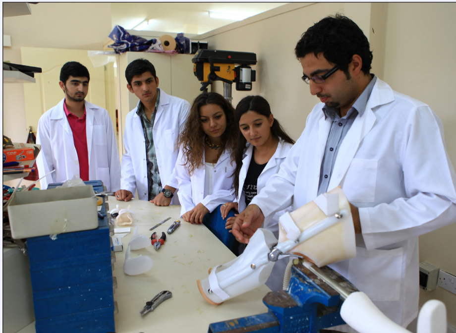
Sağlık Bilimleri Fakültesi öğrencileri ders sırasında