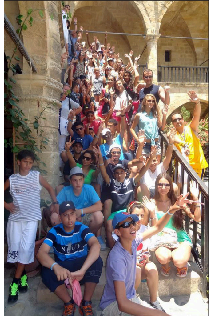
Farklı ülkelerden Yaz Okulu'na katılan öğrenciler, eğitimleri yanında gezilere de katıldılar

DAÜ Uluslararası İşlerden Sorumlu Rektör Yardımcılığı'ndan alınan bilgiye göre söz konusu kursların 3 yıldır düzenlendiği, ayrıca bu yıl farklı olarak Türk Hava Yolları'nın (THY) resmi taşımacı firma olmayı üstlendiği de bildirildi.