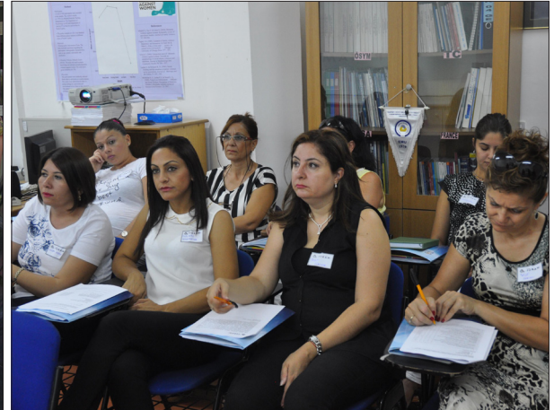
Sosyal Hizmetler Dairesi çalışanları atölye çalışmasında bilgilendirildi