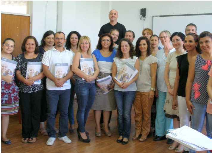
Öğretim görevlilerimiz eğitim sonrası birarada

yen kişilere sunulan bir dil sınavı olan telc sınavı 20 farklı Avrupa ülkesinde uygulanıyor. telc A1 – B2 İngilizce sınav yetkilisi eğitimi, DAÜ Yabancı Diller ve İngilizce Hazırlık Okulu'nda görev yapan 20 öğretim görevlisinin katılımıyla 16 – 19 Eylül 2013 tarihlerinde gerçekleştirildi. Telc sınav yetkilisi eğitmeni Linda Galasch tarafından sunulan 3 günlük eğitime katılan öğretim görevlileri, bu süreci başarı ile tamamlayarak telc A1-B2 İngilizce sınav yetkilisi lisansını almaya hak kazandılar.