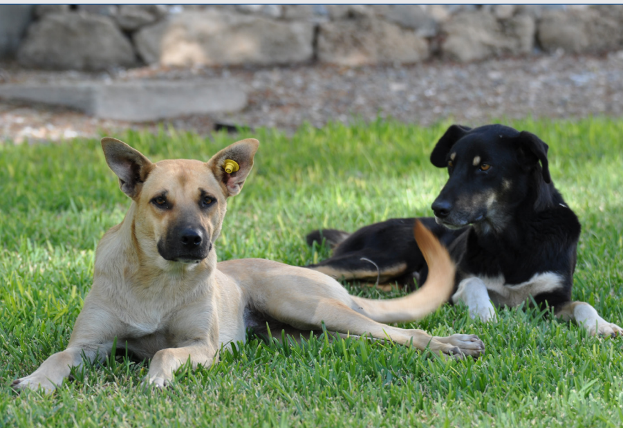
DAÜ'nün köpeklerinden bir çift