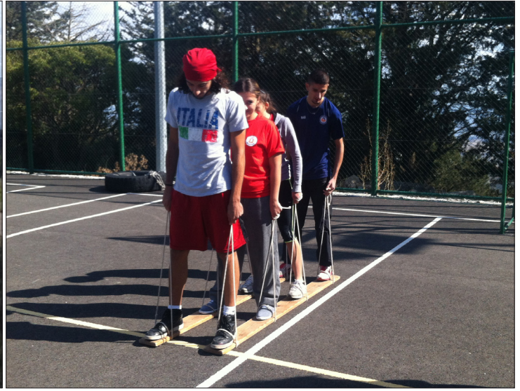
Sporcular kamp sırasında eğlenceli zaman geçirdiler