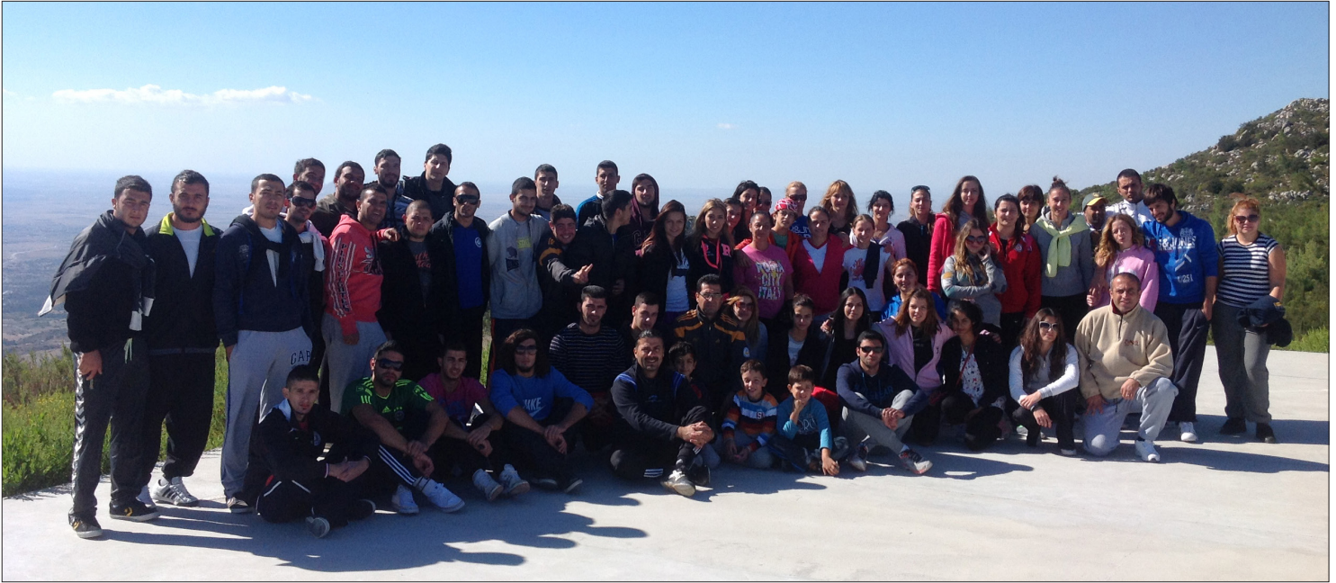
Kampa katılan tüm sporcular birarada