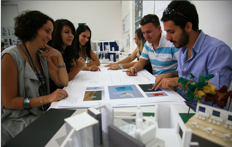
İç Mimarlık öğrencileri çalışmalarını incelerken