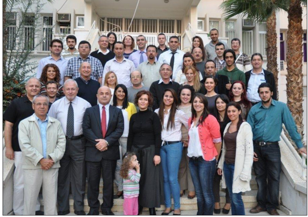
DAÜ Matematik Bölümü akademik kadrosu birarada

Tüm bu başarılarla birlikte DAÜ Matematik Bölümü, kurulduğu 1989 yılından günümüze kadar 500'ü aşkın lisans, 129 yüksek lisans ve