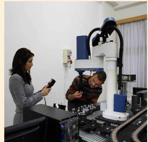
Endüstri Mühendisliği öğrencileri çalışma yaparken

Toplam 30 kredilik dersten oluşan tezsiz yüksek lisans programında 6 kredilik 2 adet zorunlu ders ve 24 kredilik 8 adet seçmeli ders ve projenin tamamlanması gerekmektedir. Seçimli dersler öğrencinin gereksinimleri doğrultusunda ve proje danışmanı öğretim üyesinin onayı ile farklı fakültelerden de alınabilecektir. Program hakkında daha ayrıntılı bilgiye http://ie.emu.edu.tr Endüstri Mühendisliği Bölümü web sayfasından ulaşılabiliyor.