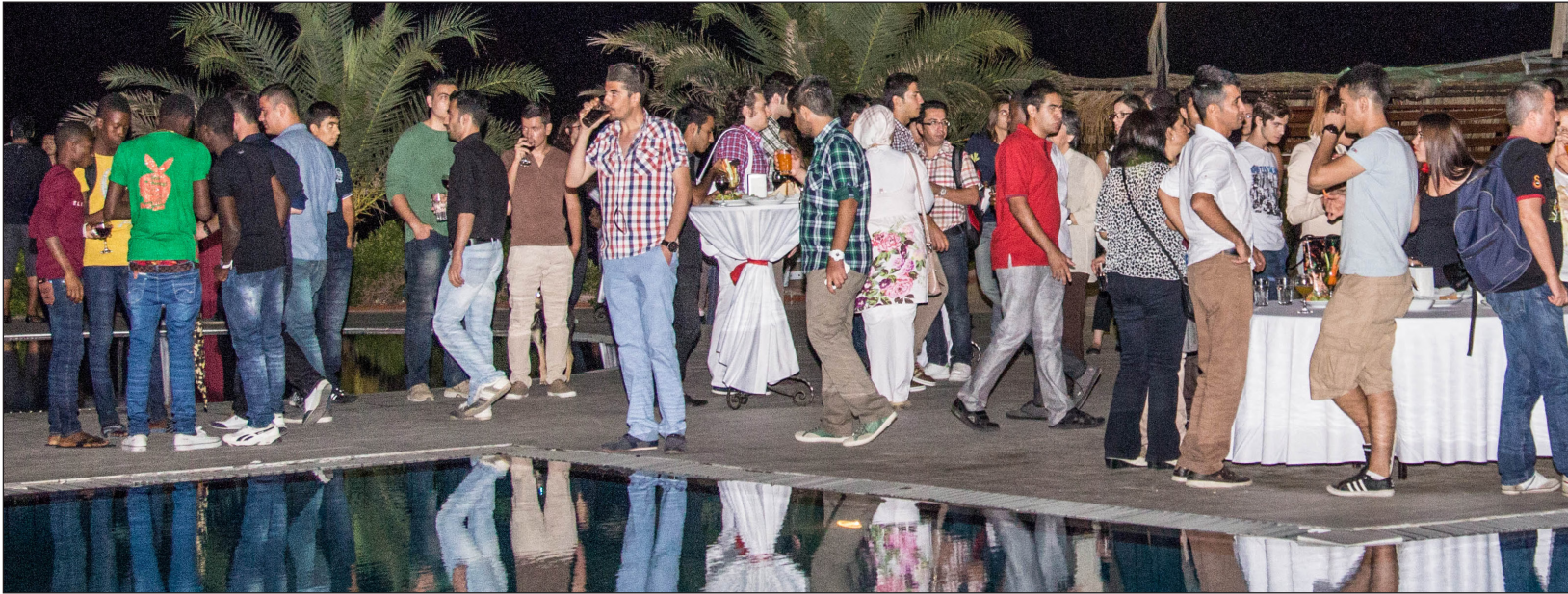
Hosgeldiniz Kokteyl'ine yeni öğrenciler ve aileleri katıldı