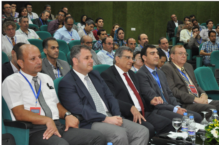
Konferans yoğun bir katılımı gerçekleştirildi

Konferans süresince 13 farklı ülkeden (KKTC, İran, Güney Afrika, Arnavutluk, Çek Cumhuriyeti, Ürdün, Letonya, Libya, Malezya, Sloveya, Tayland, Türkiye ve İngiltere) 111 katılımcı tarafından 152 sunum gerçekleştirildi.