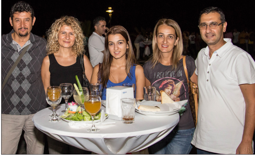
Hoşgeldiniz kokteylinden bir kare