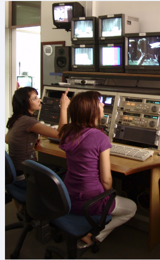
Öğrenciler çalışma yaparken