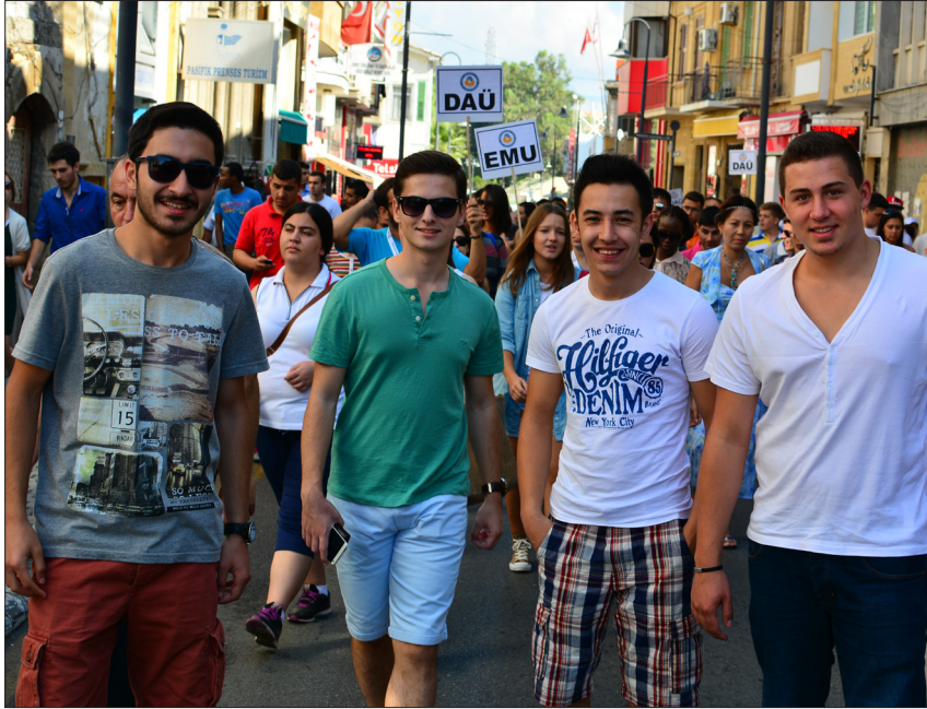
Yeni öğrencilerimizin ülkemizi tanıma gezilerinden bir kare

Türkiye, Ürdün, Sudi Arabistan, Pakistan, Nijerya gibi dünyanın çeşitli yerlerinden yeni öğrenciler ile velileri Oryantasyon Günleri kapsamında çeşitli aktivitelere de katıldılar. 24 Eylül akşamı, saat 19:30'da, DAÜ Deniz Tesisleri'nde "Yeni Öğrencilerle Buluşma" adı altında bir kokteyl düzenlendi.