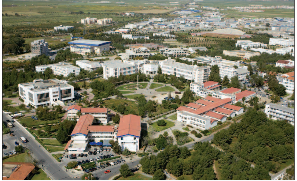
ÖSYS sonuçlarına göre KKTC birincisi olan DAÜ her geçen gün gelişmeye devam ediyor

Türkiye Cumhuriyeti'nde üniversite sayısının 180'e ulaştığı 2012 yılında ÖSYS'de örgün yükseköğretim programlarında bir önceki yıla göre kontenjanlarda %10 artışla toplam 721,925 kontenjana ulaşıldığı ve yerleştirme sonuçları doğrultusunda 80,228 kontenjanın boş kaldığı belirtildi. KKTC üniversitelerine bu yıl 16,485 kontenjanın ayrıldığı ve bu kontenjanlara 5,798 yerleştirme yapılırken, 10,687 kontenjanın ise boş kaldığı vurgulandı. Rektörlük tarafından yapılan açıklamada, DAÜ'ye bu yıl yapılan yerleştirmeler sonucunda bir