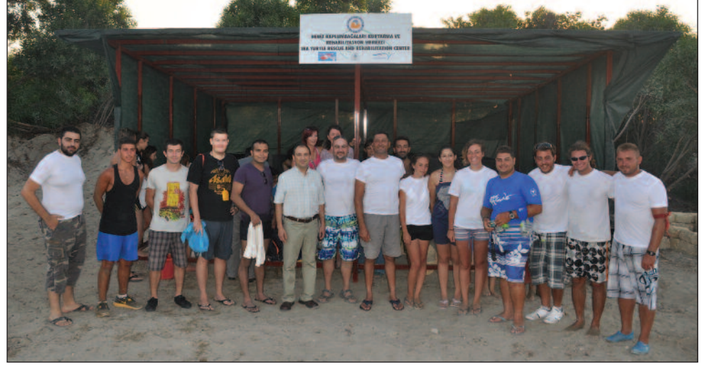
Merkezin açılışına çok sayıda kişi katılarak ilgi gösterdi