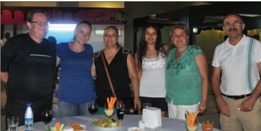
DAÜ Deniz Tesisleri'nde gerçekleştirilen kokteyle öğrenciler ve velileri DAÜ yönetimi ile tanışma fırsatı buldu

Gecede Sosyal ve Kültürel Aktiviteler Müdürlüğü'ne bağlı kulüpler stand açarak Üniversiteye yeni kayıt yaptıran öğrencilere kulüplerini tanıttılar. Çok sayıda yeni öğrencinin kulüplere üye olmak istemesi, kulüp başkanlarını oldukça memnun etti. Kulüp standlarının yanı sıra fakülte ve bölümler de stand açarak tanıtım yaptılar. Gecede öğrencilere Kıbrıs yemek kültürünü yansıtan çörek