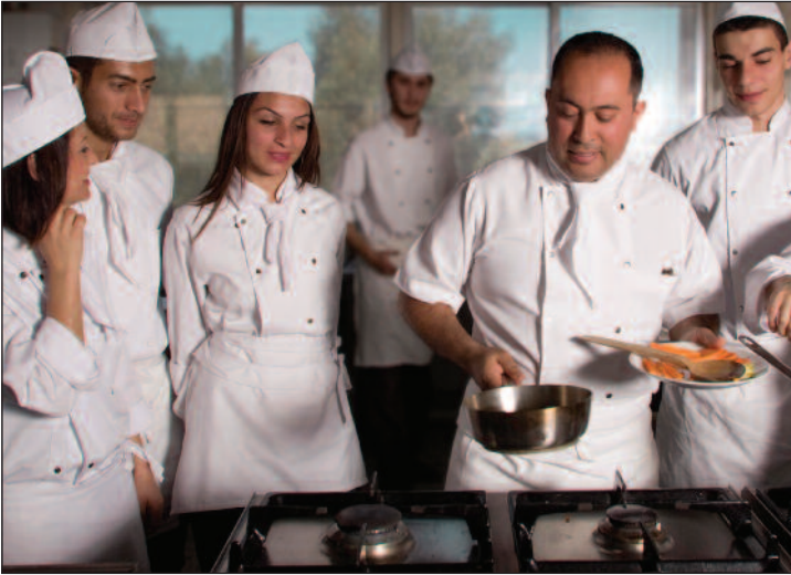
Aşçılık Önlisans Programı profesyonel aşçılar yetiştiriyor

Doğu Akdeniz Üniversitesi (DAÜ) Turizm Fakültesi Turizm İşletmeciliği Doktora Programı Türkiye Cumhuriyeti Yükseköğretim Kurulu'ndan onay aldı. Bilimsel araştırmalarda ve yayınlarda Doğu Akdeniz'de bir numara ve Avrupa'nın en iyi üçüncü fakültesi konumunda bulunan DAÜ Turizm Fakültesi, onaylanan Doktora Programı ile eğitim kalitesini her geçen gün yükseltmeye devam ediyor. Fakülte Dekanlığı, 2000-2009 tarihleri arasında turizm ve otel işletmeciliğine yönelik yayımlanmış makale sayısına göre dünya