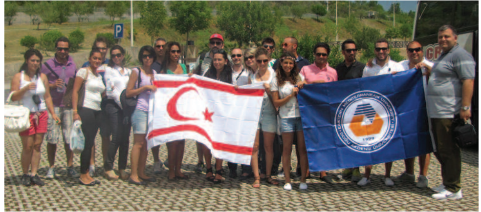
DAÜ - GİMER öğrenciler için bilgilendirici geziler de düzenliyor