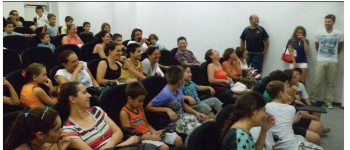
Bilgilendirme toplantısına yoğun katılım oldu