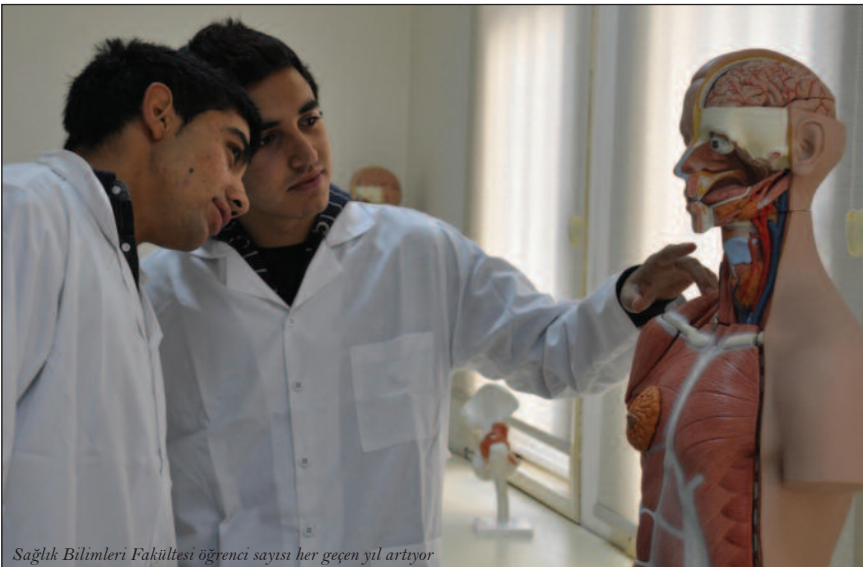
Sağlık Bilimleri Fakültesi öğrencisi her geçen yıl artıyor