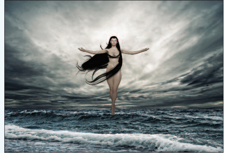
DAÜ'lü öğrencilerin çalışmaları beğeniye sunulacak