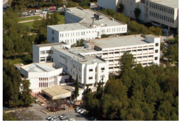
İşletme ve Ekonomi Fakültesi dünya sıralamasındaki yükselişi ile dikkat çekiyor

"Webometrics", merkezi İspanya'da bulunan ve İspanya'nın en büyük kamu araştırma kuruluşu olan Milli Araştırma Konseyi (CSIC) bünyesinde faaliyet gösteren merkez tarafından yürütülen ve dünyada faaliyet gösteren 20 binin üzerinde üniversite üzerinde yapılan çalışmalardan yola çıkılarak hazırlanan listeleri kapsıyor.