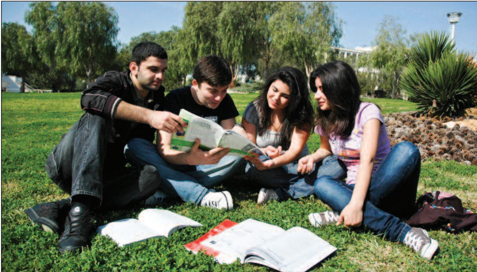
Üniversiteye kayıt yapan yeni öğrenciler huzurlu ortamda eğitim alıyor.

DAÜ, DGS sonrası ortaya çıkan tablo da dikkate alındığında öğrenciler tarafından tercih edilen üniversite olduğunu bir kez daha ortaya koymuştur. Bu da üniversitenin eğitim kalitesi, akreditasyonlar ve uluslararasılaşmaya yapmış olduğu yatırımların bir sonucu olarak değerlendiriliyor.