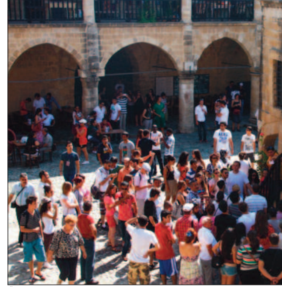
Öğrenciler ve velileri Büyük Han'da

Doğu Akdeniz Üniversitesi (DAÜ) Öğrenci Hizmetleri ile Sosyal ve Kültürel İşler'den Sorumlu Rektör Yardımcılığı'na bağlı Sosyal ve Kültürel Aktiviteler Müdürlüğü tarafından 15. Oryantasyon Günleri kapsamında, 21 Eylül 2012 Cuma akşamı saat 19:30'da Atatürk Meydanı'nda (CL Meydanı)