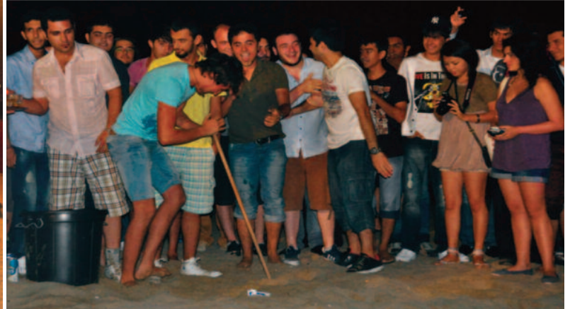
Atatürk Meydanı'nda gerçekleştirilen "Hosgeldiniz Gecesi" renkli görüntülere sahne oldu.