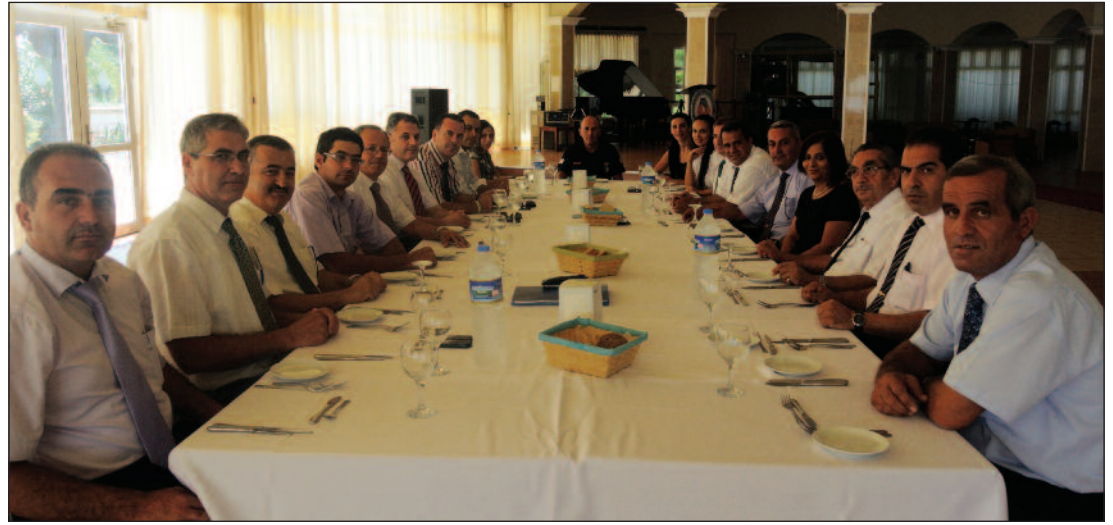
Uluslararası Üniversiteler Arama Kurtarma Konseyi Temsilcileri DAÜ Deniz Tesisleri'nde toplandı