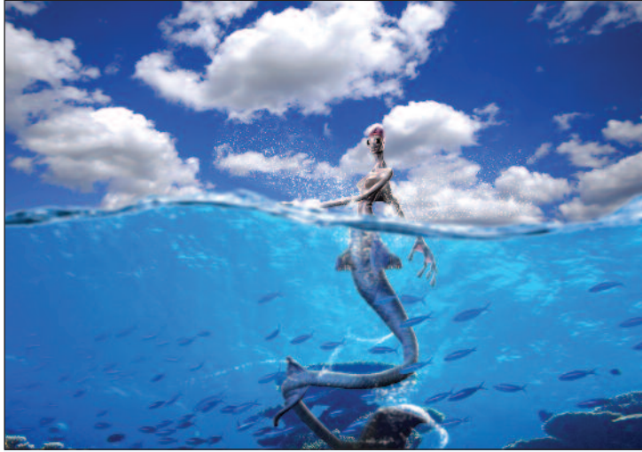
Bölüm öğrencilerinin çalışmaları bienalde yer alacak.

Doğu Akdeniz Üniversitesi (DAÜ) ile Bilgi Üniversitesi İletişim Fakültelerinin Görsel İletişim Tasarımı Bölümleri, İstanbul Tasarım Bienali'ne ortak sergiyle katılıyor. Bölümler sergide, Dijital Sanat ve Video Art niteliğindeki çalışmalarla yer alacaklar. 13 Ekim - 12 Aralık 2012 tarihleri arasında İstanbul'da gerçekleşecek bienale DAÜ dışında Türkiye'den 25 üniversitenin tasarımıyla ilgili 76 bölümü kabul edildi.