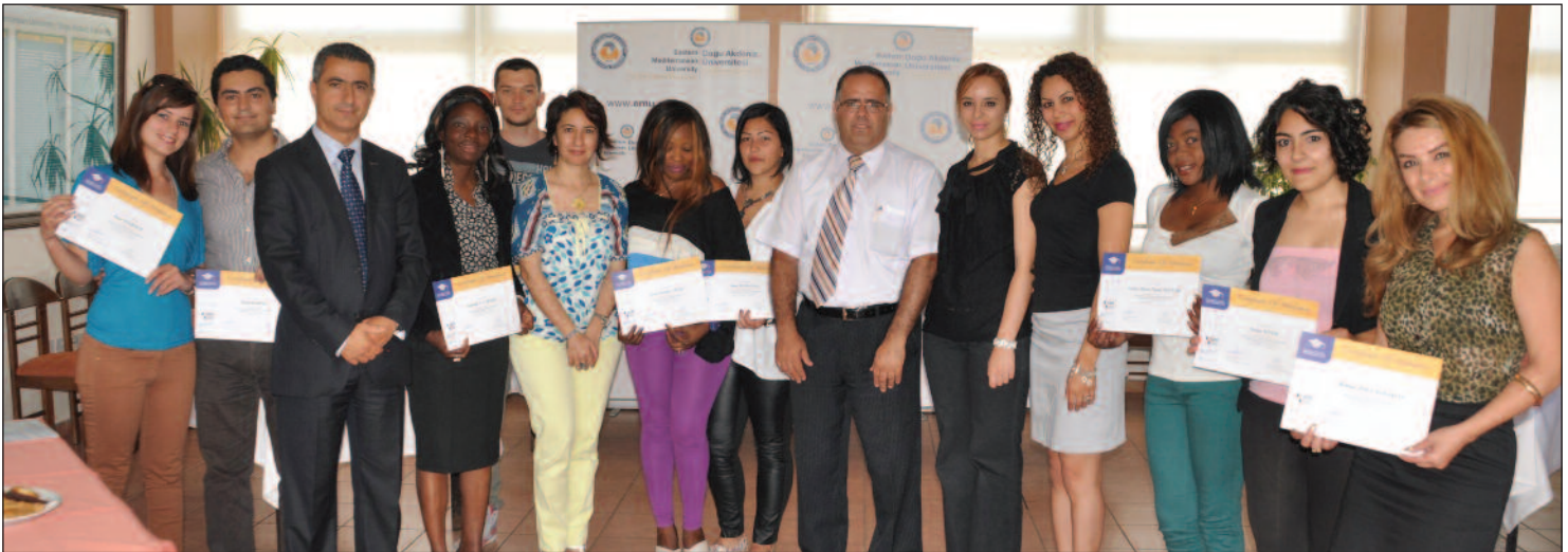
LCCI Turizm İngilizcesi Sınavı'na katılanlar sertifikalarını aldılar

lararası iş dünyasına giriş vizesi ve başarı anahtarı olarak kabul edilmektedir. DAÜ tarafından verilen kurslarda alanında uzman eğitimciler Turizm ve İşletme İngilizcesi öğretmek için LCCI tarafından da eğitilmişlerdir. Ekim ayında başlayan yeni dönem kurslara katılmak isteyenler DAÜ Sürekli Eğitim Merkezi'nden veya 630 2471 numaralı telefondan detaylı bilgi alabilirler.