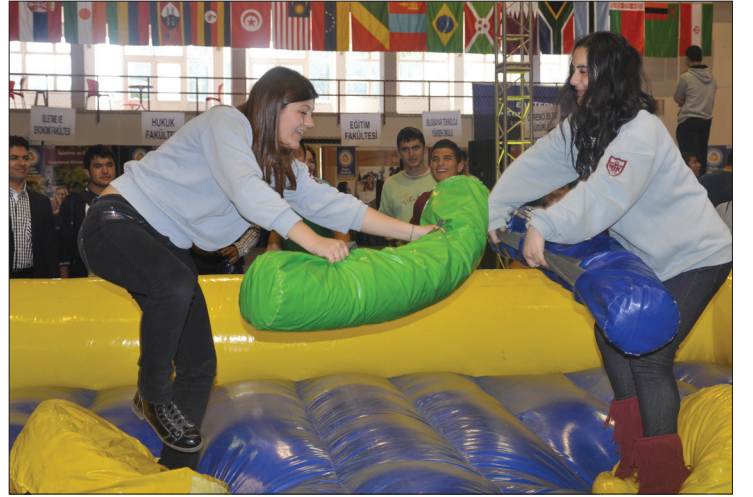
DAÜ 4. Tanıtım Günleri'nde öğrenciler birbirinden eğlenceli oyunlara ve yarışmalara katıldılar