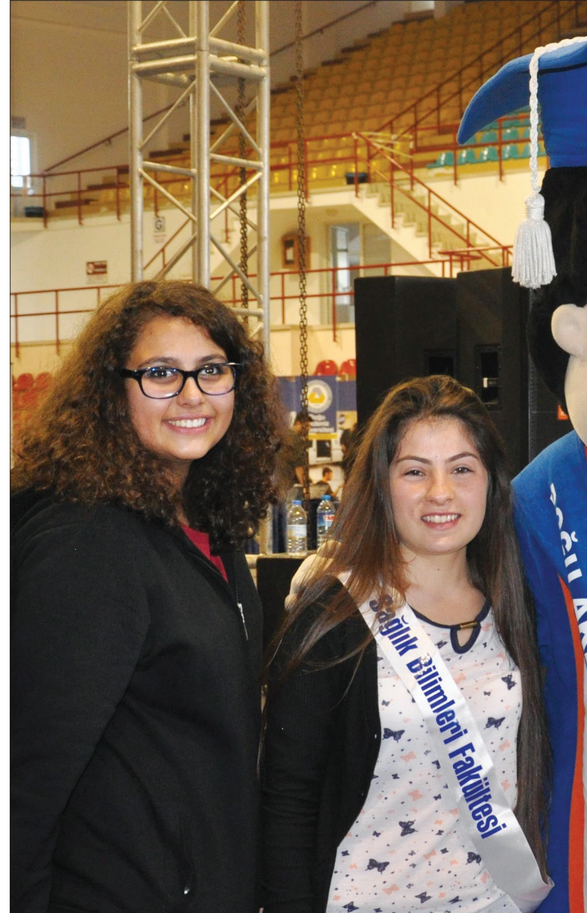
Lise son sınıf öğrencileri DAÜ maskotuyla bol bol hatıra fotoğrafı çektiler

DAÜ çok güzel ve gelişmiş bir üniversite. Ben daha önceden de DAÜ'ye gelmişim. Ben henüz tam kararımı vermedim ama İletişim veya Elektrik-Elektronik Mühendisliği alanında eğitim almayı düşünüyorum. DAÜ kesinlikle tercihlerim arasında olan bir üniversite. Tanıtım Günleri sayesinde de bire bir konu uzmanı olan kişilerden bilgi aldım. Tanıtım Günleri sonunda kararlarımın daha net olacağını düşünüyorum.