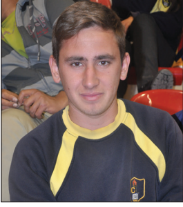
Sözer Sümer Cumhuriyet Lisesi Son Sınıf Öğrencisi

Ben DAÜ'ye ilk kez geldim. DAÜ KKTC'deki en iyi üniversite. Ben üniversite eğitimimi Sağlık Bilimleri üzerine düşünüyorum. DAÜ uluslararası standartlarda eğitim veren bir üniversite ve ben kesinlikle burada eğitim almayı düşünüyorum. Tanıtım Günleri de çok güzel ve eğlenceli geçiyor. Burada kendimizi yabancı gibi hissetmiyoruz.