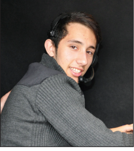
Bertu Hamitoğlu Haspolat Meslek Lisesi Son Sınıf Öğrencisi

DAÜ çok büyük ve güzel bir üniversite, Elektrik ve Elektronik Bölümü okumak istiyorum ve ilk tercih ettiğim üniversite kesinlikle DAÜ'dür. Tanıtım Günleri'nde şans eseri DAÜ TV Canlı Yayın aracında yönetmenlik yapma şansını buldum, aklımda olmayan bir mesleki ancak çok eğlenceli ve zevkli bir meslek olduğunu anladım.