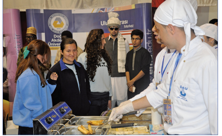
Etkinlikte lise son sınıf öğrencileri standlardan bilgiler aldılar