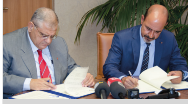
DAÜ ile Geçitkale Belediyesi Arasında İşbirliği Protokolü İmzalandı