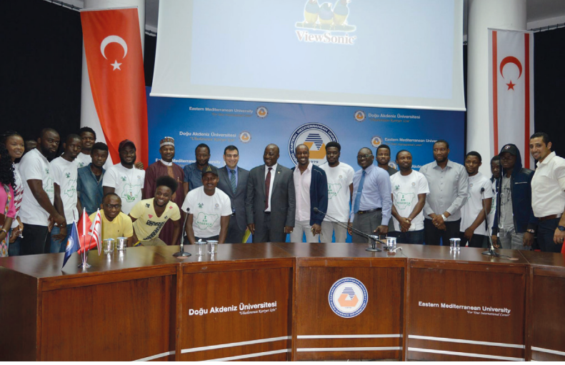
Nijerya Adalet Bakanı Abubakar Malami Nijeryalı Öğrencilerle Birlikte