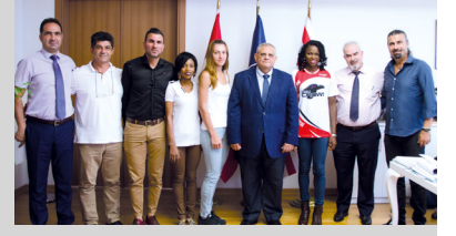
Şampiyonlar DAÜ'yu Seçiyor