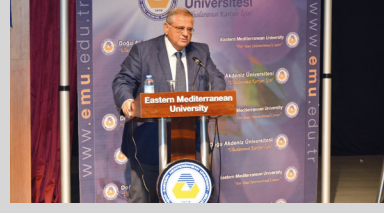
SABDEK Toplantısı DAÜ Ev Sahipliğinde Gerçekleştirildi