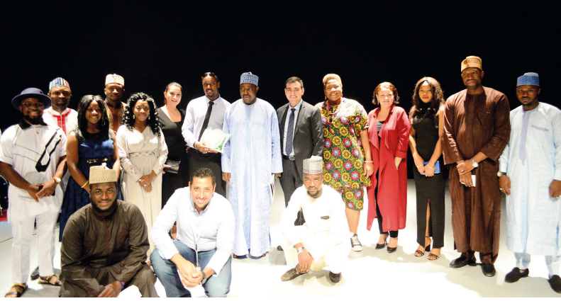
Nijerya Gecesi'nden Bir Kare

Doğu Akdeniz Üniversitesi (DAÜ) Nijerya'nın en genç bakanı olma ünvanını taşıyan Nijerya Federal Cumhuriyeti Başsavcısı ve Adalet Bakanı Abubakar Malami'yi ağırladı. DAÜ'de eğitim alan Nijeryalı öğrenciler tarafından Nijerya Haftası etkinlikleri kapsamında DAÜ'yü ziyaret eden Malami DAÜ Ulusal Nijeryalı Öğrenciler Birliği tarafından organize edilen eğitim seminerine katıldı.