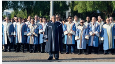
Ulu Önder Mustafa Kemal Atatürk DAÜ'de Saygı ile Anıldı