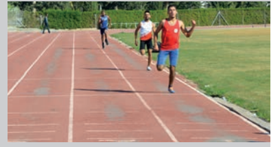
KKTC Üniversiteleri DAÜ'deki "Spor Festivali"nde Buluştu