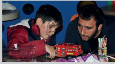
Gençlerimizden "Bir Dilek Tut" Projesi