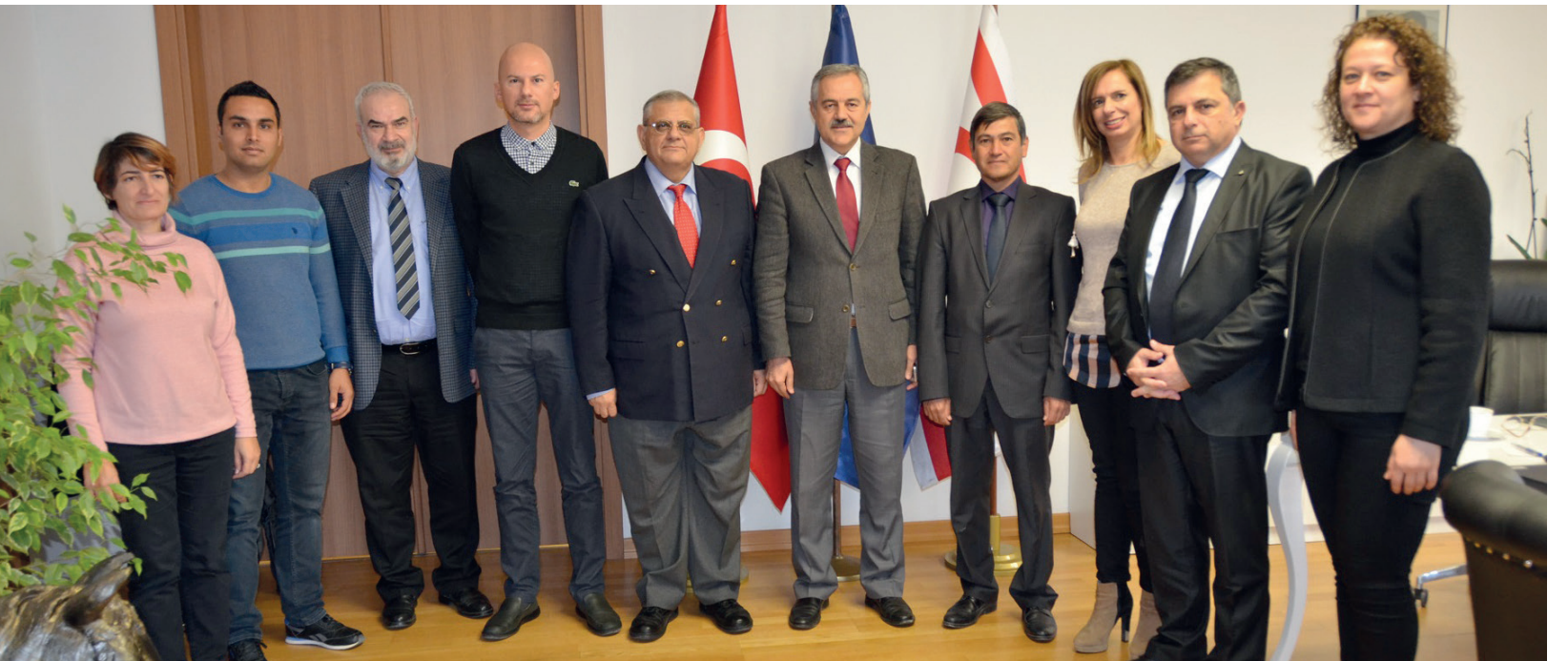
İşbirliği protokolünün imzalanmasının ardından hatıra fotoğrafı çekildi