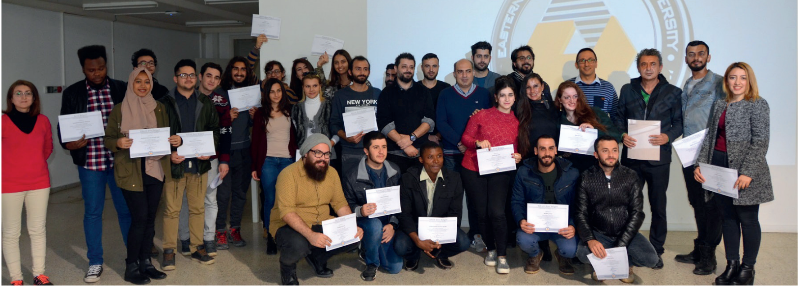
Görsel Sanatlar ve Görsel İletişim Tasarımı Bölümü'nün Başarılı Öğrencileri Hocaları ile Birlikte