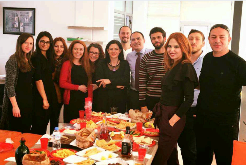
Halkla İlişkiler ve Basın Müdürlüğü