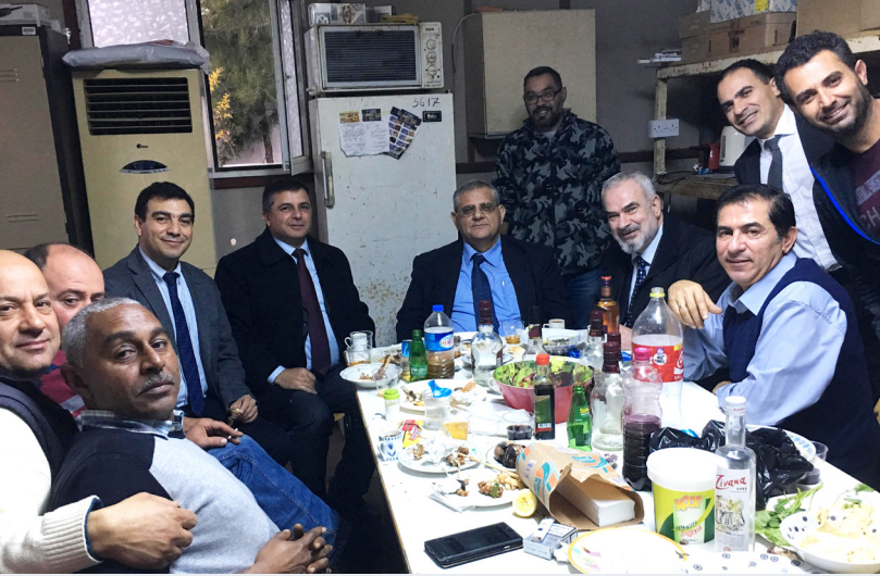
Teknik İşler Müdürlüğü