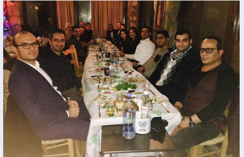
Bilgi İşlem Müdürlüğü