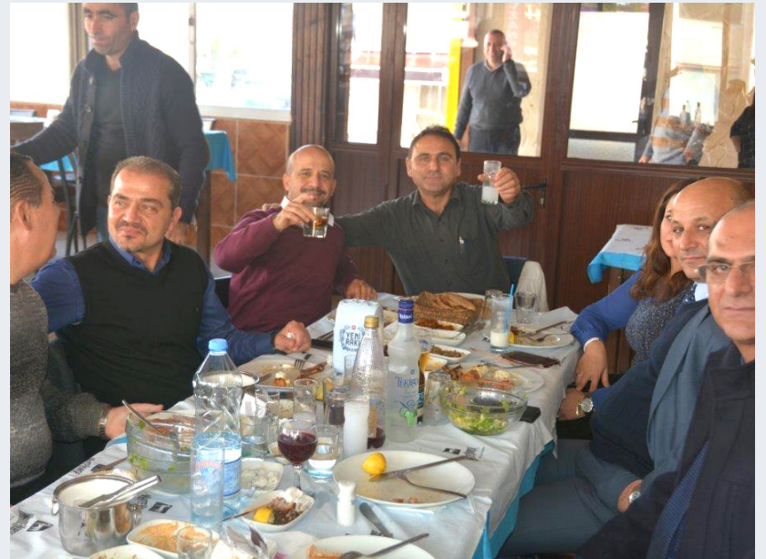
Satın Alma ve Envanter Müdürlüğü