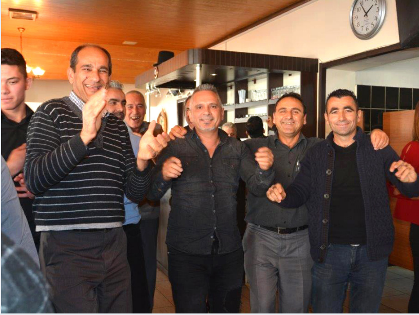
Satın Alma ve Envanter Müdürlüğü - Basım Evi Müdürlüğü