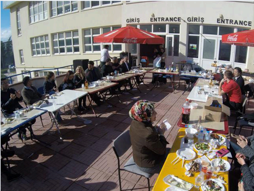
Spor İşleri Müdürlüğü