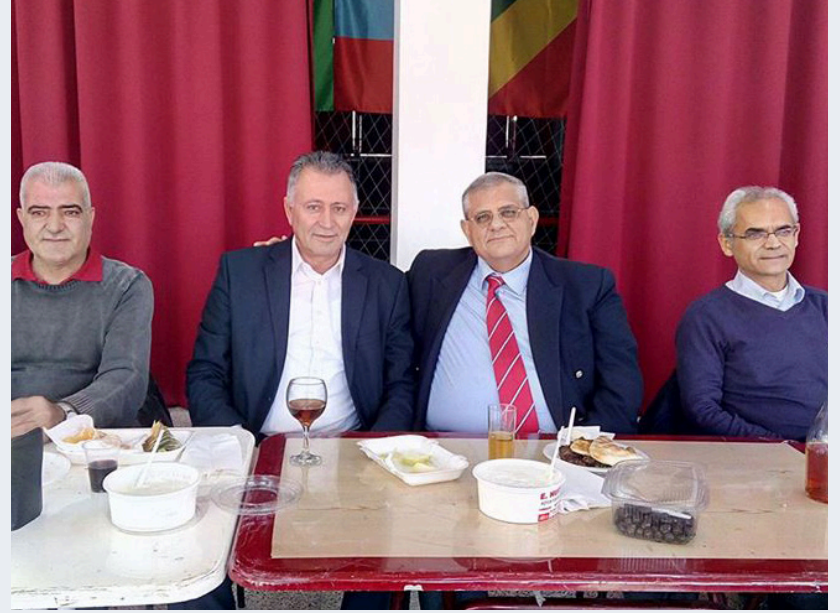
Spor İşleri Müdürlüğü