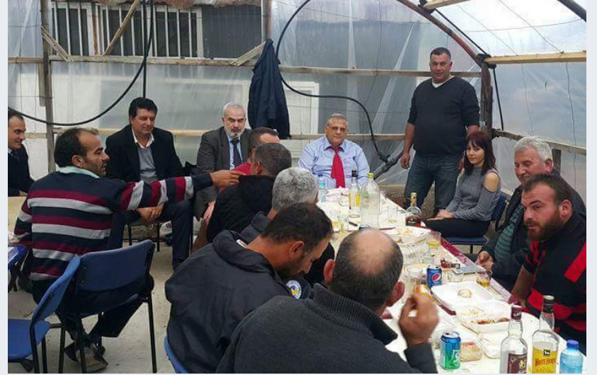
Çevre İşleri Müdürlüğü