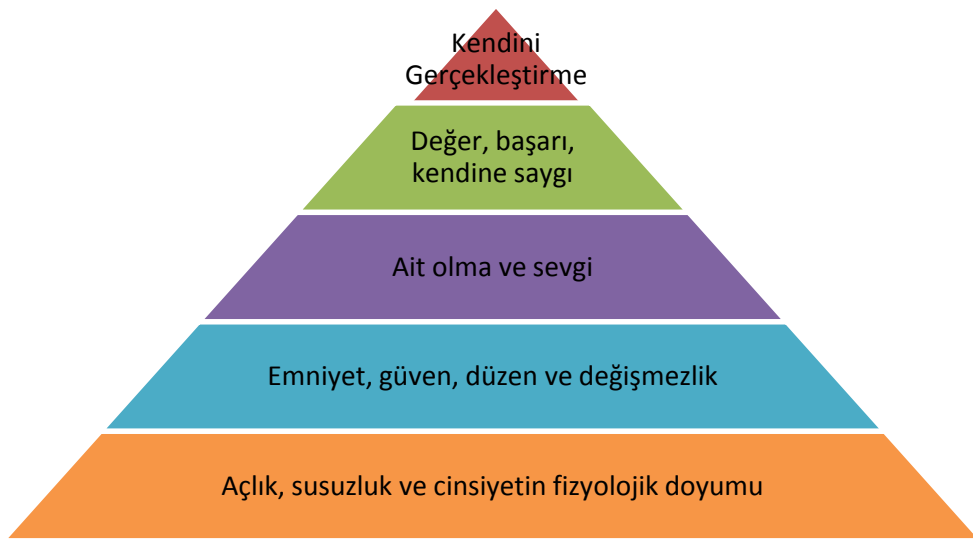
Şekil 2: Maslow’un Gereksinimler Piramidi

Hümanistik Kuramın önemli isimlerinden Maslow, “Kendini Gerçekleştirme” kavramını öne sürerek bireyin kendi potansiyelini tümüyle gerçekleştirme sürecine vurgu yapmaktadır (Coon & Mitterer, 2008 Akt. Yıldızoğlu, 2013). Maslow’a göre, sağlıklı bir kişiliğin gelişebilmesi için gereksinimlerinin karşılanması gerekmektedir. Maslow bireyin yaşamında sahip olduğu gereksinimleri hiyerarşik bir düzen içerisinde, beş basamaktan oluşan gereksinim piramidi ile açıklamaktadır. Gelişim piramidinde alt basamakta yer alan ihtiyaçlar giderilir giderilmez üst basamakta yer alan güduları doyurmaya yönelirler. Birey, temelde yer alan gereksinimler karşılanmadan bir üst basamakta yer alan gereksinimlere yönelmez. Maslow’un ihtiyaçlar hiyerarşisi piramidi aşağıdaki şekilde gösterilmiştir: