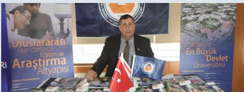
Üniversitemiz Ereğli Özel Utku Anadolu ve Fen Lisesi Tanıtım Günleri'nde temsil edildi.