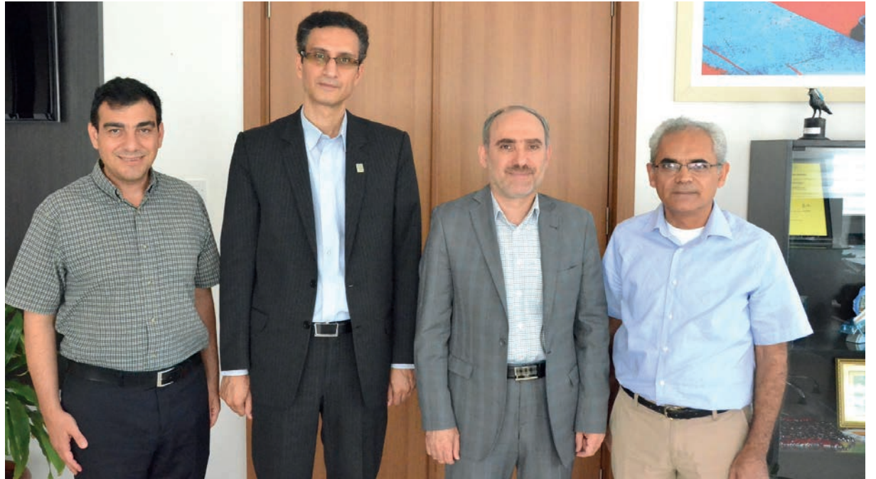
DAÜ Rektör Yardımcıları Guilan Üniversitesi yetkilileri ile bir arada