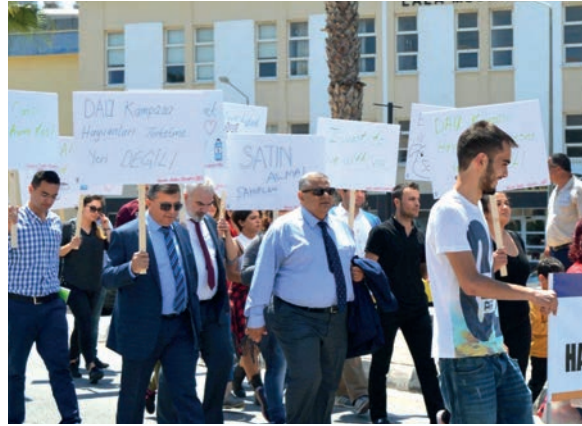
Hayvan dostlar için yapılan yürüyüşten bir kare