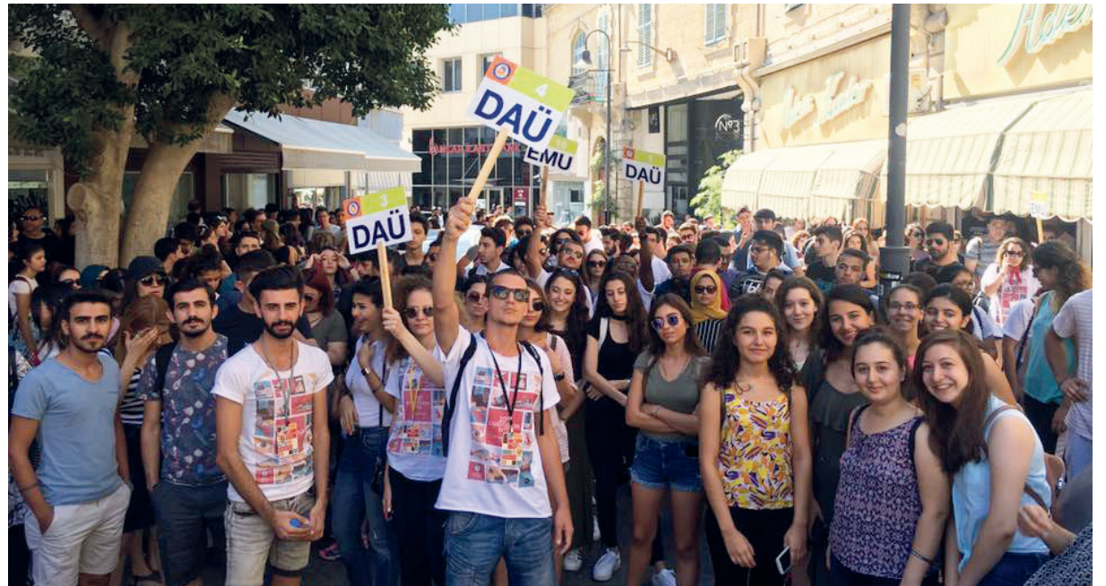
Öğrenciler Kültür Turları kapsamında KKTC'yi tanıdılar