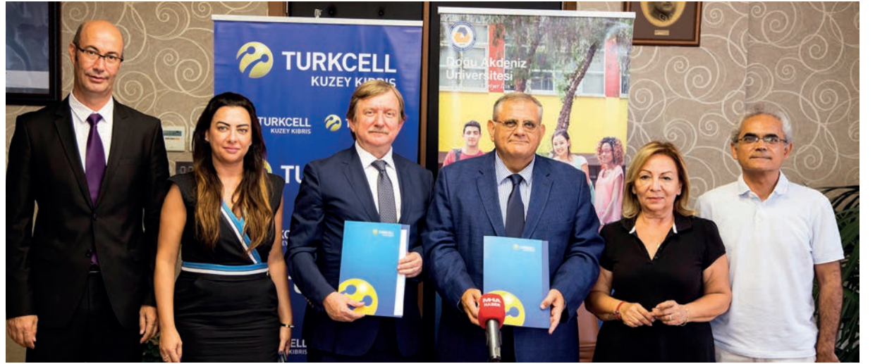
DAÜ ve Kuzey Kıbrıs Turkcell yetkilileri imza töreni sonrası bir arada