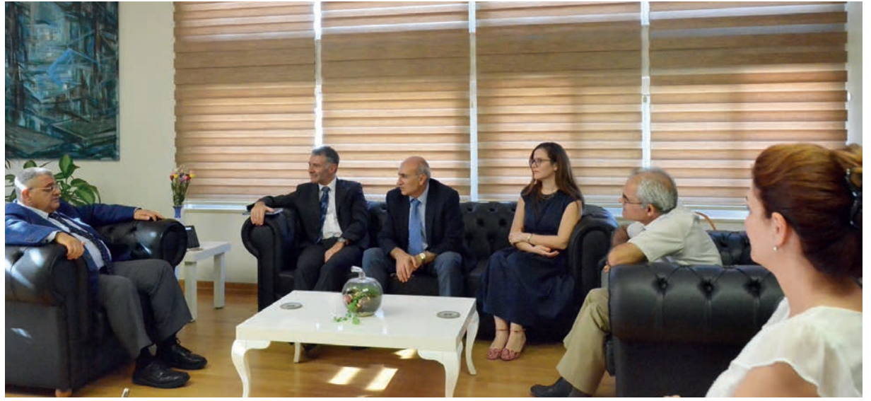
Rektör Prof. Dr. Osam ve DAÜ yetkilileri Warwick Üniversitesi yetkilileri ile bir arada

neyimli öğretim elemanları tarafından verilen derslerle bir akademik yılda tamamlanabiliyor. Ayrıca öğrencilere, iki dersi İngiltere'de Warwick Üniversitesi'nde veya Singapur, Malezya, Tayland, ile Çin'de alabilme seçeneği de sunuluyor. Programlar hakkında daha detaylı bilgi edinmek ve başvuruda bulunmak için DAÜ kampüsündeki WMG-DAÜ Ofisi veya warwick.emu.edu.tr adresi ziyaret edilebiliyor.