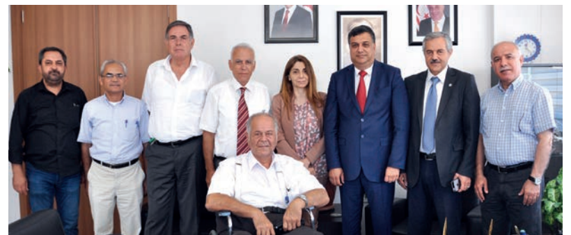
VYK Başkanı ve Üyeleri YÖDAK Başkanı ve Üyeleri ile birlikte