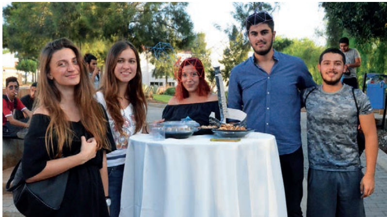
Mimarlık Bölümü yeni öğrencileri diğer öğrencilerle kaynaşma fırsatı buldular

ve Tasarım Giriş Atölyesi ders (FARC 101 ve FARC 102) öğrencileri, Gazimağusa Suriçi'nde kurguladıkları ısınma projelerinin ürünlerini ve şapka ile maske gibi çeşitli aksesuarları tasarlayan 1. sınıf öğrencileri Mimarlık Fakültesi bahçesinde düzenledikleri yürüyüşte tasarladıkları ürünleri sergiledi. En iyi projelerin ödüllendirildiği etkinlikte, eğitime yeni başlayan öğrenciler diğer öğrencilerle kaynaşarak fakülte öğretim üyeleri ile tanışma fırsatı buldu.