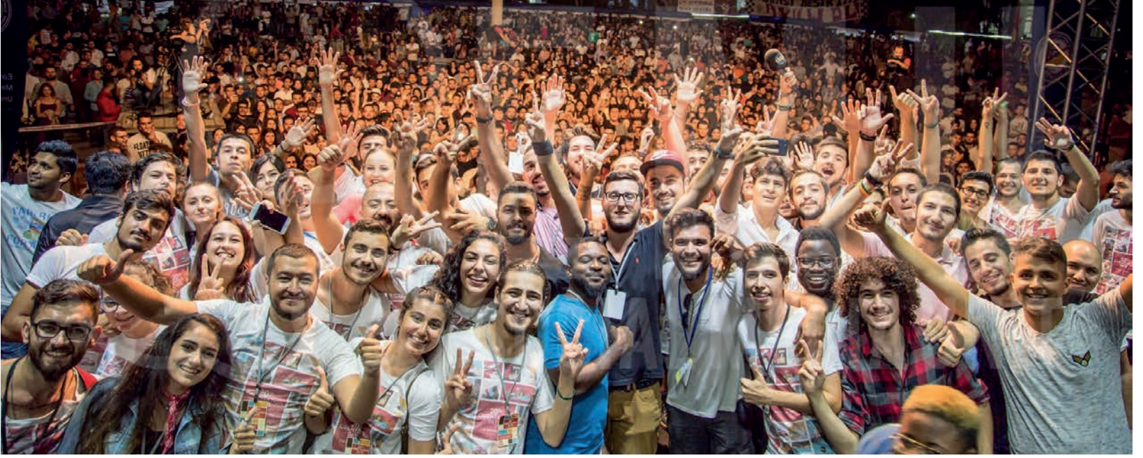
Yeni öğrenciler "Hoşgeldiniz Gecesi"nde hem eğlendiler, hem de Üniversiteyi daha yakından tanıma fırsatı buldular