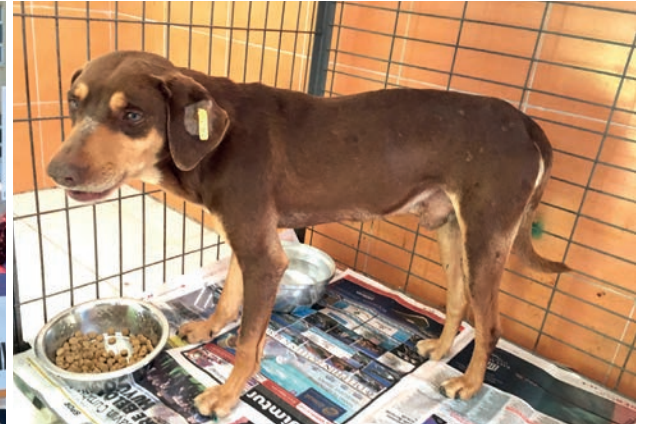
DAÜ'deki hayvanlar kısırlaştırılıp yeni yuvalarını bekliyorlar