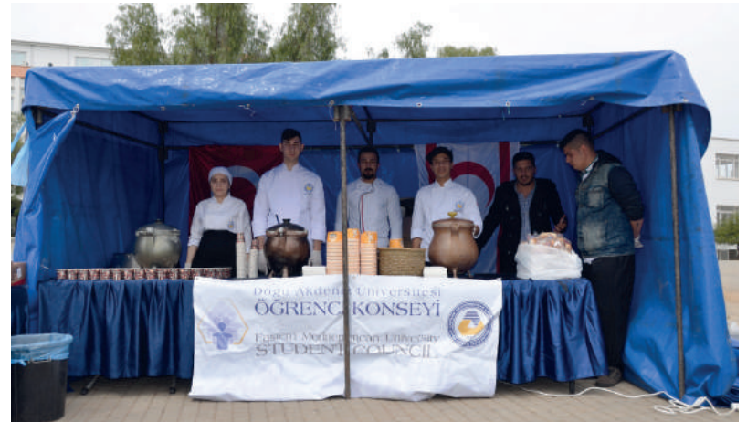
DAÜ Öğrenci Konseyi buğday çorbası ve hoşaf dağıttı.