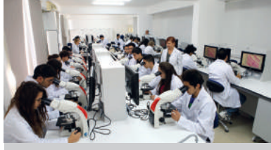
Tıp Fakültesi - Marmara Üniversitesi Tıp Fakültesi Ortak Programı Dünya Tıp Okulları Rehberi'ne Girdi