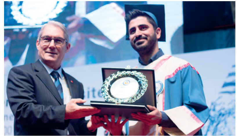
TC Lefkoşa Büyükelçisi Derya Kanbay ödül ve diploma takdim ederken.