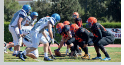
DAÜ Amerikan Futbolu Takımı EMU Crows Grup İkinciliğine Yakın