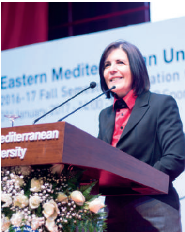
Meclis Başkanı Dr. Sibel Siber