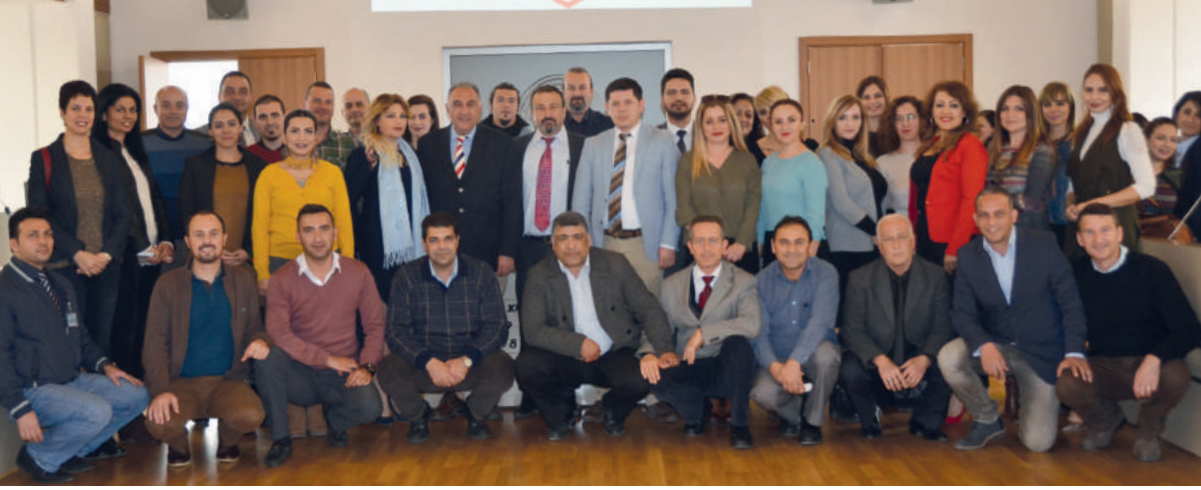
DAÜ Kalite Birim Temsilcileri kapanış toplantısı sonrası birarada.

Doğu Akdeniz Üniversitesi (DAÜ) dünyanın en büyük belgelendirme ağı IQ Net'in de üyesi olan Türk Standartları Enstitüsü (TSE) ISO 9001:2008 Kalite Yönetim Sistemi ve ISO 10002:2014 Öğrenci Memnuniyeti Odaklı Yönetim Sistemi tarafından akredite edilmek üzere geçtiği denetimlerden tam not aldı.