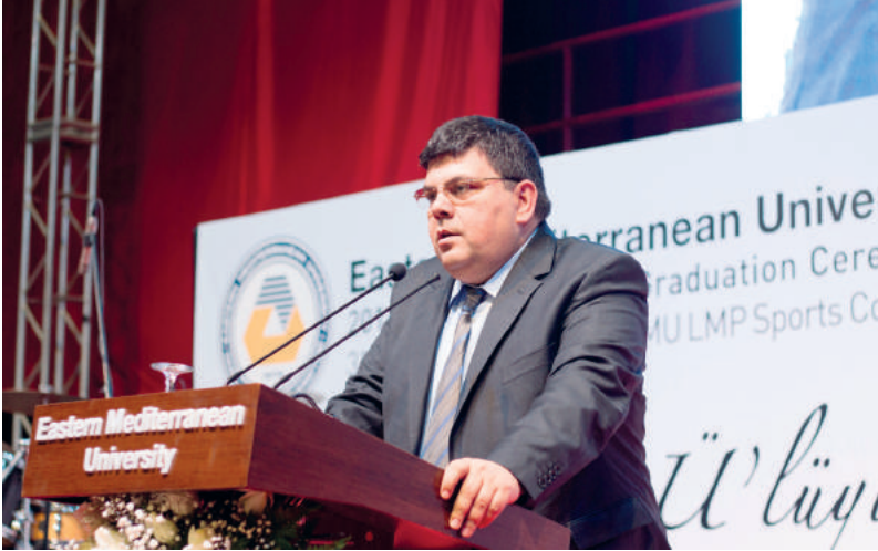
Bakan Özdemir Berova