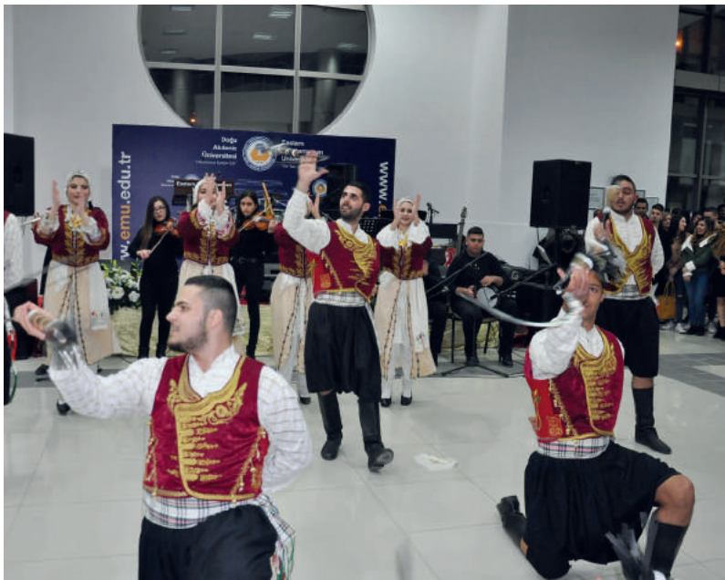
DAÜ Halk Dansları Topluluğu