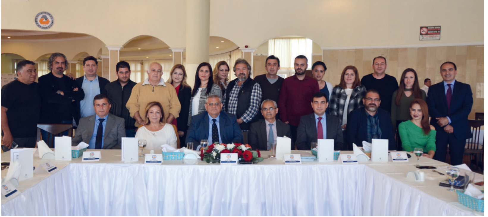
Yemek sonrasında Gazimağusa basın mensuplarıyla hatıra fotoğrafı çekildi.