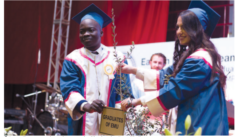
Öğrenciler mezunlar adına sembolik olarak ağaç diktiler.