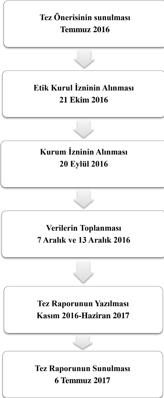
Şekil 1: Araştırma Takvimi