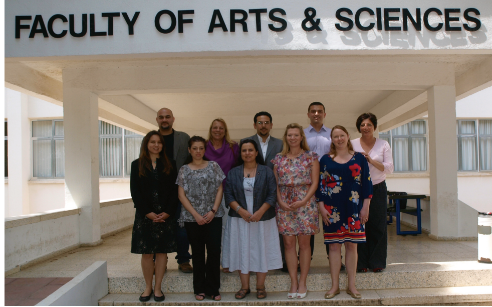
Psikoloji Bölümü Öğretim Üyeleri

DAÜ Psikoloji bölümü bu gelişimlere bir yenisini daha ekleyerek 2010-2011 Akademik Yılı Güz Dönemi'nden itibaren Gelişim Psikolojisi yüksek