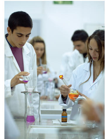
Öğrenciler modern laboratuvarlarda öğrenim görecekler