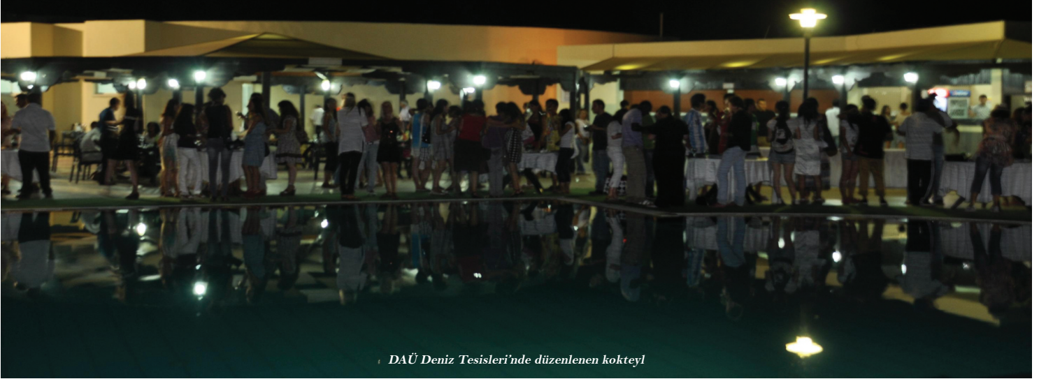
DAÜ Deniz Tesisleri'nde düzenlenen kokteyl

Söz konusu proje kapsamında ülkemize gelen yabancı öğrenciler KKTC Dışişleri