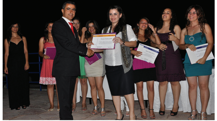
ECDL Sertifika Töreni 6 Temmuz'da gerçekleştirildi

15 öğretmenin ise aktif olarak okullarında eğitimlere başladığını kaydetti. Derviş Ekşici, okullarda aktif olarak eğitimlere başlayan ECDL eğitmenlerinin Eylül 2009 - Haziran 2010 tarihleri arasında seçilen 166 öğrenciyi ECDL temel sertifikası için 7 farklı modülden oluşan sınavlara hazırladıklarını ve Haziran 2010 da tamamlanan eğitim ve sınavların ardından eğitime katılan tüm öğrencilerin 6 Temmuz 2010 tarihinde Doğu Akdeniz Üniversitesi'nin evsahipliğinde, saat 19:30'da, DAÜ Deniz Tesisleri'nde düzenlenen sertifika töreni ile sertifikalarını aldıklarını ifade etti. Haziran 2010 tarihine kadar seçilen 166 öğrenci ile DAU ECDL Yetkili test merkezinin yaklaşık 1338 sınav gerçekleştirdiğini belirten Ekşici, bu proje devam ederken, DAÜ ECDL Yetkili test merkezinin, toplumun diğer bireyleri ve DAÜ öğrencilerine yönelik sınavlarına da devam ettiğini ve öğrencilerin kazanacağı ECDL sertifikalarının gerek iş gerekse akademik hayatlarında onlara birçok üstünlük sağlayacağını vurguladı.