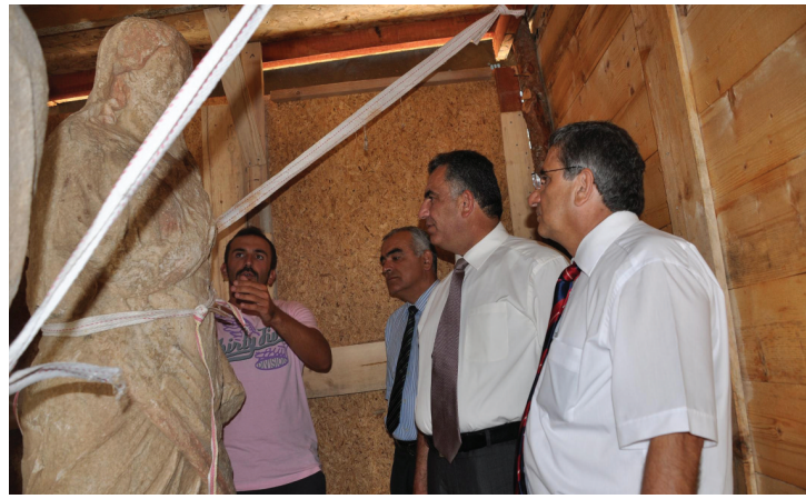
Bakan Çavuşoğlu DAÜ yetkilileri ile yeni bulunan heykelleri inceledi