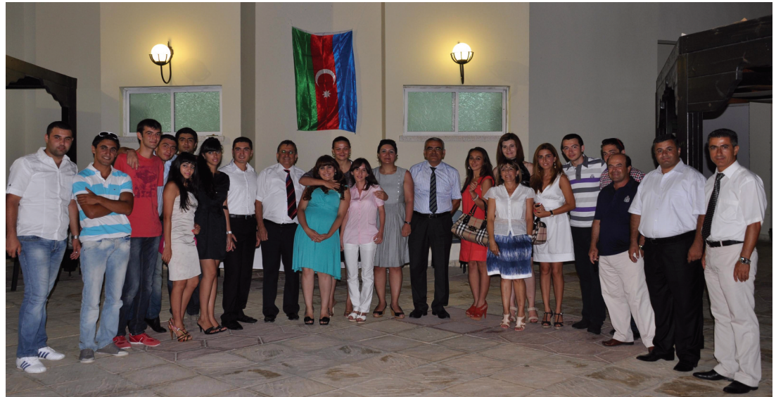
Azeri Milletvekilleri DAÜ'de okuyan Azeri öğrencilerle