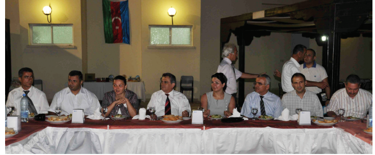
Azeri Milletvekilleri DAÜ yetkilileri ile birarada

Akşam yemeğine AIESEC Doğu Akdeniz ve DAÜ işbirliği ile düzenlenen projeye katılmak üzere ülkemize gelen AIESEC yöneticileri, değişim programı çerçevesinde DAÜ'de bulunan