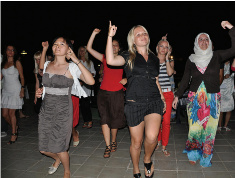
Stajyer öğrenciler eğlenme fırsatı da buldular

boyutlu modelleme konusunda uygulamalı laboratuvar çalışmasına katıldılar. Laboratuvar çalışmasının ardından ise etkinlik düzenlenen kokteyl ile sona erdi. Proje kapsamında Rusya, Çin, Kazakistan,