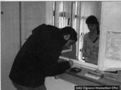
DAÜ Öğrenci Hizmetleri Ofisi

Üniversitenin yeni kimlik kartı basma yoluna gitmeye