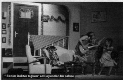
"Benim Doktor Oğlum" adlı oyundan bir sahne