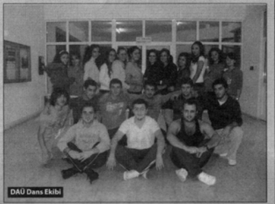
DAÜ Dans Ekibi