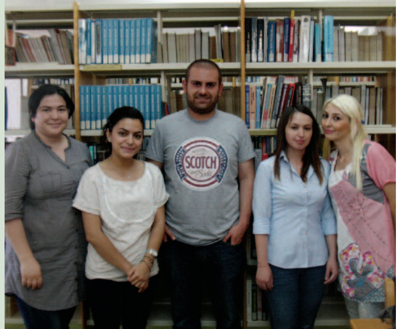
“Ben Okudum Sen de Oku” adlı projede görev alan öğrencilerimiz

Proje gerçekleştiren öğrenciler, “Ben Okudum Sen de Oku” projesinin, üniversite öğrencilerinin eğitim hayatlarında yardımcı kitaplara duydukları ihtiyaçtan doğduğunu belirttiler. Türk Eğitim Vakfı Adana Şubesi Başkanı Remzi Uçar, proje kapsamında toplanan kitapların ihtiyaç duyulan okul kütüphanelerine ulaştırılacağını söyledi. Kampanyalarını başarıyla sonuçlandıranın mutluluğunu yaşayan öğrenciler, okudukları kitaplarını bağışlayarak kampanyalarına destek veren öğretim elemanlarına teşekkür ettiler.