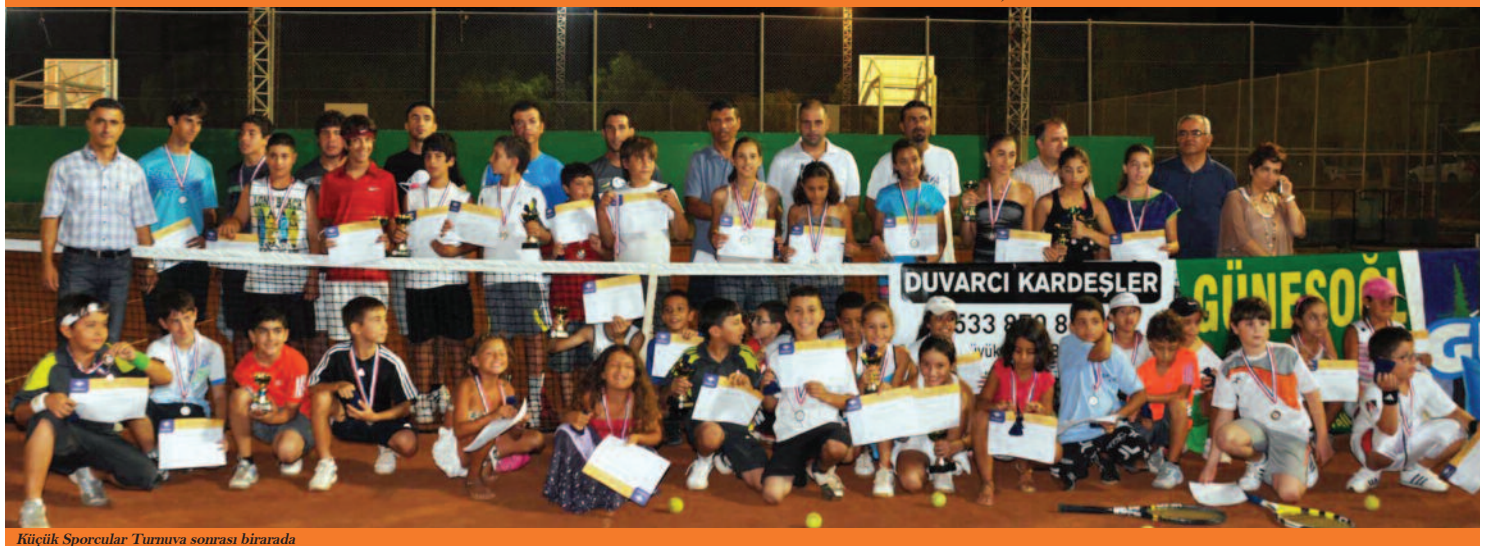
Küçük Sporcular Turnuva sonrası birarada