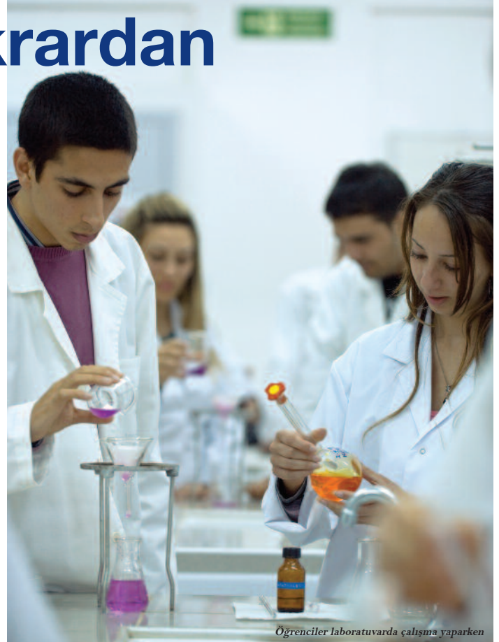
Öğrenciler laboratuvarında çalışmaya yaparken

Tekrardan öğrenci kabulüne başlayacak olan Tıp Fakültesi ile birlikte DAÜ'nün geçen yıl hayata geçirdiği Sağlık Bilimleri Fakültesi ve bu yıl eğitim hayatına başlayan Eczacılık Fakültesi ile DAÜ sağlık alanında bölgenin en güçlü ve yetkili yüksek öğrenim kurumu olarak büyümeye devam ediyor. Uluslararası standartlarda kaliteli eğitime önem vererek akreditasyon ve denklik çalışmalarıyla bölgenin en güçlü Yüksek Eğitim Kurumu olan DAÜ, son iki yıl içinde sağlık alanında eğitime yapmış olduğu yatırımlarla çok farklı alanlarda toplam 10 Fakülte, 4 Yüksek Okul ve İngilizce Hazırlık ve Yabancı Diller Okulu ile güçlü bir Üniversite olarak yoluna devam ediyor.