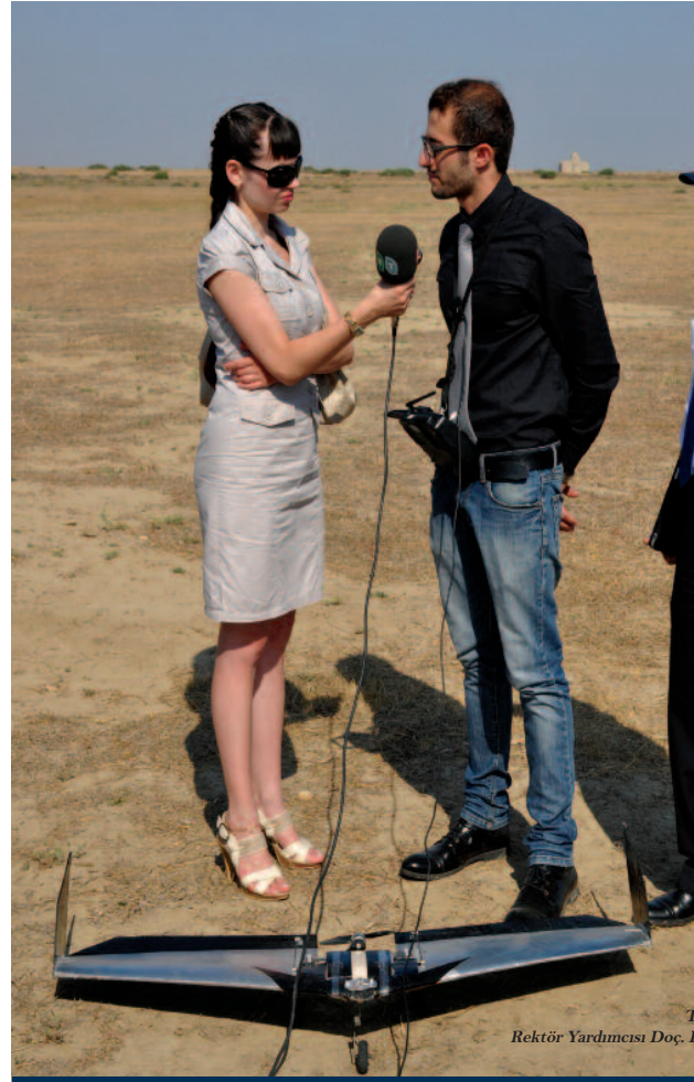
Rektör Yardımcısı Doç. Dr. ...