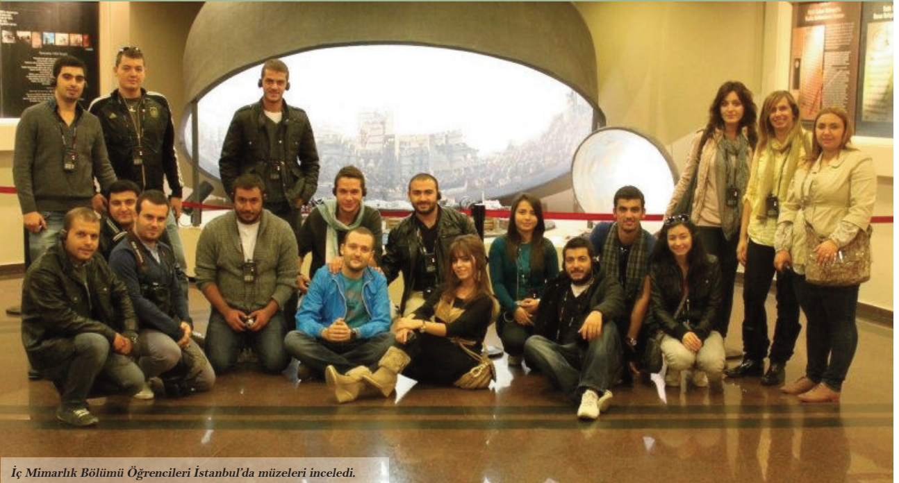
İç Mimarlık Bölümü Öğrencileri İstanbul'da müzeleri inceledi.