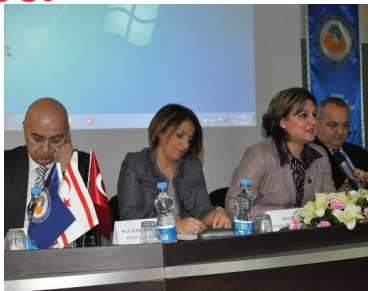
Konferansta Sağlık Bilimleri Fakülteleri tartışıldı