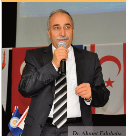
Dr. Ahmet Fakıbaba