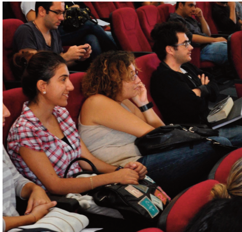
Öğrenciler Konferansı keyifle dinlediler.

konuşmacı olarak katıldıkları "Sporda Şiddetin ve Şikenin Önlenmesi" adlı konferans 27 Ekim 2011 Perşembe günü, saat 12:00'de, Aktivite Salonu'nda gerçekleştirildi.