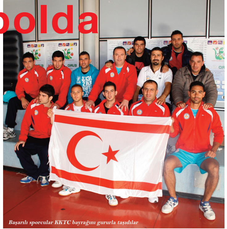
Başarılı sporcular KKTC bayrağını gururla taşıdılar

Üçüncü kez uluslararası bir organizasyonda yer alan DAÜ erkek voleybol takımı ülkemizin şanlı bayrağı ile kupa törenine çıkarken salonda bulu-