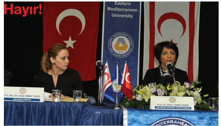
Kadına Yönelik Şiddet Aktivite Salonu'nda ele alındı.