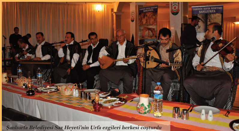
Şanlıurfa Belediyesi Saz Heyeti’nin Urfa ezgileri herkesi coşturdu