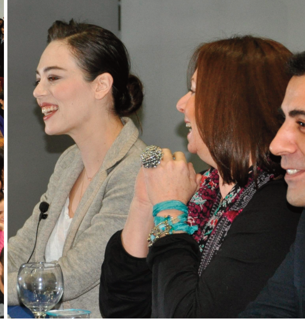
Söyleşi çok yoğun katılıma sahne oldu.