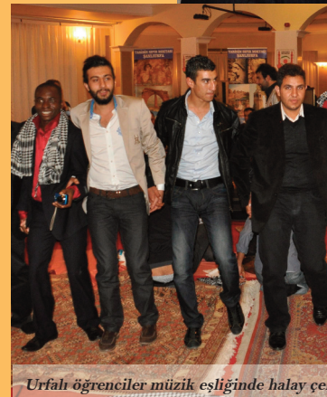
Urfalı öğrenciler müzik eşliğinde halay çektirdi