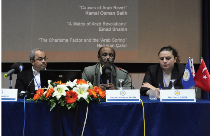
Farklı ülkelerden birçok katılımcı Arap ayaklanmasını tartıştı.

Bakan Atun: “KKTC Ahlak Dışı ve Yasa Dışı İzolasyonlara Maruz Kalmaktadır”