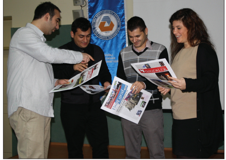
Öğrenciler hazırladıkları gazeteleri, gazete yöneticilerine sundular