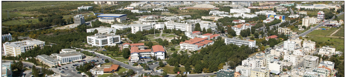
DAÜ, 3 bin dönümlük kampüsü ile de dikkat çekiyor

gösteren 180'i aşkın Devlet ve Vakıf Üniversiteleri arasında ise Tıp Fakültesi olmayan üniversiteler içerisinde 7., ücretli eğitim veren üniversiteler arasında ise 5. sırada yer almıştır. Bu başarı, üniversitemizi gururlandırması yanında, hedeflenen kaliteli eğitim ve uluslararası kariyer vizyonu ile önümüzdeki yıllarda daha iyi sıralarda yer alması açısından motive etmektedir.