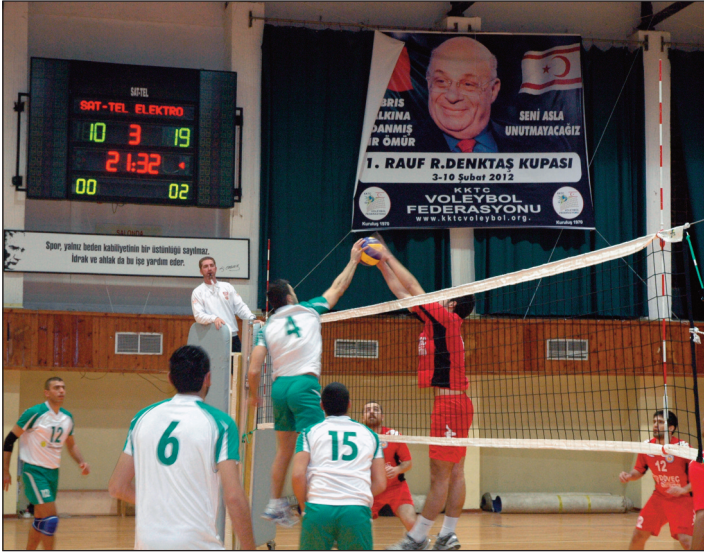
Sporcularımız tüm maçlarda üstün bir oyun sergiledi