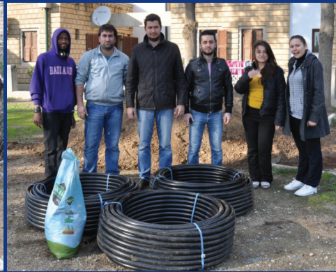
SOS Çocuk Köyü bahçesi iletişim öğrencileri sayesinde artık daha düzenli