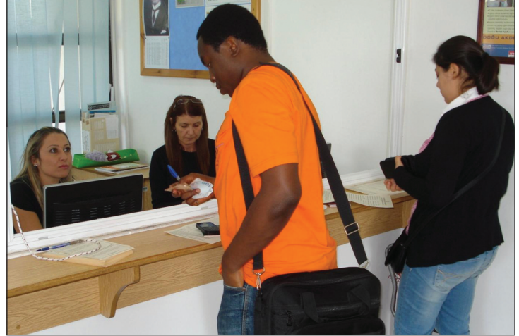
Öğrenciler, Öğrenci Hizmetleri Ofisi'nde işlem yaptırırken

DAÜ Öğrenci Hizmetleri Ofisi ile ogrencihizmetleri@emu.edu.tr veya