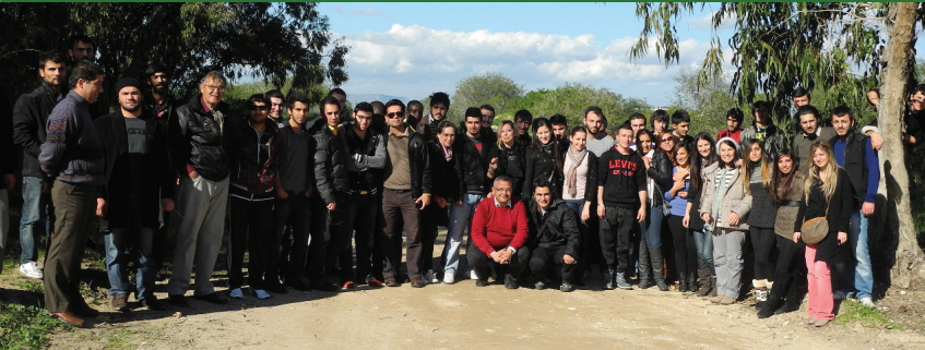
DAÜ'lüler diktikleri fidanlarla Kıbrıs'ın doğasına katkıda bulundular

Doğu Akdeniz Üniversitesi (DAÜ) öğrencileri ve öğretim elemanları Matematik Kulübü organizasyonluğunda, Bedis bölgesine fidan diktiler. Kıbrıs'taki orman sayısının azlığına dikkat çeken öğrenciler; insanların ağaçları bilinçsizce kesmelerinden duydukları rahatsızlıklarını dile getirdiler. Rahmetli Kurucu Cumhurbaşkanımızın vefatından duydukları üzüntüyü de dile getiren