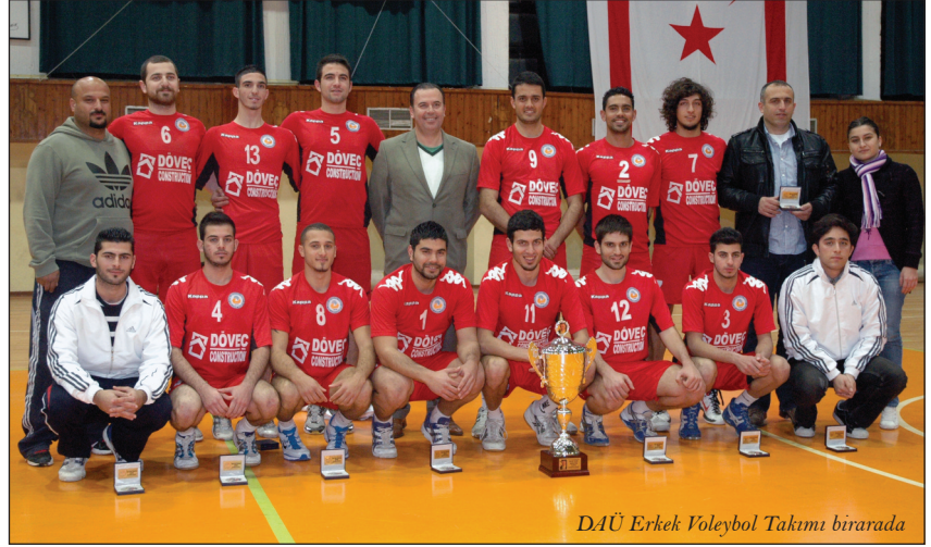
DAÜ Erkek Voleybol Takımı birarada