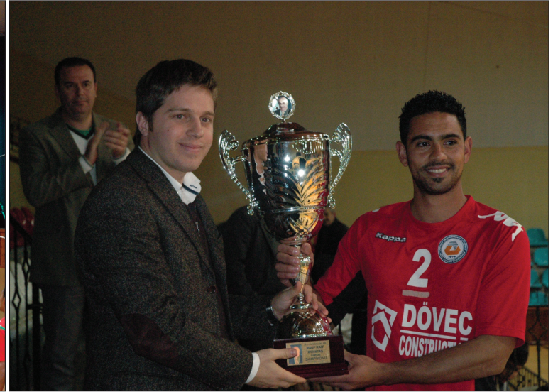
Sporcularımız kupayı Merhum Kurucu Cumhurbaşkanı Rauf Raif Denктаş'ın torunundan aldılar