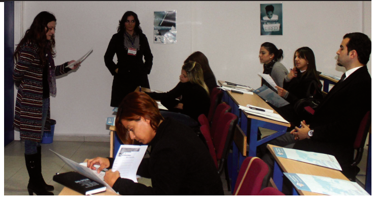
TOLES tanıtım günlerine katılan katılımcılar, Hukuk İngilizcesi derslerini izleme fırsatı yakaladılar

TOLES kursları ile ilgilenenler DAÜ Sürekli Eğitim Merkezi'nden veya http://sem.emu.edu.tr adresinden de temin edebilecekleri başvuru formlarını DAÜ-SEM sekreterliğine teslim ederek veya faks olarak (Fax no: 03926302472) kurslara kayıt yaptırabilirler. İlgilenenler ayrıntılı bilgiye 6302471 veya 6302423 nolu telefonlardan