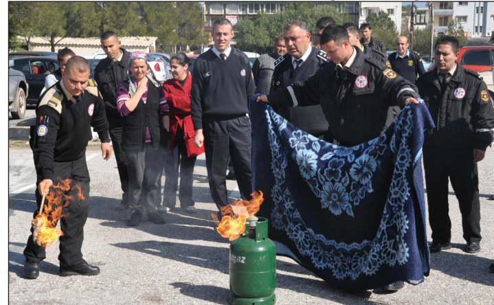
Yangın söndürme tatbikatı ilgi ile izlendi

341'inin ihmalden kaynaklandığını belirtti. Soru cevap şeklinde geçen Gürpınar'ın yaptığı sunumun ardından, İtfaiye Başmüfettişi Aktivite Merkezi park alanında yangın söndürme tatbikatı gerçekleştirildi.