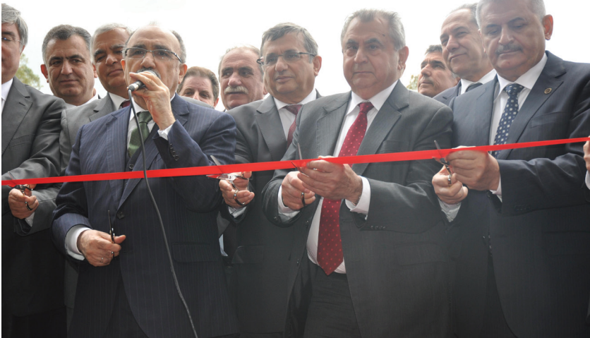
Törene katılan protokol açılış kurdelerini keserken.

aşamasında destek verdiklerini söyledi. Küçük, ülkede her zaman Türkiye Cumhuriyeti katkılarıyla gerçekleştirilen eserlerle karşılaştıklarının da altını çizerek destek ve katkılardan dolayı Türkiye Cumhuriyeti'ne teşekkürlerini ilettiler. Denктаş isminin de böylesi görkemli bir yapıya verilmesinin herkesi memnun ettiğine değinen Küçük, merkezin herkese hayırlı olmasını diledi.