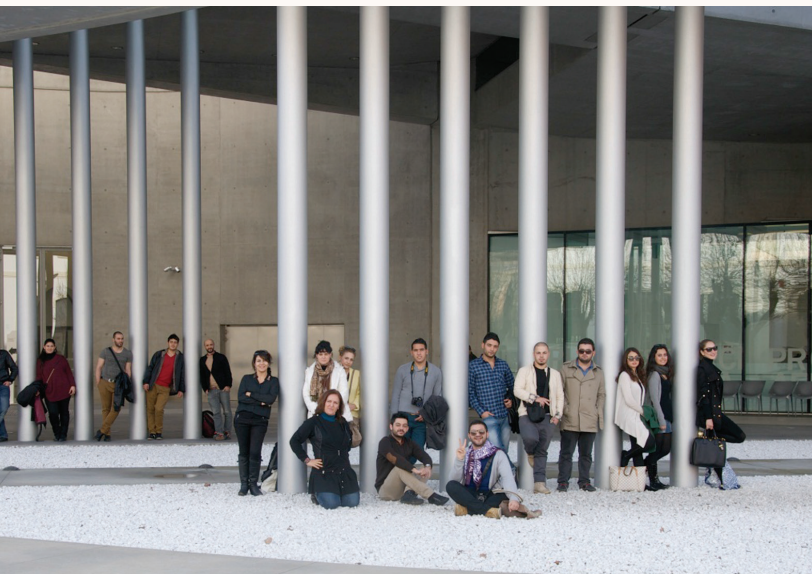
da çeşitli binaları inceledi