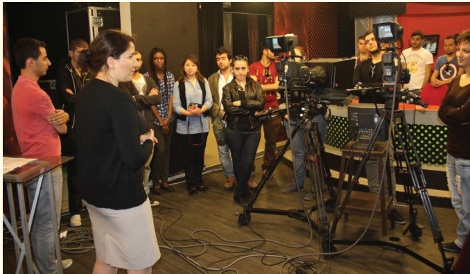
Öğrenciler Ada TV'de bilgi aldılar

gezinin kendileri için çok yararlı geçtiğini ve çok yararlı bilgileri edindiklerini ifade ettiler.