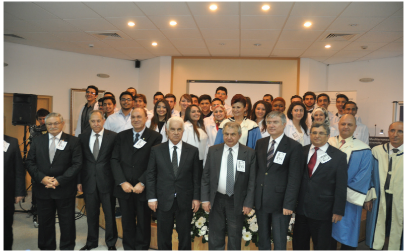
Tören sonrası öğrenciler ve protokol hatıra fotoğrafı çekildi.