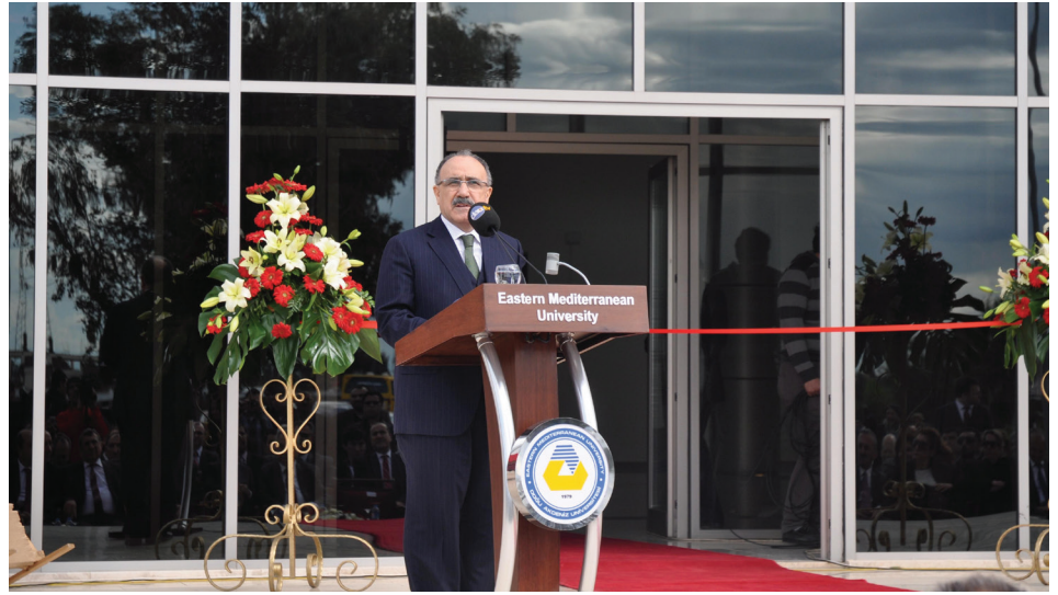
Türkiye Cumhuriyeti Kıbrıs İşlerinden Sorumlu Başbakan Yardımcısı Beşir Atalay

Rauf Raif Denktaş Kültür ve Kongre Sarayı 18 Şubat 2013 tarihinde, saat 12:00'de gerçekleştirilen törenle açıldı. Doğu Akdeniz Üniversitesi (DAÜ) ve Gazimağusa Belediyesi işbirliği ile tamamlanan Kongre Sarayı Türkiye Cumhuriyeti Kıbrıs İşlerinden Sorumlu Başbakan Yardımcısı Beşir Atalay tarafından açıldı. Türkiye Cumhuriyeti Ulaştırma, Denizcilik ve Haberleşme Bakanı Binali Yıldırım'ın da katıldığı açılış törenine KKTC Başbakanı İrsen Küçük, Türkiye Cumhuriyeti Lefkoşa Büyükelçisi Halil İbrahim Akça ile bazı bakan ve milletvekilleri de katıldı. Yaklaşık 10,000 metrekare kapalı alanı bulunan ve modern bir mimari tasarımı ile son teknolojik özelliklerde donanıma sahip, adada ve hatta bölgede ilk olan Rauf Raif Denktaş Kültür ve Kongre Sarayı binasında 1200 ve 350 kişilik çok amaçlı salon, 200, 100 ve 4 adet 60 kişilik konferans salonları, kapalı ve açık alan sergi salonları, müze salonları, sanat atölyeleri, müzik, tiyatro ve eğitim odaları, kafeterya, depo, VIP ve basın odaları ile yönetim odaları ve yeterli sayıda otopark bulunmaktadır. Ülkenin kültür ve kongre turizmine önemli katkı sağlayacağı düşünülen tesisin bina, donanım, çevre ve mefuzat yapımları ile ilgili mali kaynak Türkiye Cumhuriyeti Yardım Heyeti tarafından karşılanmıştır. >> sayfa 3