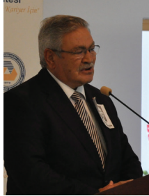
Bakan Ertuğrul Hasipoğlu