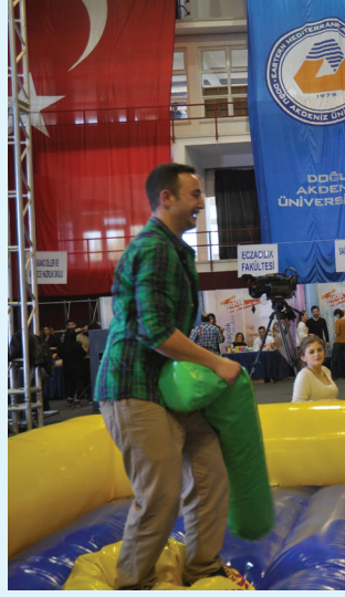
Tanıtım Günleri boyunca çeşitli yarışmalar düzenlendi

Söz konusu etkinliğin ilk günü olan 25 Şubat 2013 Pazartesi günü Gazimağusa ve İskele bölgelerinden, 26 Şubat 2013 Salı günü Lefkoşa bölgesinden, 27 Şubat 2013 Çarşamba günü ise Girne ve Güzelyurt bölgelerinden lise son sınıf öğrencileri rehber öğretmenleri eşliğinde etkinliğe katıldılar. 2000'e yakın öğrencinin katıldığı etkinliğe Gazimağusa ve İskele Bölgelerinden ilk gün Gazimağusa Türk Maarif Koleji, Namık Kemal Lisesi, Cumhuriyet Lisesi, Dr. Fazıl Küçük Endüstri Meslek Lisesi, Gazimağusa Meslek Lisesi, Gazimağusa Ticaret Lisesi, Bekirpaşa Lisesi, İskele Ticaret Lisesi, Karpaz Meslek Lisesi ve Doğa Koleji ile Lefkoşa Bölgesi'nden Bülent Ecevit Anadolu Lisesi, ikinci gün Lefkoşa Bölgesi'nden Değirmenlik Lisesi,