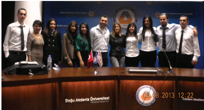
Etkinliğe gerçekleştiren Mütercim Tercümanlık Bölümü öğrencileri

Hekimoğlu, öğrencilerini iş yaşamına hazırlamayı ilke edinen bir eğitim programına sahip olduklarını, öğrencilerini meslek hayatına 21. yüzyılın ve küreselleşmenin gerektirdiği tüm teknik ve kültürel donanımla hazırlamayı ilke edindiklerini vurguladı ve öğrencilerinin çalışmalarının sunulduğu "5. Beyaz Perde Günleri" etkinliği ile çevirmenlik mesleğinin medya sektöründeki önemini altını bir kez daha çizdiklerini ve bölüm olarak farklarını bir kez daha ortaya koyduklarını belirtti.