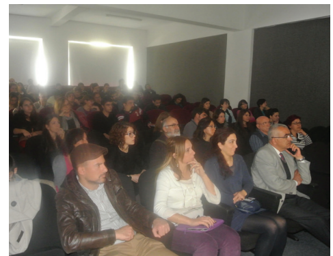
Anma Paneli'ne yoğun katılım oldu