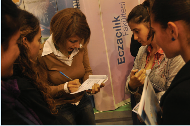
Öğrenciler fakülteler hakkında bilgi aldı

öğrencilerinin yaklaşık olarak tamamı üç gün boyunca DAÜ'yu ziyaret edecek. Bu etkinlikle öğrenciler üniversiteyi yakından ve yerinde yaşama şansı elde edecektir." şeklinde konuştu.