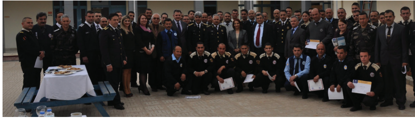
Sertifika Töreni sonrası toplu hatıra fotoğrafı çekilirken