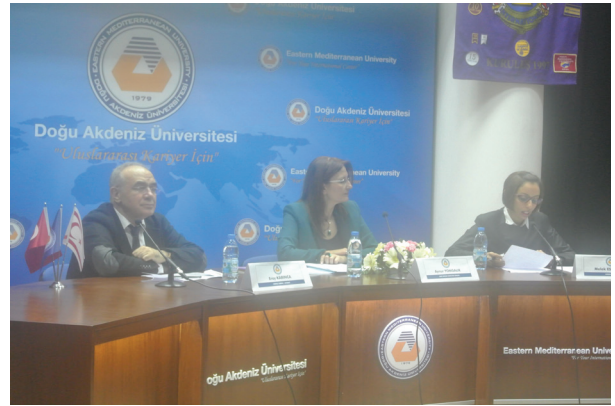
Panel konuşmacıları kadına karşı şiddeti ele aldılar