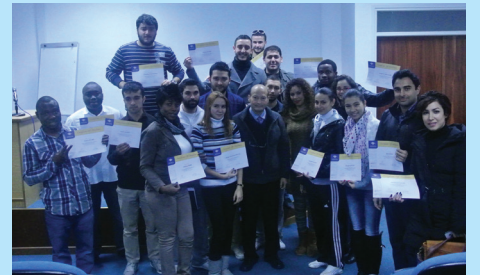
Sınava katılan öğrenciler bir arada

fikalar uluslararası iş dünyasına giriş vizesi ve başarı anahtarı olarak kabul edilmektedir. DAÜ tarafından verilen kurslarda alanında uzman eğitimciler Turizm ve İşletme İngilizcesi öğretmek için LCCI tarafından da eğitilmişlerdir. Ekim ayında başlayacak yeni dönem kurslara katılmak isteyenler DAÜ Sürekli Eğitim Merkezi’nden veya 630 2471 numaralı telefonda detaylı bilgi alabilirler.