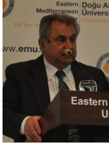
Başbakan İrsen Küçük