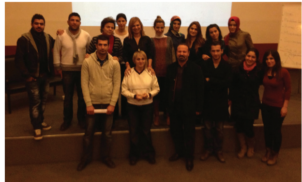
DAÜ öğretim üyeleri Gaziantep'teki kursiyerlerle birlikte

Değerlendirme), Çift Danışmanlığı, Aile ve Çift Danışmanlığı Teknikleri, Evlilik Öncesi Psikolojik Danışma, Aile ve Evlilik Danışmanlığında Müdahale Programları, AED Krize Müdahale, Proje Çalışması, Aile Hukuku, AED Uygulaması I (Çift), AED Uygulaması II (Aile), Supervizyon I (Çift) ve Supervizyon II (Aile) olarak belirlenmiştir.