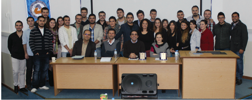
Yarışmaya katılan Endüstri Mühendisliği Bölümü öğrencileri birarada

danışmanlığında olan bir şeker firmasının satış ve kar hacmini arttırmaya yönelik idi.