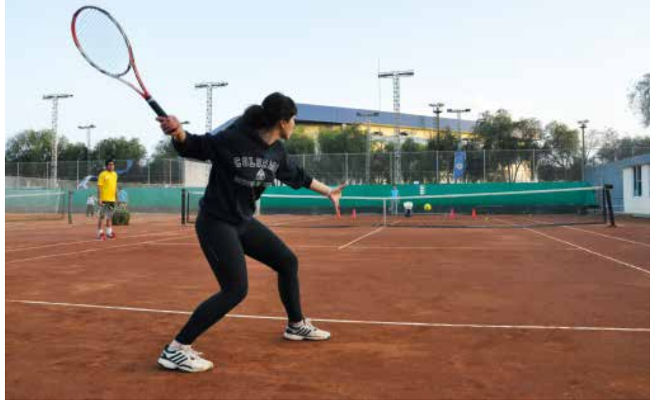
Yeni tenis kortlarımızın tadını çıkararak öğrencilerimiz

Özellikle takım altyapısını oluşturan yaş gruplarında Şubat tatili boyunca sabah akşam antrenmanlarına devam edecek olan Doğu Akdeniz Üniversitesi Tenis Kulübü bu kategoride de zirveye göz dikti. KKTC liglerinde erkekler ve kadınlar kategorisinde mücadele eden takımımız hedef yükselterek şampiyonluğa en büyük aday olduğunu kadrosunu ve tesislerini yenileyerek ispatlamış oldu.