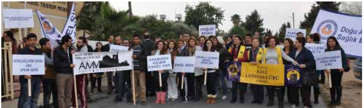
"Engelsiz Ada İçin Elele" yürüyüşünden bir kare