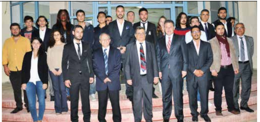
2013-2014 Öğrenci Konseyi DAÜ Yönetimi ile birarada