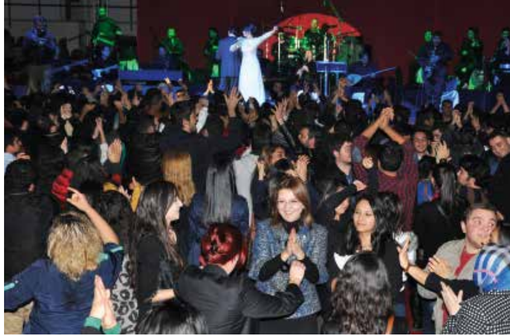
Öğrenciler ve misafirler, türküler eşliğinde eğlenceli saatler geçirdi