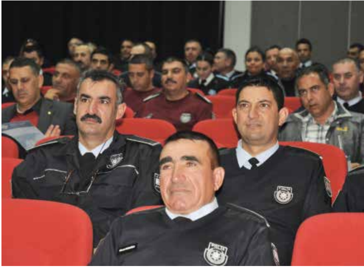
Polis memurları seminerleri ilgi ile izledi