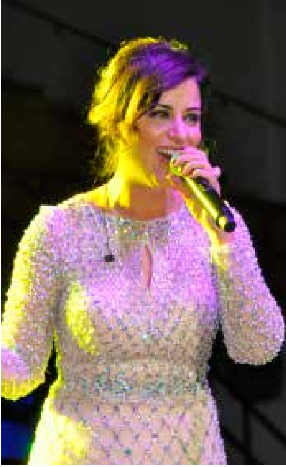
Zara gecede türkü şöleni yaşattı

Doğu Akdeniz Üniversitesi (DAÜ) Sosyal ve Kültürel Aktiviteler Müdürlüğü ile DAÜ Öğrenci Konseyi'nin her yıl geleneksel olarak düzenledikleri "Türkülerle DAÜ" etkinliğinin beşincisi bu yıl 20 Aralık 2013, Cuma akşamı gerçekleştirildi.