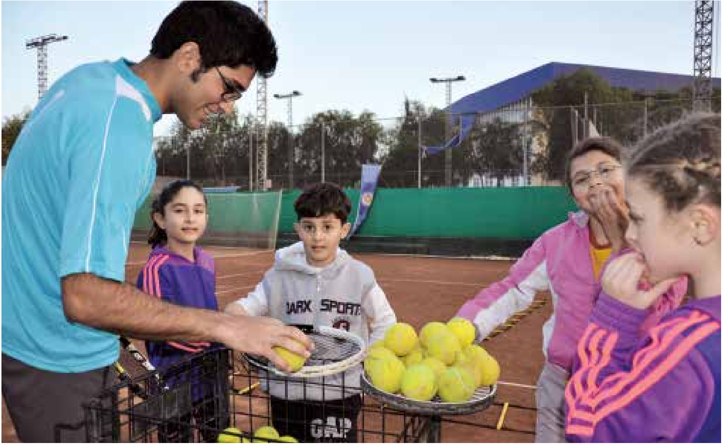
Minikler tenis öğrenirken