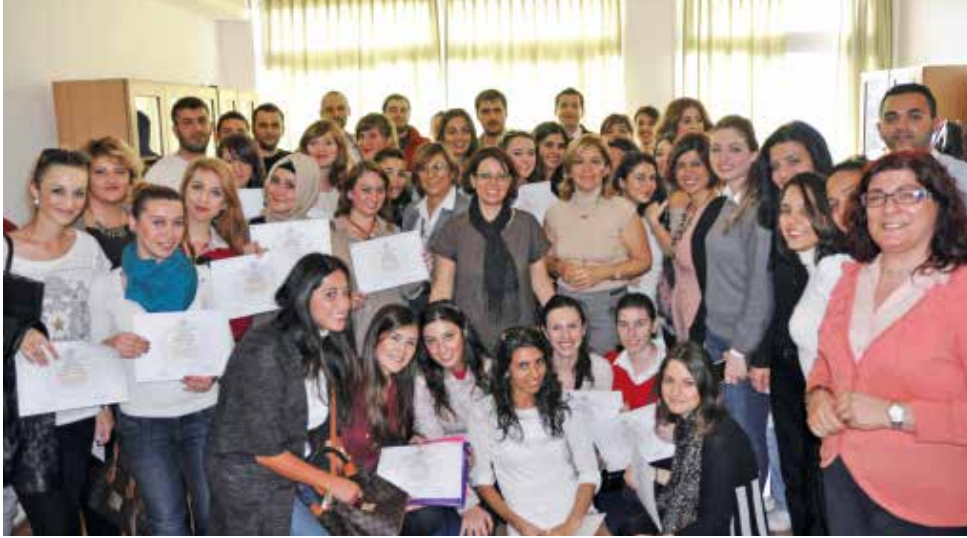
Sertifika almaya hak kazanan İlköğretim Bölümü öğrencileri Öğretim Görevlileri ile birarada

Doğu Akdeniz Üniversitesi (DAÜ), Eğitim Fakültesi İlköğretim Bölümü 2012 – 2013 Akademik Yılı'nda başarılı olan öğrencilerine "Şeref ve Yüksek Şeref" sertifikalarını vermek üzere sertifika töreni düzenledi.