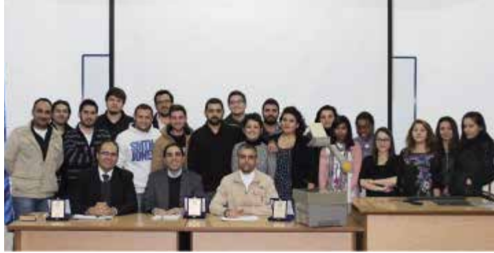
Yarışmayı organize eden Endüstri Mühendisliği Kulübü üyeleri birarada