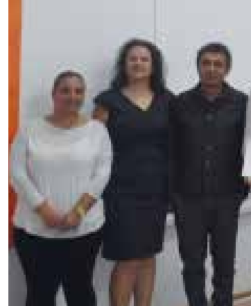
Yarışma sonrasında ödül alan katılımcılar ve öğre