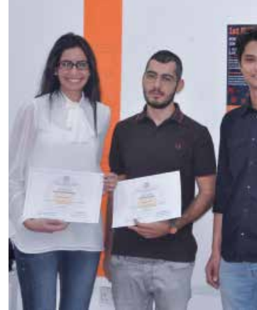
Yarışma sonrası ödül kazanan öğrenciler