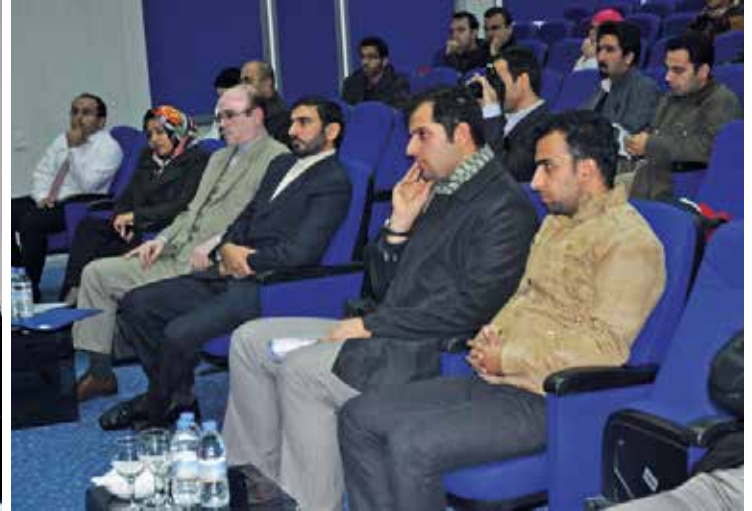
Seminer yoğun ilgi gördü