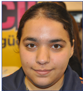
Aysel Uruk Güzelyurt Meslek Lisesi Son Sınıf Öğrencisi

DAÜ'ye daha önce gelmemiştim. Gelince ne kadar güzel ve büyük bir üniversite olduğunu gördüm. Diplomasının her yerde geçerli olması çok güzel ve DAÜ'nün kesinlikle çok kaliteli bir eğitim yapısı var. Ben Psikolojik Danışmanlık ve Rehberlik bölümünü düşünüyorum. DAÜ de tercihlerim arasında olan bir üniversite.