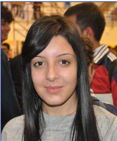
Nezaket Şadırvan Kurtuluş Lisesi Son Sınıf Öğrencisi

DAÜ'ye daha önce de geldim ve ne kadar güzel bir üniversite olduğuna biliyordum. Tanıtım Günleri sayesinde ise ileride eğitim almayı düşündüğüm bölüm olan Hemşirelik hakkında ve sunduğu olanaklar hakkında bilgi sahibi oldum. Tanıtım Günleri çok güzel ve eğlenceli geçiyor. Burada herkes çok ilgili ve ileride DAÜ kesinlikle tercihlerim arasında olan bir üniversite.