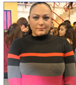
İpek Awwad Bekir Paşa Lisesi Psikolojik Danışman ve Rehberlik Öğretmeni

DAÜ, KKTC'de bulunan ilk ve en köklü üniversite olduğu için KKTC'de okumayı düşünen öğrencilerime tavsiye ediyorum. Sınav sisteminin geçerli ve güzel olması, öğretim kadrosu ve eğitim kalitesinin yüksek olması DAÜ'yü diğer üniversitelerden farklı kılan özelliklerindedir. Ayrıca, DAÜ'den mezun olan öğrencilerin donanımlı bir şekilde yetiştiklerini bu yüzden de iş bulma olanaklarının daha yüksek olduklarını gözlemledik.