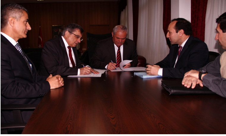
Protokol İmza Töreni'nden bir kare