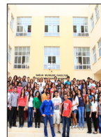
Sağlık Bilimleri Fakültesi Bir İlke Daha İmza Atıyor