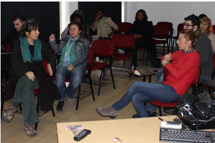
Atölye çalışmasında öğrenciler

DeneySEL ve belgesel filmler yapan Nurşen Bakır, 1979-1981 yılları arasında devam ettiği Hacettepe Üniversitesi Felsefe bölümündeki eğitimini yarım bırakarak, sinema alanında öğrenim görmek için ABD'ye gitti. 1991'de City University of New York'ta lisans, 2002'de San Francisco State University'de yüksek lisans eğitimini tamamladı. Çok sayıda belgesel çekti. Amerikalı ve Hollandalı sinemacılarla çalıştı. Bilgi Üniversitesi Film ve Televizyon Bölümü'nde öğretim görevlisi olarak çalıştı. Halen, Sine-Yol bünyesinde belgesel filmler çekmektedir.