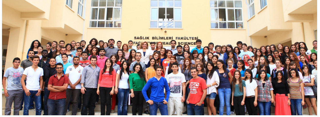
Sağlık Bilimleri Fakültesi öğrencileri birarada