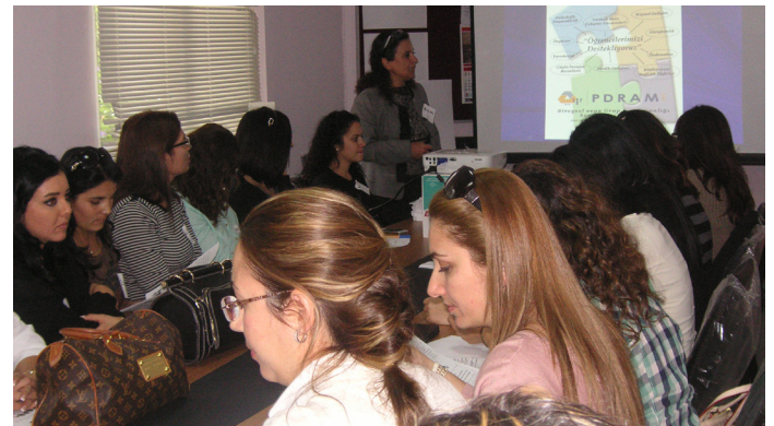
Anaokulu eğitimcileri DAÜ-PDRAM'ın atölye çalışmasına yoğun ilgi gösterdi