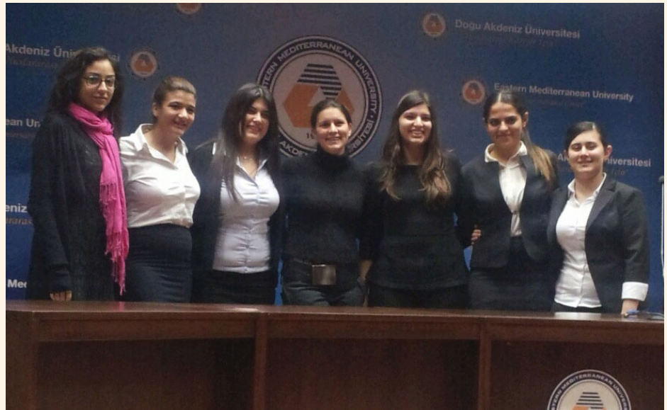
"Beyaz Perde Günleri"ni düzenleyen ekip birarada