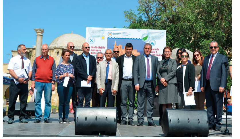
Turizm Günleri'ne katkıda bulunanlara sertifika takdim edildi

Doğu Akdeniz Üniversitesi (DAÜ) Turizm Fakültesi "2017 Dünya Kültür Mirası ve Sürdürülebilir Turizm" temalı turizm günü etkinlikleri gerçekleştirdi. Her yıl düzenlenen DAÜ Uluslararası Turizm Günü, bu yıl 20 Nisan 2017 Perşembe günü, Gazimağusa Namık Kemal Meydanı'nda, 10:00 – 17:00 saatleri arasında düzenlendi.