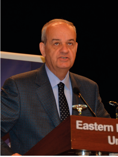
Org. İlker Başbuğ

Doğu Akdeniz Üniversitesi (DAÜ) 23. Bahar Festivali kapsamında DAÜ Atatürkçü Düşünce Kulübü (DAÜ ADK) 26. Genel Kurmay Başkanı Org. İlker Başbuğ'u ağırladı. Org. İlker Başbuğ, DAÜ 23. Bahar Festivali ilk gün etkinlikleri kapsamında, 17 Mayıs 2017 Çarşamba günü, saat 14:00'te, Rauf Raif Denктаş Kültür ve Kongre Sarayı'nda, "Türkiye'nin Güncel Sorunları" konulu bir konferans verdi. Saygı duruşu ve İ-