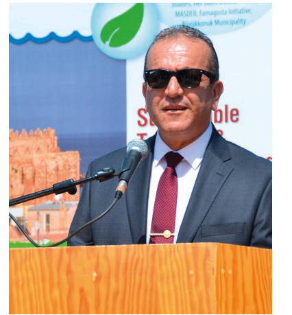
Bakan Fikri Ataoğlu