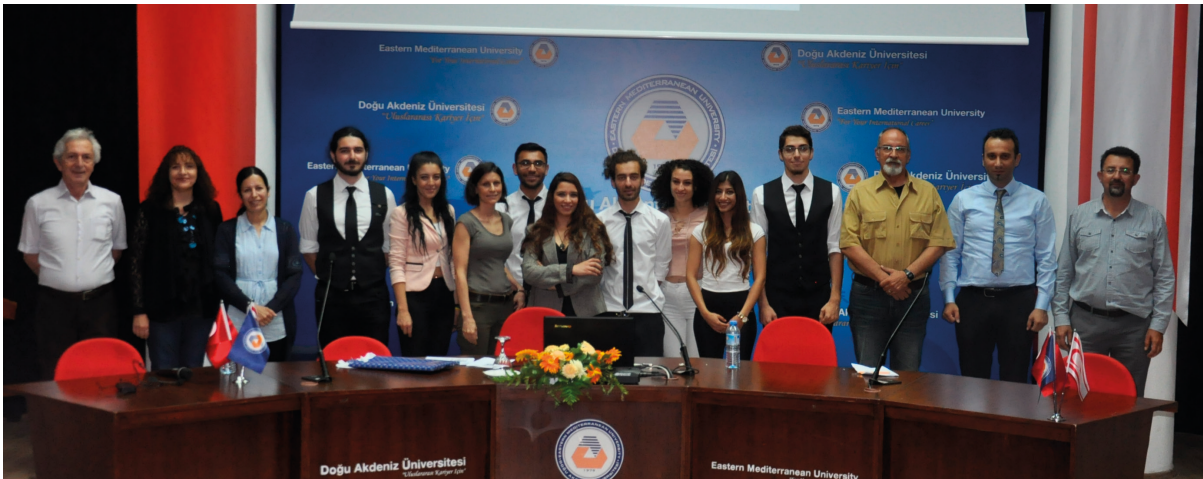
"Belgesel Çevirisi Günleri"nde görev alan öğrenciler ve öğretim görevlileri birarada

Daimi hedefi "Değerli meslektaşlar" yetiştirmek olan DAÜ Mütercim Tercümanlık Bölümü, bu etkinlikle farklı bakış açısını ve uygulamalı eğitim anlayışını bir kez daha göstermiş oldu.