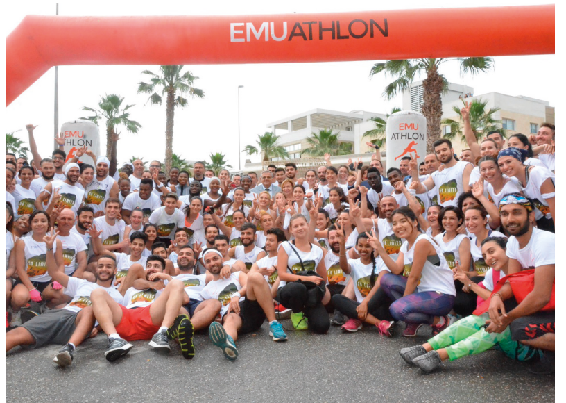
EMUATHLON mücadelesinde 200 sporcu mücadele etti