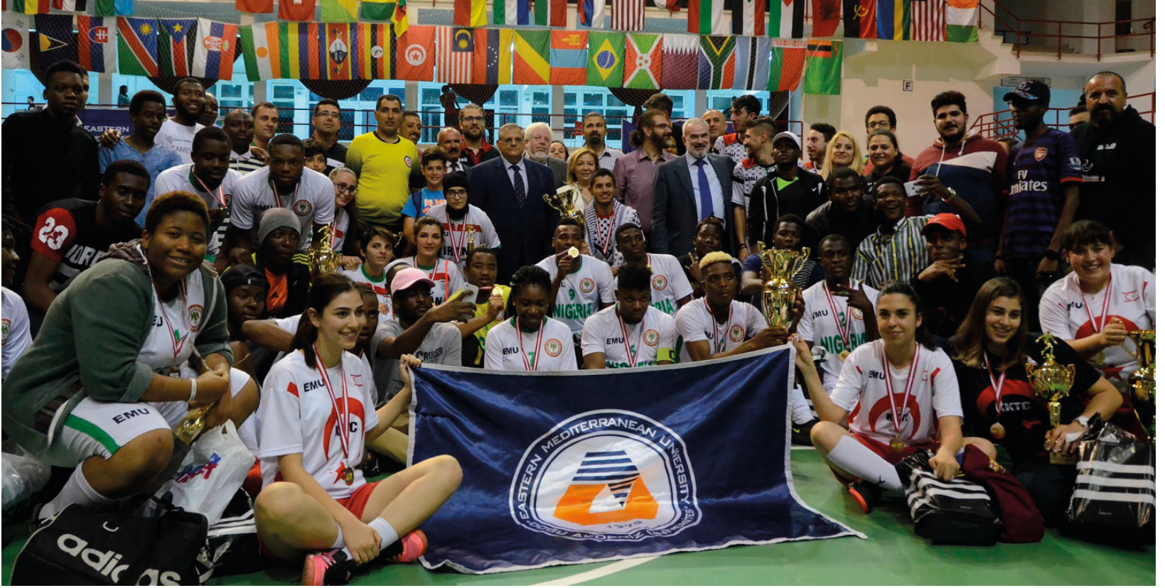
DAÜ Uluslararası Futsal Turnuvası'nda şampiyon olan takımlar birarada

Doğu Akdeniz Üniversitesi (DAÜ) Spor İşleri Müdürlüğü tarafından organize edilen "DAÜ Uluslararası Futsal Turnuvası" 19 Nisan 2017 Çarşamba akşamı, Lala Mustafa Paşa Spor Sarayı'nda oynanan final maçları ve ödül töreni ile sona erdi.