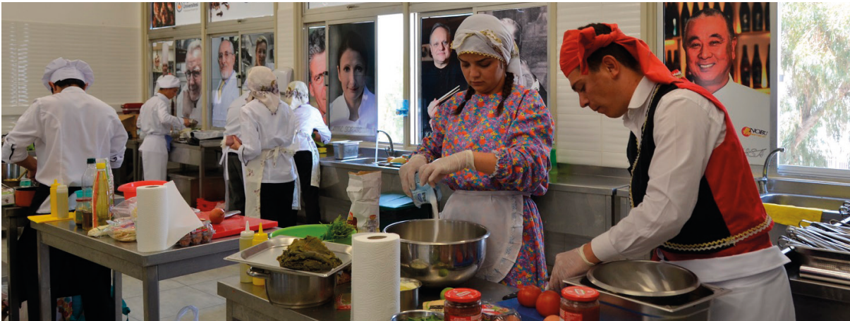
Meslek Lisesi öğrencileri yarışmalarda dereceye girmek için kıyasıya yarıştılar