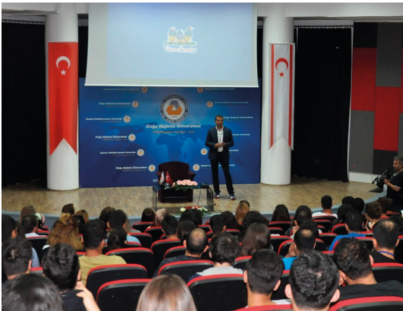
Cüneyt Özdemir'in söyleşisine ilgi yoğun oldu

Doğu Akdeniz Üniversitesi (DAÜ) 23. Bahar Festivali kapsamında ünlü gazeteci, yazar ve TV program yapımcısı Cüneyt Özdemir öğrencilerle bir araya geldi. Özellikle CNN Türk ekranlarında yayınlanan ve birçok ödül alan 5N1K programı ile tanınan Cüneyt Özdemir, Mustafa Afşin Ersoy Salonu'nda gerçekleşen söyleşide, mesleğe nasıl başladığını, deneyimlerini ve başarı hikayelerini anlattı. Televizyon gazeteciliğinin her alanında çalıştığını, kitaplar yazıp, belgeseller çektiğini ve 32. Gün ekibinde yer aldığı-