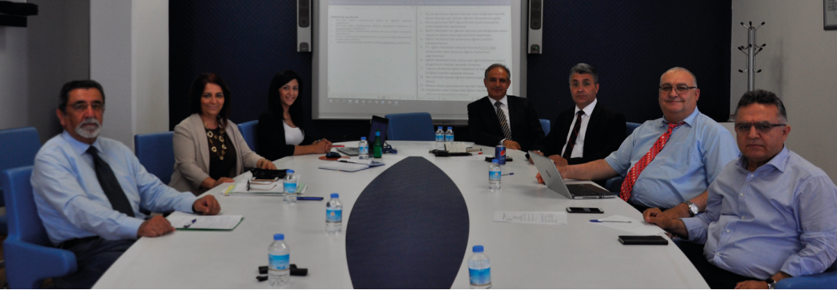
EFDEK-KKTC ilk toplantısını DAÜ'de gerçekleştirdi.

KKTC Yükseköğretim Planlama, Denetleme, Akreditasyon ve Koordinasyon Kurulu'nun (YÖDAK) çağrısı üzerine 7 Mart 2017 tarihinde toplanan Eğitim Fakültesi Dekanları, Eğitim Fakültelerinin sorunlarını bilimsel veriler ve ürünler çerçevesinde değerlendirmek ve Fakültelerin eğitim-öğretim, araştırma/yayın ve topluma hizmete yönelik faaliyetlerinin etkin ve verimli bir biçimde yürütülmesine katkıda bulunmak amacıyla bir Konsey kurdu.