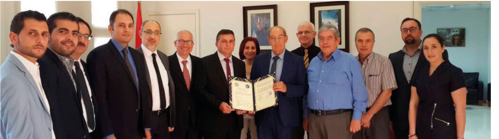
DAÜ heyeti Lübnan'daki temasları sırasında.