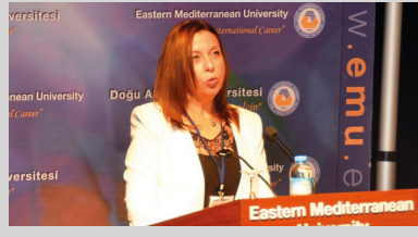
DAÜ'de 2. Uluslararası Bankacılık ve Finans Perspektifleri Konferansı Gerçekleştirildi