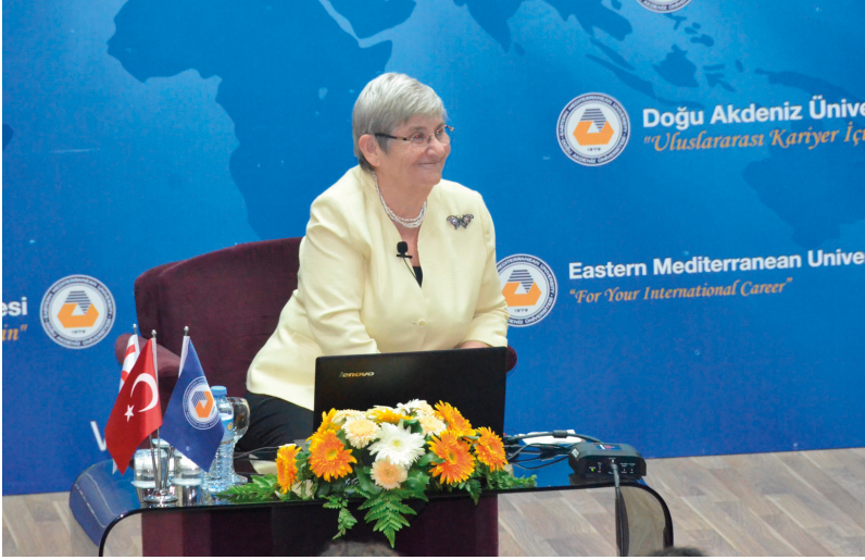
Prof. Dr. Canan Karatay "Şeker en tatlı zehirdir" dedi