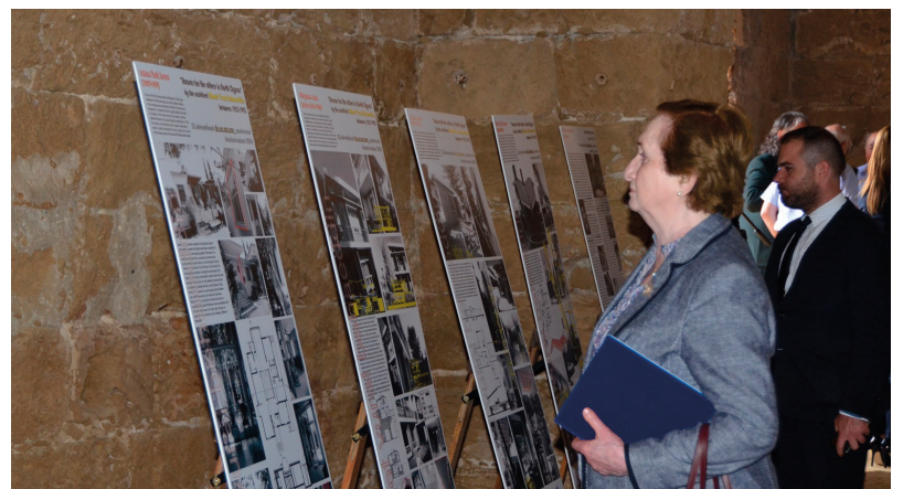
Etkinlikte mimarın yapıtlarının posterleri sergilendi