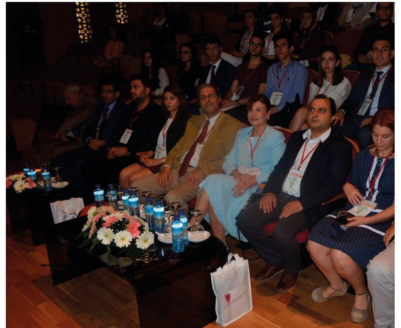
Kongreye katılım yoğun oldu