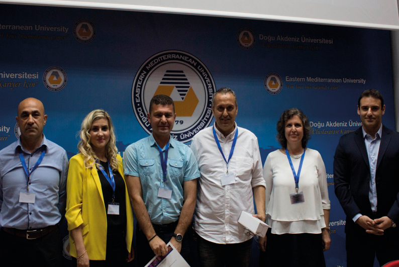
Cisco Networking Academy toplantısında sertifika da verildi.