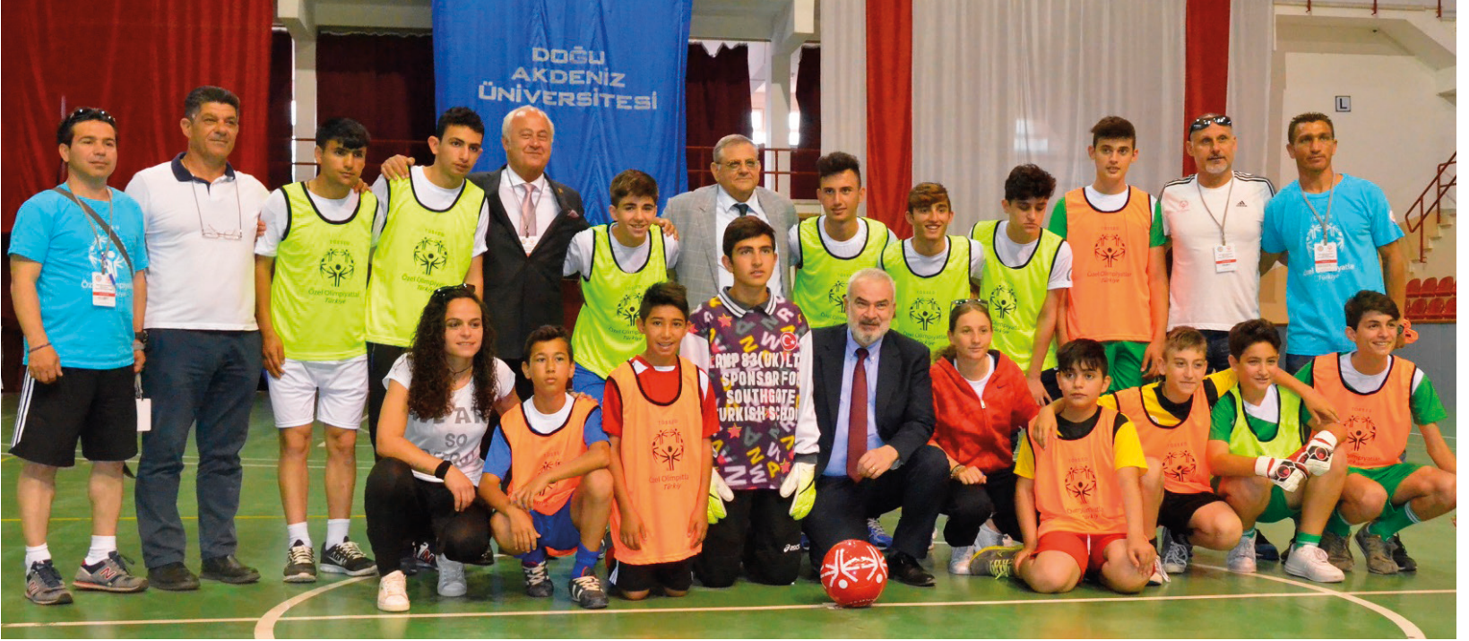
Dilek Sabancı Karma Futbol Projesi'nde özel ve partner sporcular karma futbol branşında performans sergiledi

Özel eğitim gereksinimi olan bireyleri yaşlarıyla kaynaştırıp topluma kazandırmayı amaçlayan Özel Olimpiyatlar Türkiye, Dilek Sabancı Karma Futbol Projesi Doğu Akdeniz Üniversitesi (DAÜ) ev sahipliğinde ikinci kez gerçekleştirildi. "4'lü Karma Futsal Turnuvası ve Sağlıklı Sporcu Taramaları" adlı etkinlik DAÜ Lala Mustafa Paşa Spor Sarayı'nda düzenlendi.