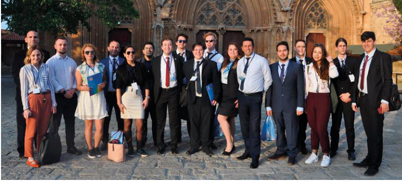
5. AEHT Gençlik Parlamentosu üyeleri, Kuzey Kıbrıs'ı yakından tanıma fırsatı buldular

5. AEHT Gençlik Parlamentosu üyeleri, Kuzey Kıbrıs'ın tarihi, kültürel ve doğal turizm merkezlerini tecrübe ettikleri gezi ve inceleme turlarına da katıldılar. Bu turlar Parlamento üyelerinin Kuzey Kıbrıs hakkında bilgilenmelerini ve Kuzey Kıbrıs'ın dokusuna ilişkin deneyimler edinmelerini sağladı. 5. AEHT Gençlik Parlamentosu için adamızda bulunan tüm üyeler, tatil ve eğitim amacıyla yeniden geleceklerini dile getirdiler.