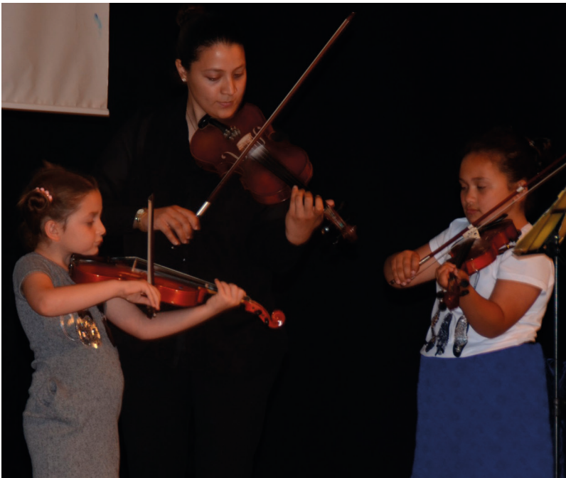
Kongrede müzik dinletisi de gerçekleştirildi