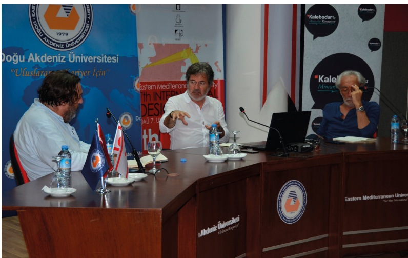
"Mimarlarla Kalebodur Söyleşileri" etkinliği büyük ilgi gördü

Doğu Akdeniz Üniversitesi (DAÜ) Mimarlık Fakültesi'nin gelenekselleştirdiği "DAÜ Uluslararası Tasarım Haftası" 15 Mayıs 2017 Pazartesi günü, saat 10:00'da, Mimarlık Fakültesi'nde yapılan açılış töreni ile başladı.