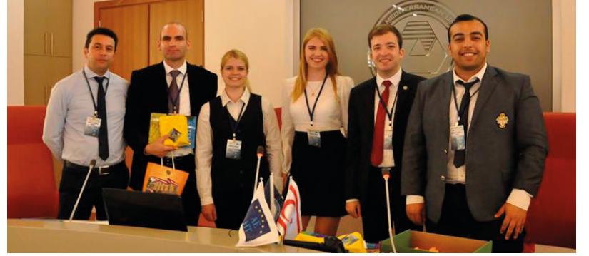
DAÜ ilk kez AEHT Gençlik Parlamentosu'na ev sahipliği yaptı