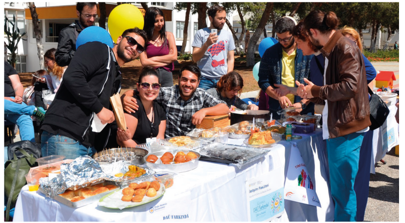
DAÜ'nün akademik ve yönetsel tüm birimleri kermese katkıda bulundu

Doğu Akdeniz Üniversitesi (DAÜ), 1 – 7 Nisan Kanser Haftası dolayısıyla, KKTC Kanser Hastalarına Yardım Derneği yararına önemli bir kermese imza attı. Söz konusu hafta kapsamında, DAÜ Personel İşleri Müdürlüğü öncülüğünde, 3 Nisan 2017 Pazartesi günü, 10:00 – 13:00 saatleri arasında, DAÜ kampüsü içerisinde yer alan Merkezi Derslik (CL) önünde renkli bir kermes gerçekleştirildi. DAÜ'de yer alan tüm fakülte, müdürlük ve birimlerin katkılarıyla kurulan stantlarda çeşitli yiyecek ve içeceklerin satışı yapılarak kanser hastalarına destek olabilmek için çalışıldı. "DAÜ Farkında" sloganı ile gerçekleştirilen kermeste, DAÜ'de çalışan personelin kendi emekleriyle hazırladığı yiyecek ve içeceklerin satıldığı toplam 37 standtan elde edilen gelir, KKTC Kanser Hastalarına Yardım Derneği'ne bağışlandı.