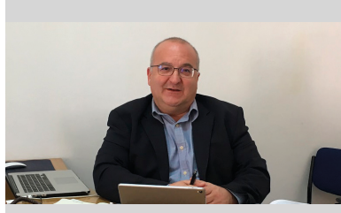
Çölyak Hastalığı ve Beslenme