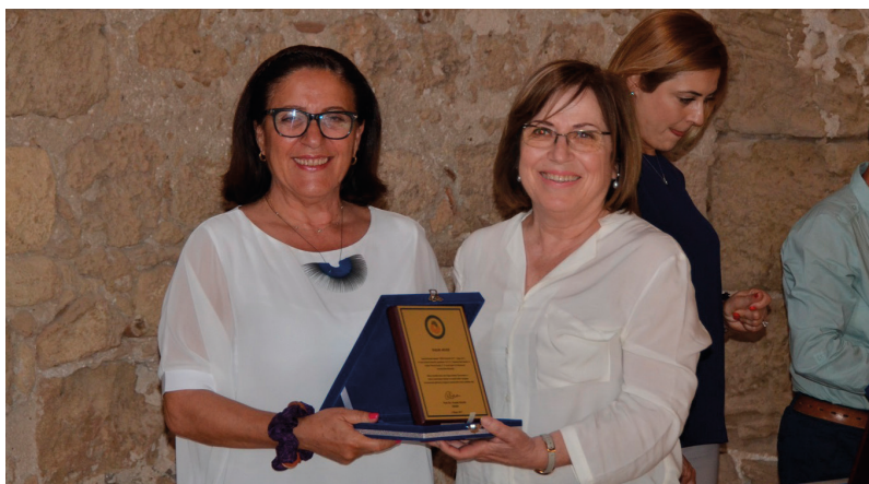
Etkinlikte eser sahiplerine teşekkür plaketi takdim edildi

Etkinlik, listelenen binaların sahiplerine ve etkinliğe katkı koyanlara plakelerin takdim edilmesinin ardından, mimarın bazı yapıtlarının posterlerinden oluşan sergi ve yaşamı ile eserleri konusundaki belgesel gösteriminin ardından sona erdi.