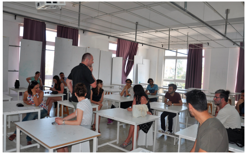
Hafta kapsamında atölye çalışmaları düzenlendi