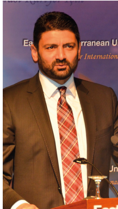
Bakan Sunat Atun

KKTC Ekonomi ve Enerji Bakanı Sunat Atun açılışta gerçekleştirdiği konuşmasında Bankacılık ve Finans Bölümü tarafından düzenlenen söz konusu konferansta bulunmaktan duyduğu memnuniyeti dile getirerek konferans sonunda ortaya çıkacak sonuç bildiğini de okumak istediğinin altını çizdi. Ekonomi ve Finans ile ilgili konular ko-