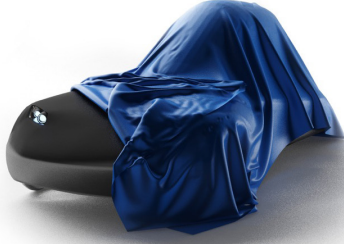
Mediterranean Shark ™ 2018

Doğu Akdeniz Üniversitesi (DAÜ), Rektörlüğe bağlı Elektrikli Araç Geliştirme Merkezi'nin (EVDC) tasarlayıp ürettiği "Mediterranean Shark" aracı ile TÜBİTAK tarafından düzenlenen Elektromobil 2018 Yarışması'nda temsil edilecek. Efficiency Challenge Electric Vehicle Yarışması 6-12 Ağustos 2018 tarihleri arasında Kocaeli Körfez Yarış Pisti'nde gerçekleştirilecek. Kuzey Kıbrıs Türk Cumhuriyeti'nden