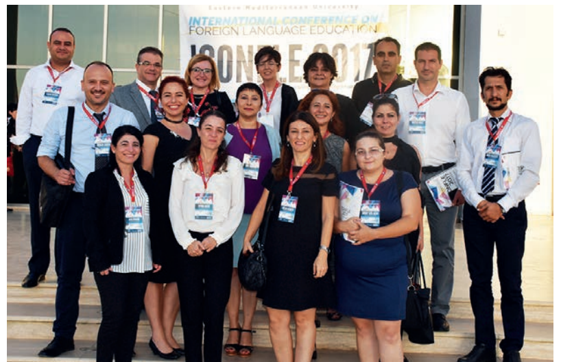
Konferansın düzenlenmesine katkıda bulunan DAÜ YDİHO öğretim görevlileri

Alanlarında uzman altı ana konuşmacının sunumlarının ve toplamda 60 bildirinin paylaşıldığı etkinlikte katılımcılar yabancı dil öğretimi alanındaki son yenilikler ve yaklaşımlar hakkında bilgi alışverişinde bulundular. DAÜ YDİHO Müdürlüğü tarafından yapılan açıklamada, YDİHO tarafından bu tür konferans ve mesleki gelişim etkinliklerinin DAÜ Rektörlüğü'nün desteğiyle düzenlenmeye devam edileceği ifade edildi.