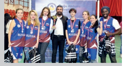
DAÜ Cup Of Nation Basketball 2017 Turnuvası Tamamlandı