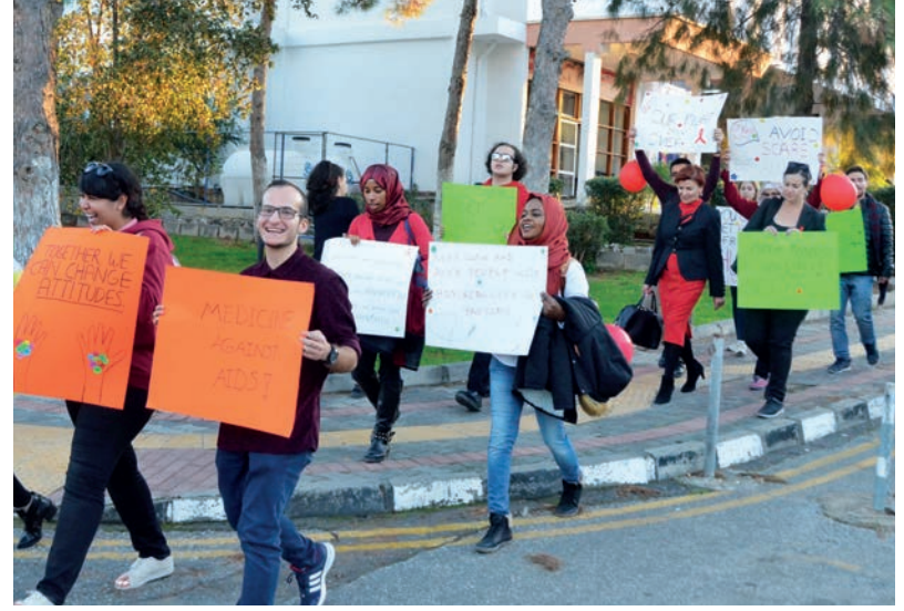
Pankartlarla yürüyüş yapılarak AIDS'e dikkat çekildi