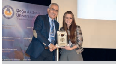
II. Sosyal Psikoloji Kongresi Gerçekleştirildi