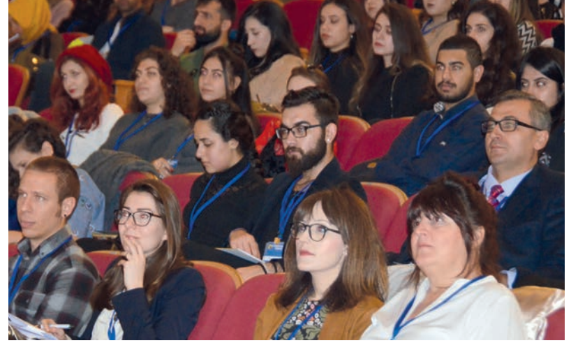
Kongreye katılım yoğun oldu