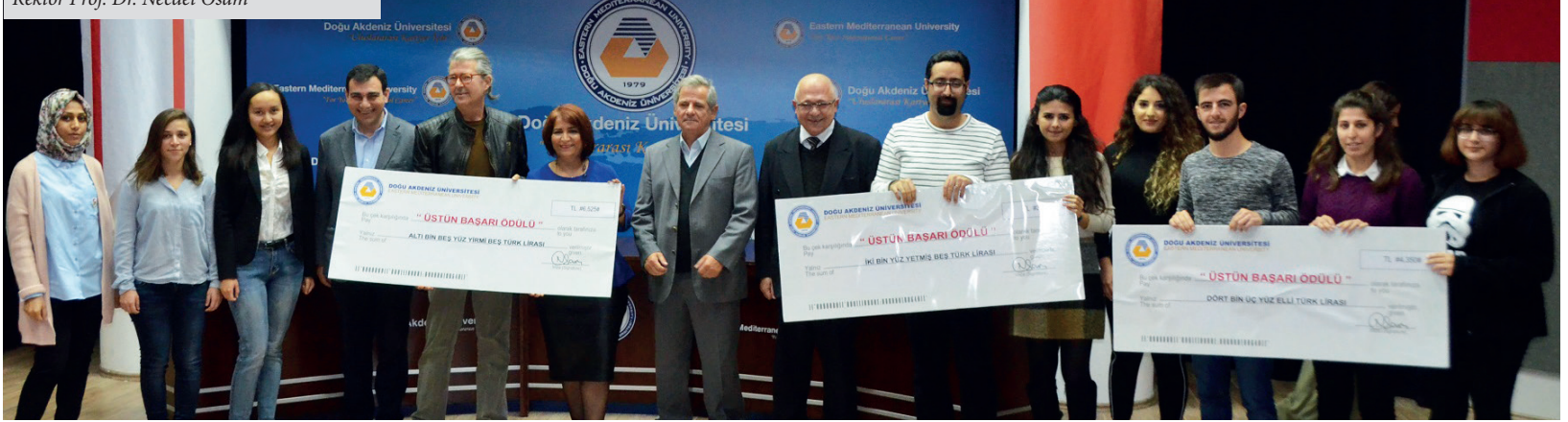
Törende başarılı öğrenciler nakdi çek ile ödüllendirildi