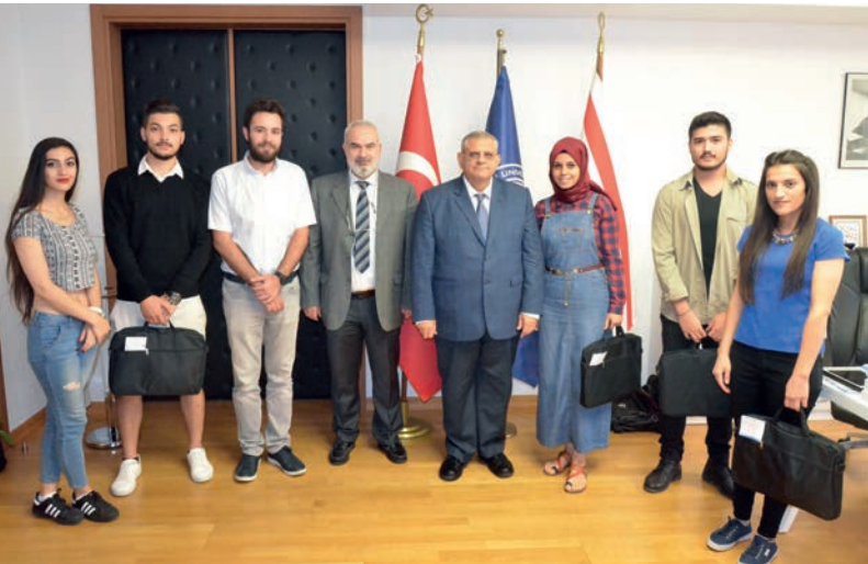
Başarılı öğrencilere Rektörlük Makamı'nda dizüstü bilgisayarları takdim edildi