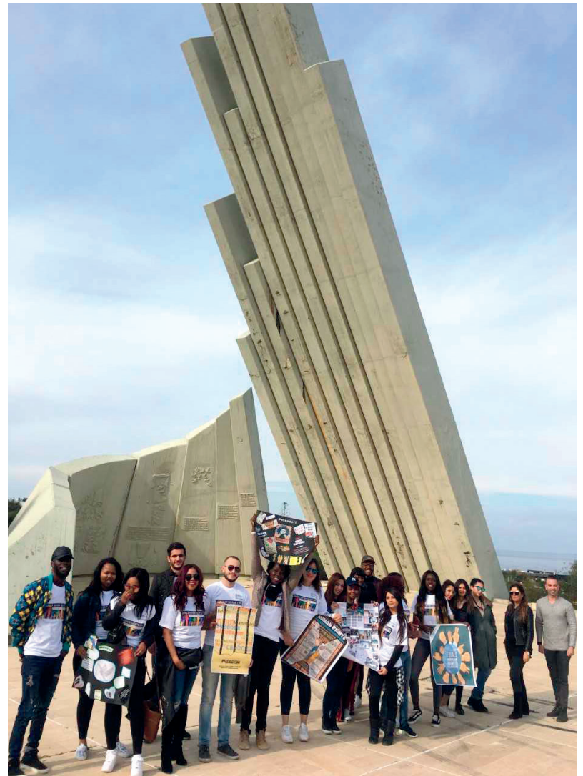
Turizm öğrencileri Girne Özgürlük Anıtı'nda