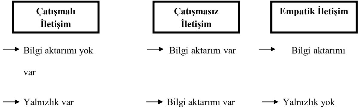
Şekil 1: Çatışmalı, Çatışmasız ve Empatik İletişimde Bilgi Aktarımı ve Yalnızlık

Şekil 1' de görüldüğü üzere çatışmalı, çatışmasız ve empatik iletişimde bilgi aktarımı ve yalnızlık verilmiştir. Çatışmalı iletişim kurmaya çalışan kişiler, yeterli bilgi edinemeyerek yalnız kalırlar. Çatışmasız iletişimde bireyler birbirine yeterli derece de bilgi aktarabilirler fakat yine de yalnızdırlar. Empatik iletişimde ise, hem yeterli bilgi aktarımı olur hem de bireyler yalnız kalmazlar (Dökmen, 2015).