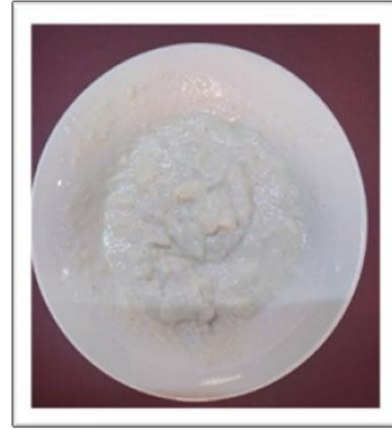
Glütensiz ekşi mayanın ikinci günü.