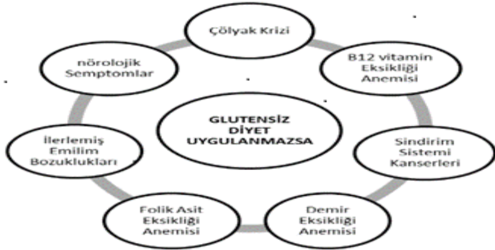
Şekil 1: Çölyak Hastalığında Yaşanılan Sorunlar

Hastalıkla ilgili ilk saptamalar 1888 yılında Samuel Gee tarafından yapılmıştır. 1940'lı yıllarda buğday ununun hastalık üzerindeki tesiri belirlenmiş ve bunun ana faktörünün de glutende bulunan gliadinin bire bir rahatsızlığı etkilediği saptanmıştır (Türksoy & Özkaya, 2006). Hassasiyet çocuklarda kronik ishal, büyüme geriliği, karın şişliği, demir eksikliği gibi problemlerle görülürken, daha büyük yaşlarda belirtiler daha hafif olmaktadır (Ün & Aydoğdu, 2003). Çölyak ile ilgili pek çok araştırma ve tahlil yapılmış olmasına rağmen şu ana kadar terk geçerli yöntem ömür boyu diyetdir. Yaşanılan illetten dolayı hasar ve sorunlar aşağıdaki tabloda belirtilmiştir (Ankara Başkent Hastaneleri, 2017).