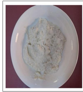
Dördüncü gün ve glütensiz ekşi maya hazır hale gelmiştir.