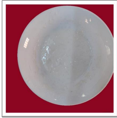
Glütensiz ekşi mayanın ilk günü.